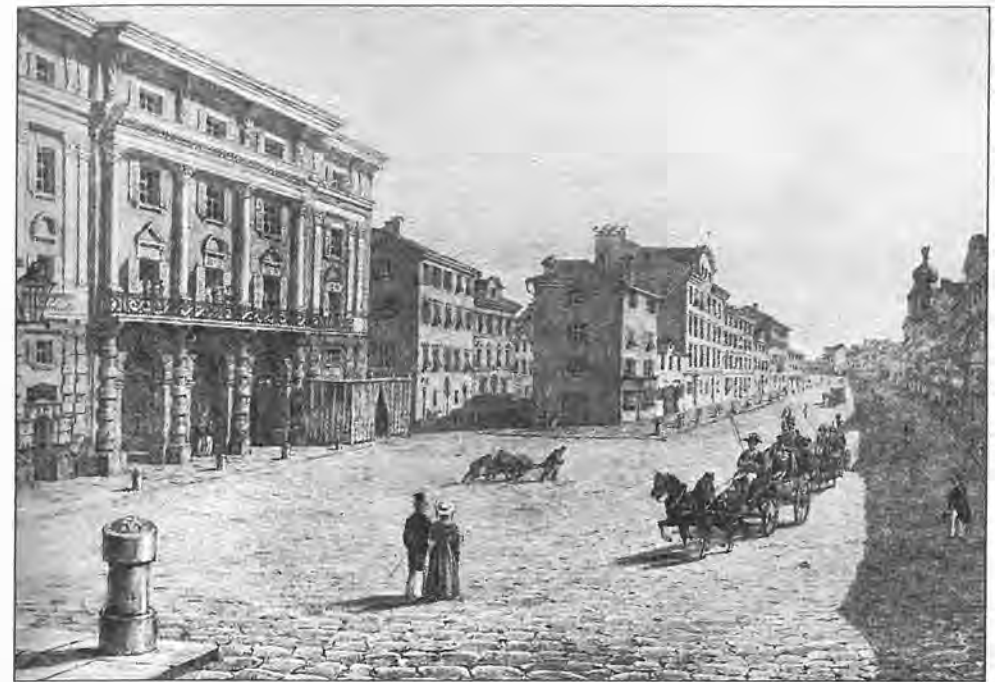
Jacob Alt, Rijeka, staro kazalište i korzo, litografija, 29 x 38,5 cm, 1832. (Pomorski i povijesni muzej Hrvatskog primorja, Rijeka)

O Faustinovu djetinjstvu i najranijoj mladosti nema pouzdanih podataka. Prve je poduke svakako morao dobiti od svoga oca, te je i sam nedvojbeno pohađao pučku gradsku školu na kojoj on predaje. Nažalost, nesredene obiteljske prilike i bolesti, očeva neuravnoteženost i sklonost alkoholizmu, stvarat će mnoge nevolje tako da će kronični nedostatak novca Suppéove vremenom dovesti na sam rub siromaštva. Srećom, dječak je od malena pokazivao veliku bistrinu i nadarenost, tako da će, unatoč svemu, tijekom školovanja u učenju postojano i uspješno napredovati.