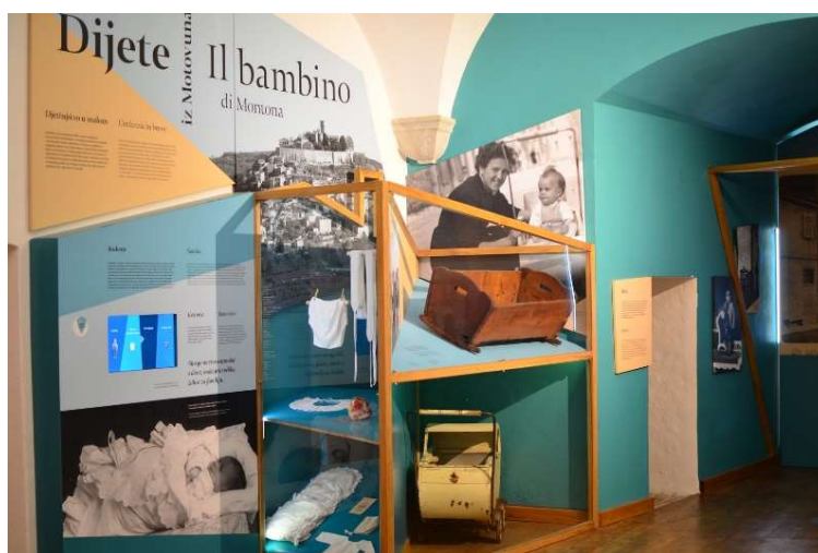
Slika 2. Predmeti iz prostorije posvećene djevojčici iz Motovuna