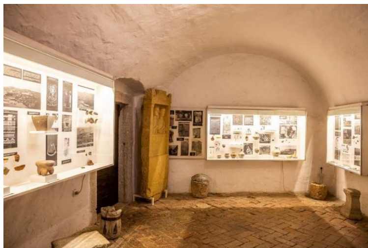
Slika 3. Pazinština od prapovijesti do srednjeg vijeka

Na međukatnoj razini (između prvoga i drugoga kata) Muzej je grada Pazina kao dio stalnog postava smjestio izložbu o životu i djelovanju biskupa Jurja Dobrile. Segment je to koji se nadovezuje na jednu veću izložbu o životu i djelu biskupa koja je smještena u njegovoj rodnoj kući u Velom Ježenju. 73 Rodna kuća pod ingerencijom je Muzeja grada Pazina.