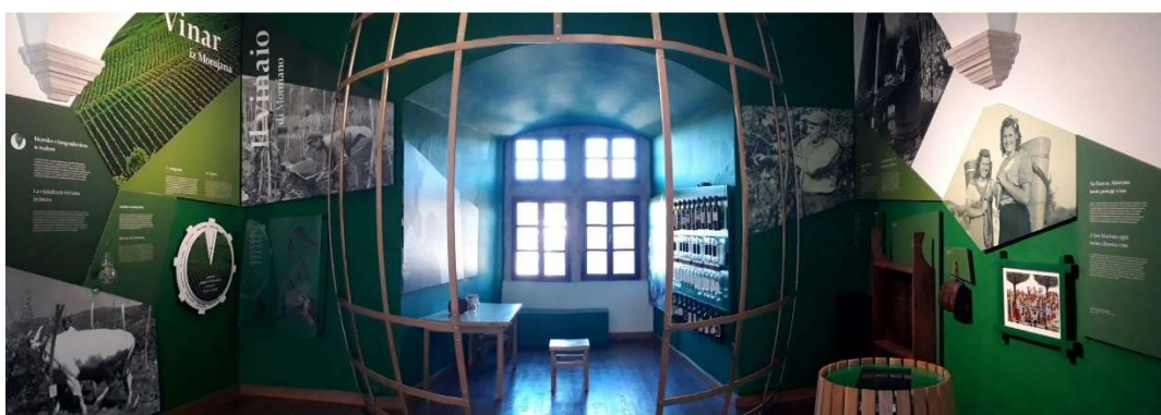
Slika 1. Druga prostorija stalnog postava Etnografskog muzeja Istre