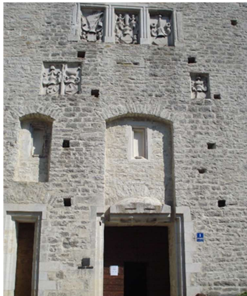
Slika 5. Grbovi na zapadnom pročelju Kaštela

Posjetom muzejima na zapadnom pročelju utvrde iznad ulaznih vrata sugerirano nam je da je Pazinski kaštel spomenik kulture upisan 1960. godine u Registar. Također naznačena je i godina prvog spomena Pazinskog kaštela i latinski mu naziv: Castrum Pisinum . Podaci su to koji posjetitelju sugeriraju kako je Pazinski kaštel jedan od najvrednijih primjeraka fortifikacijske baštine. U višim dijelovima pročelja prezentirani su i grbovi plemićkih obitelji koje su na posredan ili neposredan način odigrale značajnu ulogu u prošlosti Pazina te traka s natpisom koji spominje obnovu utvrde. Detaljnijih podataka o tome koje obitelji reprezentiraju grbovi i slično nedostaju.