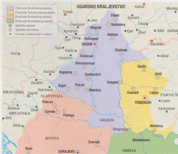
Osmanska uprava u Ugarskoj u 16. stoljeću

nja dunavskoga ratnog puta, njegove su ključne, dijelom napadačke utvrde služile poglavito za ustroj novijih zapadnih područja, dok su drugim dijelom postale sjedišta izgrađene vojničko-gradanske opće uprave, iz kojih se moglo nadgledati, upravljati i naplaćivati porez okolnim područjima. Ta se turska linija utvrda ukupno sastojala od oko 100-130 vojnika po utvrdi – kao otprilike i ona kojom je raspolagalo bečko ratno vodstvo. Stup višeslojnih lanaca manjih utvrda osnovao je nekoliko jačih utvrda (Budim, Pešta, Otrogon, Székesfehérvár i Temišvar), u kojima je služilo od 1000 do 1200 vojnika. Osim tih ključnih utvrda granicu su sa od 400 do 600 vojnika štitile sljedeće veće utvrde: Siget, Füleki, Hatvan, Jenő i Lipa. Treću razinu pogranične obrane sa od 100 do 300 vojnika ojačale su manje utvrde, a četvrtu su liniju činila utvrđenja s ojačanjem od palasida, dijelom tek nedavno pojačane (ograda).