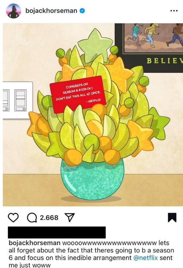
Slika 1: Kreativna promocija serije

Budući da se nalazimo u dvadeset prvom stoljeću, ne bi bilo loše spomenuti poklonički naboj koji se u obliku već spomenutih mrežnih paratekstova širi portalima, društvenim mrežama i svijetom marketinga. Na Instagramu i Twitteru profili kao što je Bojack horseman quotes još uvijek objavljuju „memeove“ i citate iz serije 23 , a do 2020. postojao je i „službeni“ profil fikcionalnog glavnog lika pod imenom BoJack Horseman koji je, između ostalog, trebao najaviti predstojeće sezone (slika br. 1).