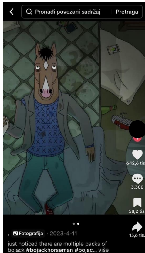
Slike 2 i 3: Kultura malodušnosti na društvenim mrežama na primjeru BoJacka i Sare Lynn