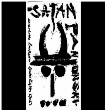
slika 1. cover albuma Ljuljamo ljubljani ljubičasti ljulj

Prvi samostalan album je Ljuljamo ljubljani ljubičasti ljulj iz 1989. godine. Na albumu se nalazi čak šesnaest pjesama među kojima je i „nenadmašni“ Lepi Mario . Od uvjetno rečeno poznatijih pjesama na albumu se još nalaze i Oči u magli , te Iza zida . Radi se većinom o kratkim punk pjesmama (najkraća traje samo nešto malo više od pola minute, a najduža pet minuta).