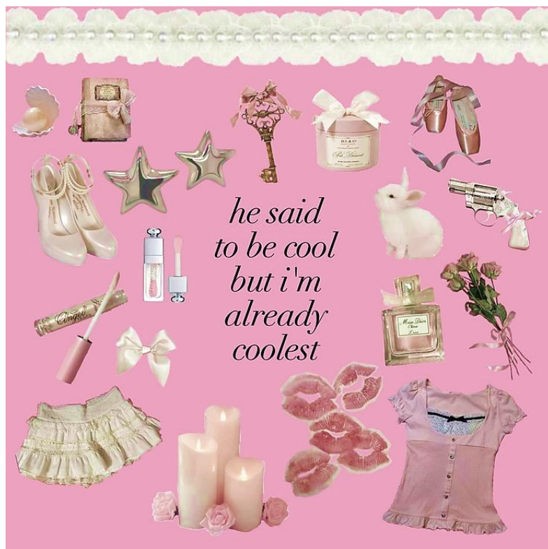
Slika 6: Primjer kontekstualno ženstvenih motiva popraćenih tekstom iz pjesme Lane Del Rey (@Angelskiss InSpring na Pinterestu).

distribuciju hiperženstvenih motiva tako u konačnici ne moduliraju kalupe u koje društvene norme postavljaju djevojke, tj. ne odbacuju stereotipno ženski karakterni i materijalni izričaj, već ih održavaju aktivnima, prekrivajući ih plaštem nedodirljivosti od njihovog sustavnog omalovažavanja i marginalizacije u javnom diskursu. Girlbloggerice stoga ne sudjeluju u radikalnom eliminiranju ženskih stereotipa već primarno suzbijaju njihove masovne degradirajuće interpretacije, težeći pritom javnom centriranju afirmativnog prihvaćanja tih stereotipa.