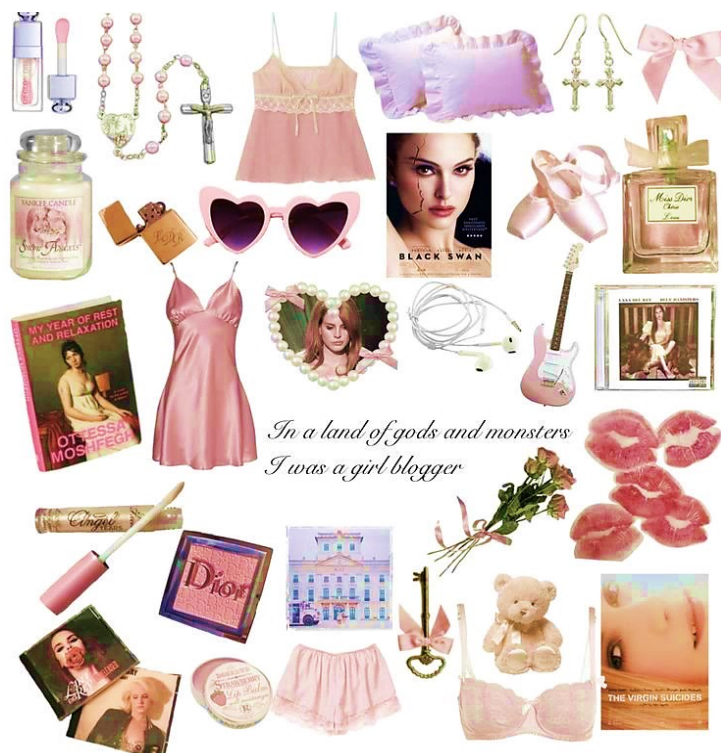
Slika 1: Zbirka klasičnih girlblogger motiva (@yourqueenofdisaster na Pinterestu).

za uljepšavanje, melankolične poezije, ženskih javnih i/ili fiktivnih ličnosti koje imaju određenu reputaciju u popularnoj kulturi te zadovoljavaju eurocentričan standard ljepote. Njihovo se online postojanje nalazi na sjecištu između zavodljive femme fatale , mistične manic pixie dream girl i krhke porculanske lutke. 3