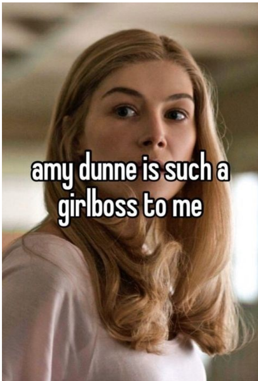
Slika 2: Lik Amy Dunne, jednog od filmskih idola girlblogger zajednice (@gateaualafraisee na Pinterestu).

kao female manipulator i objaviti kako je njihov idol Amy Dunne, a životni moto “ gaslight, gatekeep, girlboss ”. 5