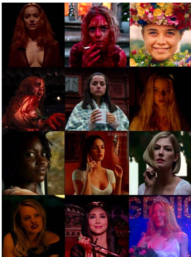
Slika 4: Glavni ženski likovi good-for-her filmova.

(koji je, za kontekst, uključivao stvari poput lažiranja otmice, ubojstva i podmetanja zločina drugim pojedincima) razuman odgovor na probleme s kojima se suočavala. Način na koji girlblogger zajednica romantizira filmove s (auto)destruktivnim glavnim ženskim likom s vremenom je čak i iznjedrio vlastiti filmski podžanr, tzv. good-for-her 7 filmove – njih specifično karakterizira tretiranje (standardno shvaćenog) devijantnog ponašanja ženskih likova kao njima prijeko potrebne katarze. Mogućnost stvaranja čitavog novog filmskog podžanra nam daje naslutiti kako se specifična dekodirana značenja proizašla iz procesa pregovaranja, uzastopno javljaju do mjere u kojoj počinju stvarati vlastitu ideološku dimenziju.