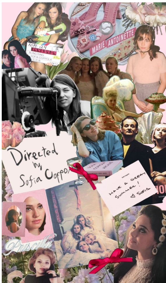
Slika 3: Kolaž motiva lika i djela Sofije Coppole.

Zbog Coppolinog specifičnog načina ekraniziranja djevojaštva kroz prikaz nježnih ženstvenih motiva popraćenih kompleksnim emocionalnim stanjima filmskih protagonistica, njezini su filmovi u svijetu girlbloggerica postali posebno važan materijal iz kojeg se značenja kodiraju i dalje distribuiraju u svojem izvornom formatu, pri čemu značajno pridonose daljnjem sadržaju ove supkulture.