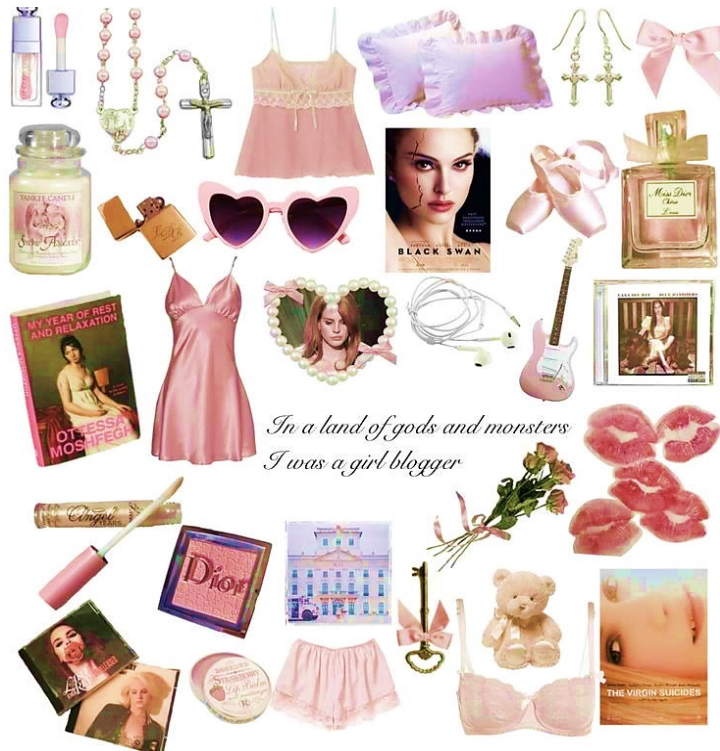
Slika 1: Zbirka klasičnih girlblogger motiva (@yourqueenofdisaster na Pinterestu).

za uljepšavanje, melankolične poezije, ženskih javnih i/ili fiktivnih ličnosti koje imaju određenu reputaciju u popularnoj kulturi te zadovoljavaju eurocentričan standard ljepote. Njihovo se online postojanje nalazi na sjecištu između zavodljive femme fatale , mistične manic pixie dream girl i krhke porculanske lutke. 3