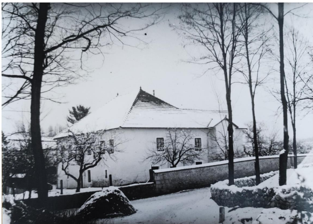
Slika 20: Fotografija dvora u Lipi (autor: Alfonsus Šibenik, izvor: Valentina de Lipa)

Osim što su obiteljske fotografije u kontrastu, tu su i slike dvora u Lipi, koji označava centar i glavnu točku mjesta. Ove obitelji su se slikale ispred njega, što dodatno naglašava njegovu važnost. Osim kontrasta između novih i starih obiteljskih slika, važan je i kontrast između slika samog dvora kroz različite vremenske periode.