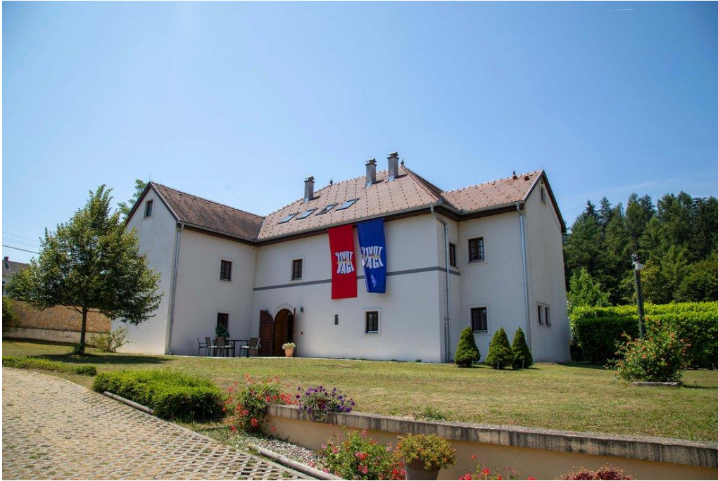
Slika 18: Fotografija dvora u Lipi za vrijeme tv show-a 'Život na vagi'