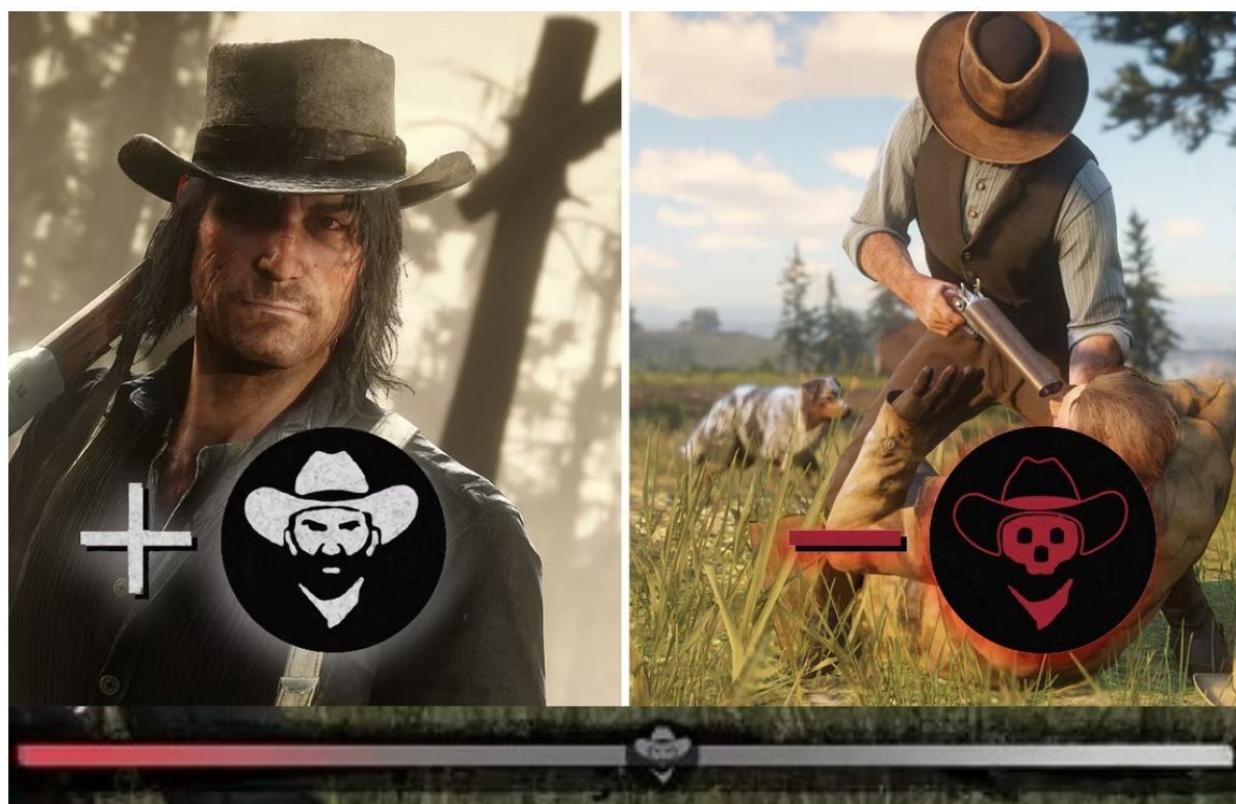
Slika 8 Na slici je prikazan moralni sistem s primjerom + i – na „moralnom metru“ u Red Dead Redemption 2 te se na dnu slike nalazi traka na kojoj se prikazuje moral lika tijekom igranja igre, a koji se mijenja s obzirom na odabire tijekom igranja

loši i činiti sve kako bi postali omraženi kauboји i dalje takvo ponašanje ostaje u interaktivnoj fikciji, a videoigru treba razlikovati od stvarnosti. Ipak, smatram da je većini igrača češći izbor u videoigrama da njihov lik krene „dobrim putem“, bez obzira na to što ponekad čine nemoralne stvari jer ih zabavljaju ili opuštaju takva djela u videoigrama, a koje bi se u stvarnom svijetu smatrale lošima. Na kraju je ipak bitna moralna prosudba u videoigri te da je moj odabir temeljen na etičkim vrijednostima kako bih za kraj priče oblikovala lika koji je ipak zadržao moral. Priča o Arthuru predstavlja njegovo iskupljenje, rast i spoznaju vlastite vrijednosti što čini ovu igru fantastično oblikovanim narativom, gameplayom, ali i zabavom.