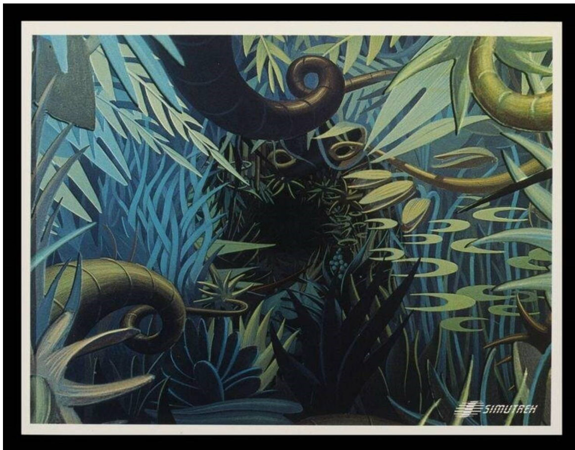
Slika 6 Fotografija iz videoigre „Cube Quest“, Paul Allen Newell, 1984, United States. Museum no. E.986-2008.