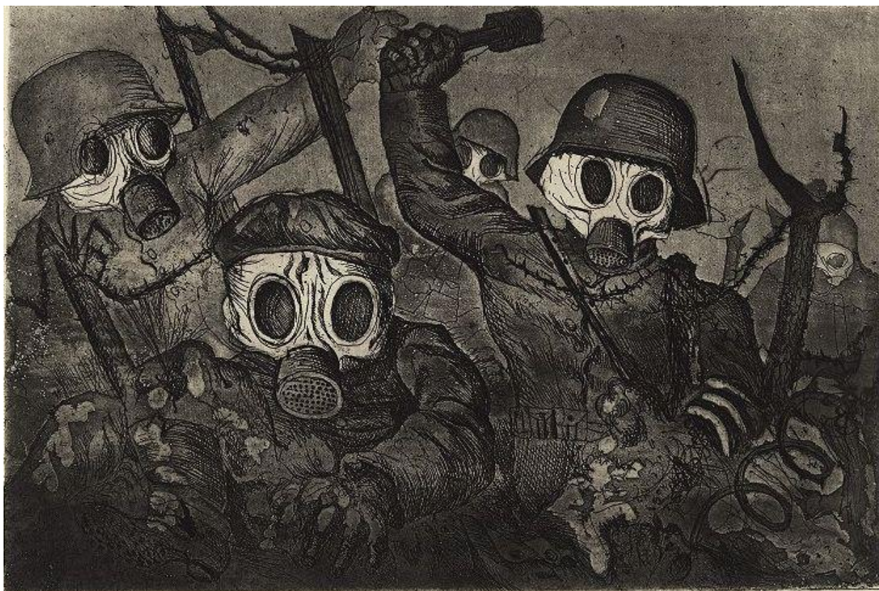
Otto Dix, Udarne trupe napreduju pod plinom (dio portifolije Der Krieg ), bakropis, akvatinta i suha igla, 1924., British museum, London, Ujedinjeno Kraljevstvo