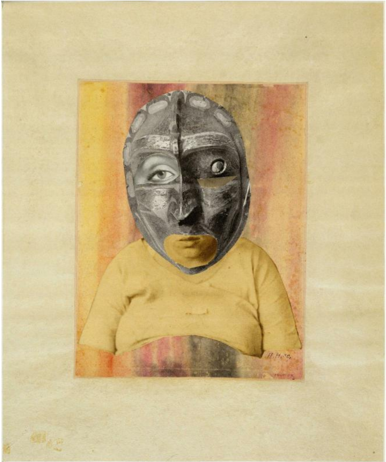
Hannah Hoch, Le Mere , akvarel i kolaž, 1930., Centre Pompidou, Pariz, Francuska