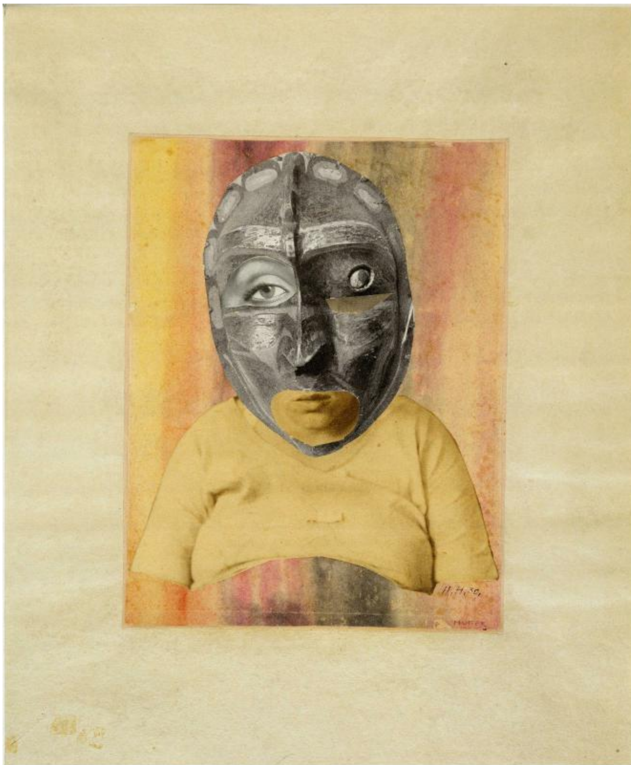
Hannah Hoch, Le Mere , akvarel i kolaž, 1930., Centre Pompidou, Pariz, Francuska