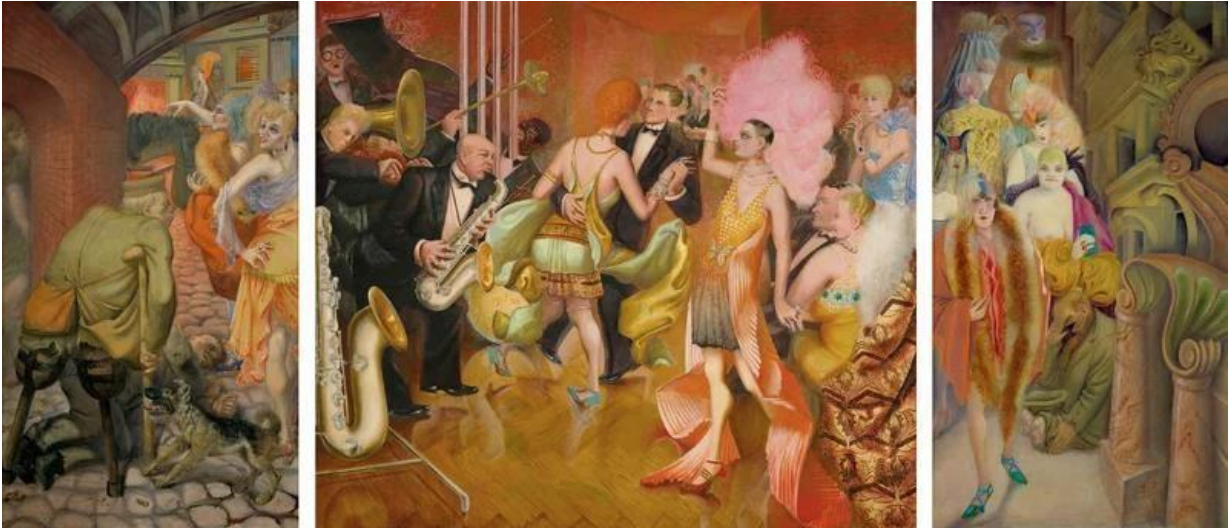
Otto Dix, Metropolis , tempera na drvu, 1928., Umjetnički muzej (Kunstmuseum), Stuttgart, Njemačka