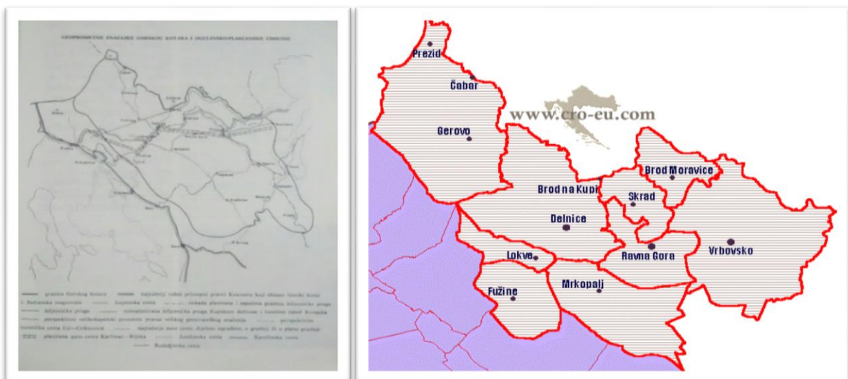
Slika 01. Granice Gorskog kotara nekad i danas

Problem definiranja granica Gorskog kotara na istoku i jugoistoku oduvijek predstavljaju problem. Naime, na istoku Gorski kotar dodiruje se s Ogulinsko-plašćanskom udolinom i Karlovačkim Pokupljem. Poneki autori svrstavaju ovo prijelazno područje u Gorski kotar, dok neki smatraju to područje odvojenom cjelinom, iako zemljopisne razlike i nisu toliko izrazite (očita je različitost višeg i šumski zatvorenog gorskog bloka i otvorenih pejzaža niže krške ploče).