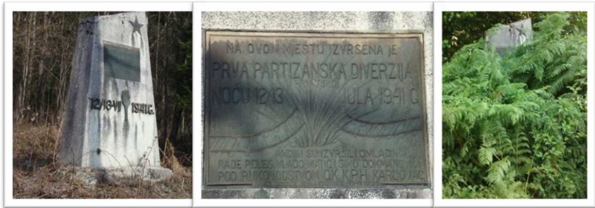
Slika 03. Spomenik prvoj partizanskoj diverziji, Moravice

Dakle, preko velikog partizana u borbi uz kojeg se nalazi žena u kriku i dva reljefa, prikazana je povijest moravačkih antifašista u Narodnooslobodilačkoj borbi. Ovaj spomenik nalazi se u središtu parka ispred osnovne i srednje škole te se oko njega formirao razmještaj cijelog parka. Zanimljivo je da je tekst na spomeniku napisan samo na ćirilici te je na taj način uskraćena informacija o spomeniku posjetiteljima koji se ne koriste ćirilичnim pismom. Slova uništena od zuba vremena, obnovljena su 2012. godine od strane Grada Vrbovskog, koji je ujedno obnovio i preuredio cijeli park. 34