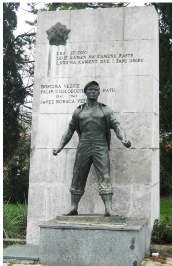
Slika 6: Vinko Matković: spomenik palim borcima, Vežica, (1959.)

Spomenik palim borcima, posvećen radnicima Vežice, nastao je 1959. godine. I ovaj je, kao i mnogi Matkovićevi spomenici preuzeo je shemu realističnog borca. Postavljen je na podestu od kamenih blokova koji sadrže tekst: „Kraj je ovo gdje kamen na kamenu raste ljudima na kamenu žive i žanj umiru“. Na drugom se kamenom podestu nalazi figura radnika, atletske građe sa ponovljenom karakteristikom realistične manire, te geste suzdržane snage i odlučnosti. Razaznaju se već poznati kodirani kiparski modeli koji su bili uzori jednom običnom čovjeku a bliski radnim ljudima. Spomenik je postavljen u blagom kontrapostu, da bi se naglasilo istupanje za prava radnika. Iako nema oružje, možemo razabrati emocije bunta i revolta koji se javljaju u snazi radnika. 86