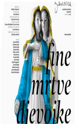
Slika 2: Kompromitirajući plakat predstavljen za predstavu „Fine mrtve djevojke“

Iza susretljivosti i ljubaznosti sustanara Ive i Marije, sakrivaju se mračne strane i motivi koji na vidjelo izlaze u trenutku kada susjedi saznaju kakav odnos Iva i Marija gaje jedna prema drugoj. U otkrivanju tajne koju su Iva i Marija krile se zapravo otkrivaju karakteristike ostalih likova filma. Da se tajna nije otkrila, ostali stanovnici tog kvarta živjeli bi uobičajenim životom. Otkrivanjem seksualne orijentacije svojih sustanara, otkriva se mračna strana Hrvatske realnosti. Naime, Matanić je na primjeru filma „Fine mrtve djevojke“ pokazao koliko je društvo netolerantno i puno mržnje, spremno ići do mjere ubojstva koje se na kraju filma i dešava u slučaju Marije koju sustanari bace po stepenicama, te ona umire. Prikaz realnosti hrvatskog društva, ne prikazuje se samo u filmu već i putem reakcija na film i kazališnu predstavu, a posebice plakat postavljen za potrebe predstavljanja predstave u kazalištu Gavella. Dizajner plakata bio je Vanja Cuculić, autor brojnih plakata i stalni suradnik kazališta Gavella, umjetnik uvršten na listu 115 najznačajnijih suvremenih hrvatskih umjetnika koju je objavio internetski portal engleskog vodiča Time Out Croatia. 14