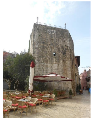
Slika 6: Peterokutna kula na samom početku Decumanus ulice (1474.)

Druga veoma bitna kula nalazi se na samom početku Dekumanove ulice. Radi se o Peterokutnoj kuli koja je u vrijeme svojeg nastanka predstavljala zajedno s kopnenim vratima ulaz u grad. „Nasuprot Peterokutnoj kuli nalazila se još jedna četvrtasta kula. Zajedno s gradskim vratima srušena je u 19. stoljeću, nakon što je izgubila svoju višestoljetnu obrambenu funkciju.“ 58 Danas se u Peterokutnoj kuli nalazi restoran, što možda i nije najbolje rješenje za kulturnu baštinu