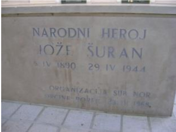
Slika 13: Spomenik Jože Šurana u Višnjanu

se može rekonstruirati ukoliko „pamćenje također djeluje rekonstrukcijski. Prošlost se neprestano reorganizira kroz promjenjivi relacijski okvir sadašnjosti što se kreće unaprijed.“ 71 U tom smislu, simbolika i značaj kipa Joakima Rakova u doba Jugoslavije je nešto sasvim drugo od onog što on predstavlja danas.