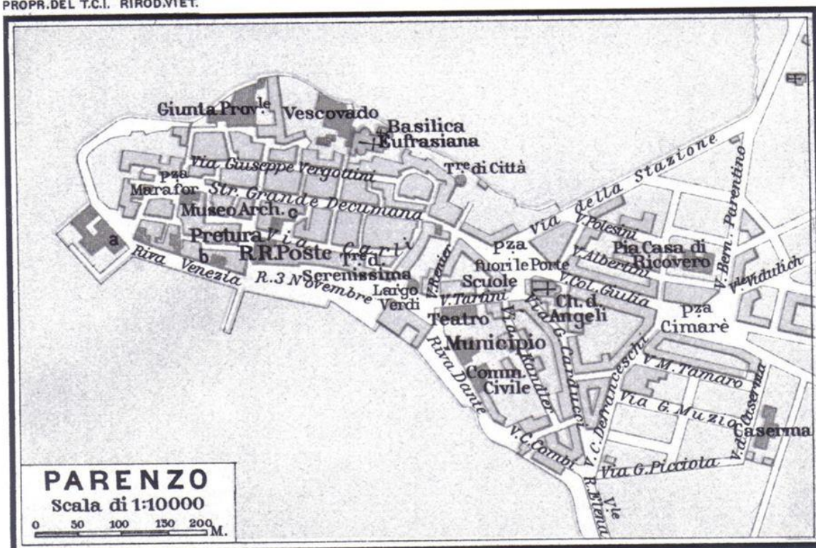
Slika 18: Karta Poreča za vrijeme Italije, 1920. godina

Kako je urbani prostor služio jednoj vrsti poruke, imena ulica i javnih mjesta su također morala biti prilagođena vladajućima. U gradu se slavila pobjeda nad fašizmom tako što su se mijenjali nazivi ulica i trgova u hodonime jugoslavenske orijentacije. Osim u Poreču, po cijeloj su se Istri tada mogli naći hodonimi koji su označavali socijalizam, bratstvo i jedinstvo, te općenito cijeli jugoslavenski, odnosno poslijeratni socijalistički režim. Vrijeme prije Jugoslavije obilježilo je gradske ulice mnogobrojnim talijanskim imenima kao što je Riva Venezia ili Piazza dei Signori , no nakon pripojenja Jugoslaviji u Poreču su osvanuli brojni novi hodonimi. Faktori ove transformacije su definitivno politički. Politika se jasno očitava u svakom novom nazivu koji je postavljen kao nositelj značenja određenog prostora. Danas se neke od tih hodonima više ne može naći u toponimiji, no tada su oni bili istaknuti komemorativni nazivi. Radilo se o vrlo striktnim političkim poslijeratnim akcijama koje su imale ulogu što prije legitimizirati trenutnu političku moć.