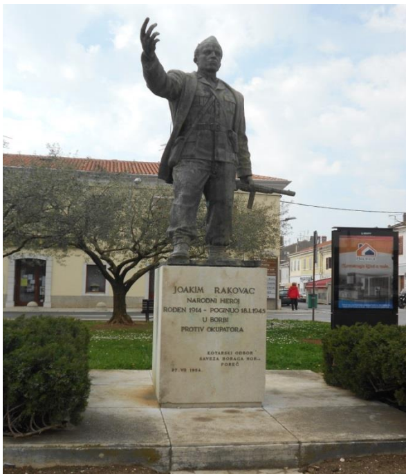
Slika 12: Kip Joakima Rakovca na Trgu Joakima Rakovca

Jedan od važnijih spomenika u Poreču je svakako kip Joakima Rakovca. Postavljen u središtu istoimenoga trga, predstavlja sve ono za što su se istarski seljaci nekada borili. Iako se danas vode brojne polemike vezane uz Joakima Rakovca (kao npr. da je bio njemački špijun), on je bio i ostao jedan od najznačajnijih povijesnih ličnosti u Istri. Kao što je već