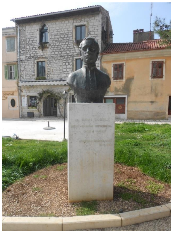
Slika 14: Kip Jurja Dobrile - preporoditelja istarskih Hrvata

se i u ponašanju prema njima od strane političkog sastava grada. Svake godine se posjećuju na bitnije svetkovine i samim time ne zaboravljaju. U neku ruku može ih se nazvati mjestima sjećanja koja su „u isti mah materijalna, simbolička i funkcionalna.“ 74 Oni su prikaz početka jedne vlasti u prošlom stoljeću te preko njih vidimo što je takva vlast štovala i što je bilo