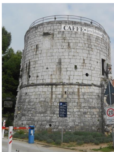
Slika 7: Okrugla kula na Narodnom trgu (1474.)