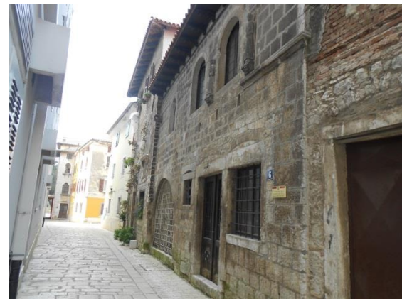
Slika 9: Kuća dva sveca izgrađena u 15. stoljeću

Nakon Drugog svjetskog rata u kući se kratko vrijeme nalazio lapidarij, no on je ubrzo premješten u glavni muzej, odnosno palaču Sinčić. Žalosno je to što kuća trenutno izgleda veoma oronulo i neodržavano iznutra, jer se konkretno kroz prozor vide nabacane stvari po prostoriji. Povezano sa stanjem, još je čudnije upravo to što je na kući postavljena ploča