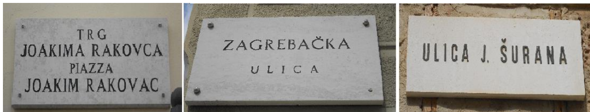
Slika 19: Ploče s nekim od hodonima u Poreču

na konstrukciju identiteta u Republici Hrvatskoj. Kao što je Damir Hrvatin istaknuo, „mijenjali su se nazivi tzv. „socijalističke“ povijesti u nazive hrvatske i istarske povijesti.“ 109