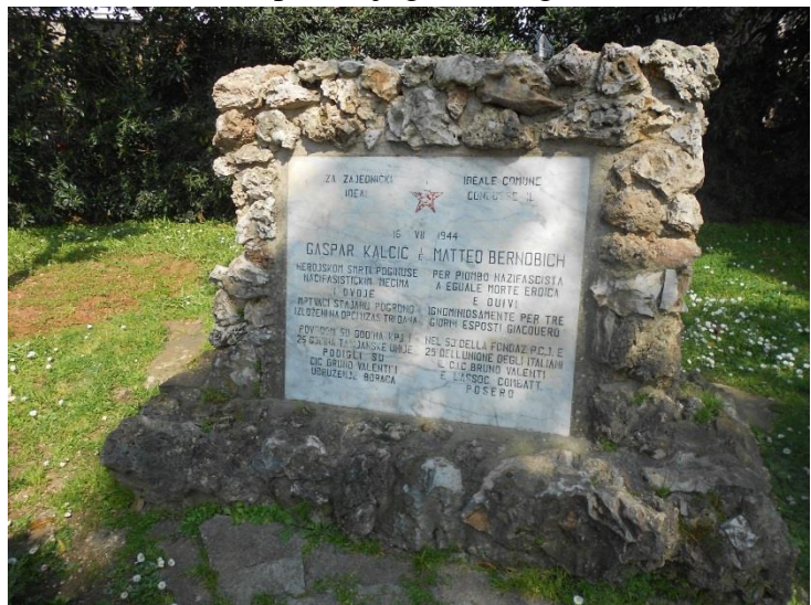
Slika 16: Spomenik istaknutim antifašističkim borcima – Gašpar Kalčić i Mateo Bernobić

Komemoracija antifašističkih boraca u toponimiji Poreča najviše se vidi u nazivu ulica, zatim na primjeru jednog trga, obale i parka.