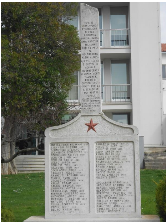
Slika 17: Spomenik istaknutim žrtvama i borcima protiv fašizma u Poreču

Zadržavanjem određenih kulturnih vrijednosti, isticanjem ili brisanjem drugih kulturnih vrijednosti pokazuju se jasne političke poruke građanima. Time se aktivno utječe na izgradnju identiteta grada prema zadanim okvirima. Komunikacija i interakcija zadanih kulturnih simbola od strane političke moći na neki način usmjeravaju kolektivno pamćenje građana i gledanje na zajedničku povijest. Zato je promjena vlasti sve samo ne jednostavna akcija. Ona označava novi poredak i vrednovanje novih društvenih i kulturnih vrijednosti. U principu, radi se o rekonstrukciji kulture sjećanja.