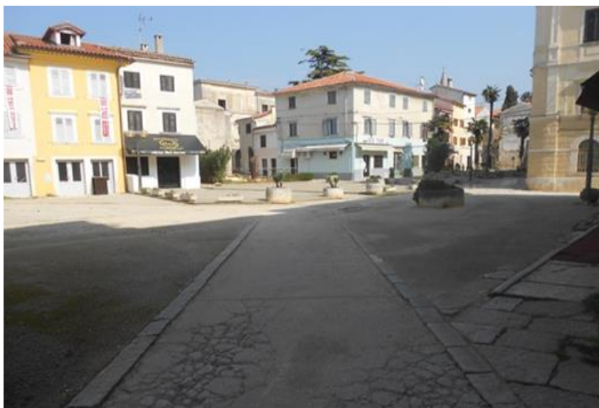
Slika 3: Trg Marafor – nekadašnji rimski forum

Danas trg nema neku posebnu ulogu osim onu kulturno-turističku. Zimi trg biva prazan kao na slici, no ljeti je ipak malo življa situacija. Kao dio kulturne baštine uvijek je ostao istaknut kao trg bitan za rimsko razdoblje.