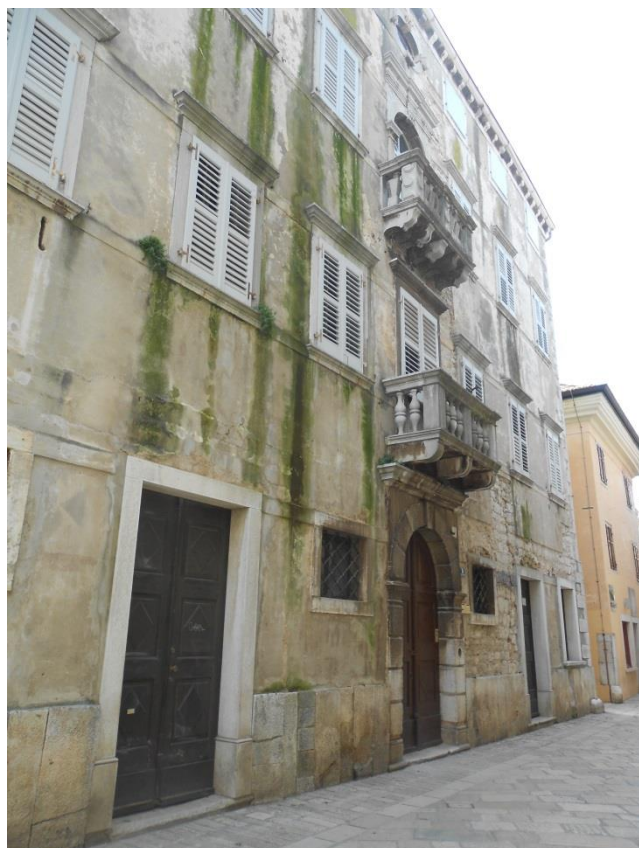
Slika 11: Palača Sinčić – Zavičajni muzej Poreštine

razgledavaju jer nisu zabačene. Ovdje se cijela problematika usmjerava naravno na ekonomsku vrijednost kulturne baštine. Kulturna baština koja pridonosi boljem ekonomskom stanju u Poreču uvijek je više mamila pažnju upravi grada, dok se ostala zanemarivala. Iako je Kuća dva sveca poznato kulturno dobro Poreča, nije na prometnom mjestu i tu se javlja problem koji se jasno uviđa. Kulturna i ekonomska vrijednost kulturne baštine trebale bi se ispreplitati i nadopunjavati, a ne isključivati kao u ovom slučaju.