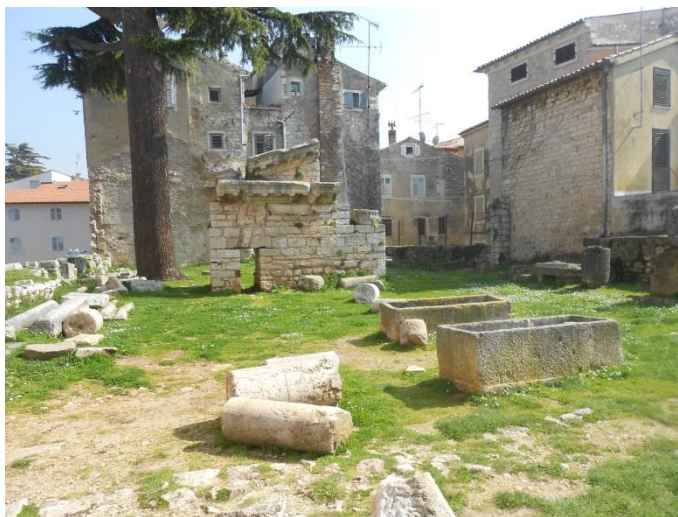
Slika 4: Ostaci Rimskog hrama iz 1.stoljeća

Nedaleko od foruma, odnosno na samom kraju polutoka smješten je Rimski hram koji datira skroz u 1. stoljeće nove ere. Zapravo se radi o ostacima rimskog hrama, poznatog još kao Veliki hram. „Veliki hram, pored onog u Ninu, bio je jedan od najvećih antičkih hramova na obali Jadranskog mora. Njegov jednostavni ukras ide u red klasičnih stilizacija spomenika na istočnoj obali Jadrana (Solin, Zadar, Pula i Trst).“ 57 Iznimno je važan za cijelu kulturnu baštinu Poreča, kao i antičke ulice jer predstavlja relativan