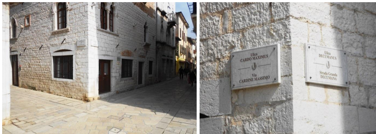
Slika 2: Mjesto gdje se ulice Decumanus i Cardio Maximus presjecaju

i okomite sektore grada. Središnja ulica bila je namijenjena spajanju početka i kraja poluotoka na kojem je bilo svetište, a presjeca je Cardio Maximus u smjeru sjever-jug.