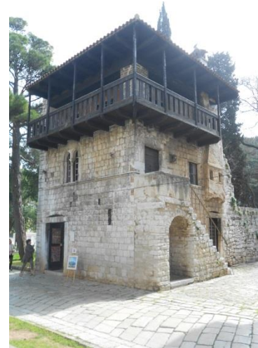
Slika 8: Romanička kuća

Prvenstveno, ako se fokusira na Romaničku kuću, vidjeti će se jedan od rijetkih primjera romaničke arhitekture u Dekumanovoj ulici. Radi se o zasebnoj kući u blizini starog foruma. Veoma je upečatljivog izgleda i datira skroz u 13. stoljeće. Na kući su se odvijale brojne restauracije tijekom godina, ali ona je u suštini zadržala svoj izvorni oblik. „Do Drugog svjetskog rata građevina je bila u sklopu stambenog bloka koji je uništen bombardiranjem i nije kasnije obnovljen, te danas Romanička kuća stoji kao samostalan objekt.“ 62