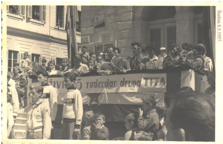
Slika 21: Doček Štafete ispred današnje zgrade kina (1957.)

je 30. travnja proglašen praznikom Poreča ima zvijezdu koja je u političkom svijetu čisti komunistički simbol.