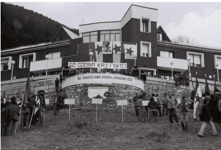
Slika 22: Učka - Marš na Učku

određenim događajima na području Istre i Primorja. Marš na Učku bio je „organiziran tako da bi se 1. travnja svi sudionici okupili na odmorištu Poklon na Učki, gdje je na taj dan 1944. godine formirana Prva Istarska brigada „Vladimir Gortan“ i održana Prva oblasna konferencija USOH-a za Istru.“ 129 Sudionici su bili većinom iz Istre i Primorja, a sudjelovanjem se poticalo kolektivno sjećanje. Sam događaj bio je i povod za druženje koje je još jedno bilo obojano političkim bojama. Ključan trenutak NOB-a lokaliziran je mjestom sjećanja na Učki i time je postalo simboličko mjesto koje se iznova izražavalo u sjećanju na nasljedstvo. Ovaj običaj se prestao održavati nakon Domovinskog rata, no prošle je godine pokrenut projekt u kojem bivši predsjednici omladine sastavljaju Zbornik Marša na Učku. 130 Time se žele arhivirati sjećanja običaja kao jedno kolektivno pamćenje prikupljeno od individua.