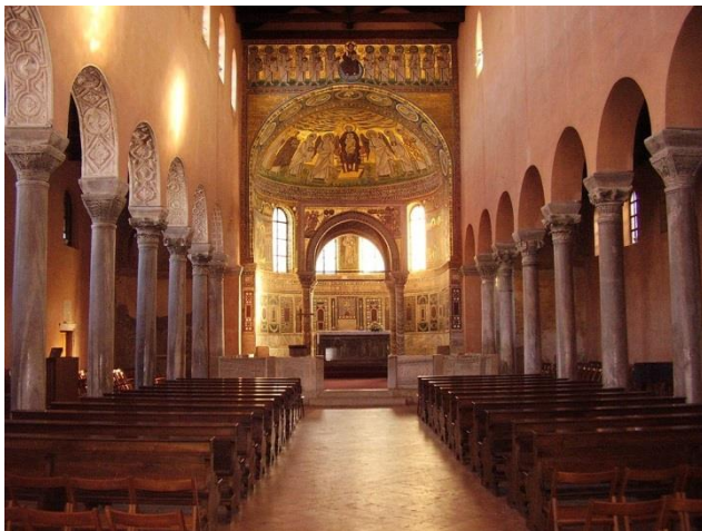
Slika 15: Unutrašnjost Eufrazijeve bazilike

Eufrazijeva bazilika izgrađena je na temeljima starokršćanske crkve za vrijeme biskupa Eufrazija i cara Justinijana u 6. stoljeću. Njezini ostaci sežu skroz u antičko doba kada je ona bila tajna crkvića, dok je danas svjetski poznata baština. Vrijednost Eufrazijeve bazilike za Poreč je nenadmašiva te se može reći kako za grad nema važnije kulturne baštine. Osim toga što nosi titulu najprestižnije materijalne kulturne baštine u Istri, riječ je o kulturno-