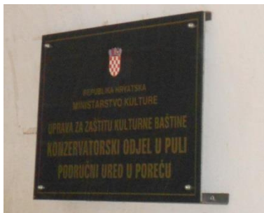
Slika 10: Ploča u lučnom ulazu Kuće dva sveca

Ministarstva kulture Republike Hrvatske, a sama se kuća, kao što je naglasila Elena Uljančić Vekić, nalazi u vlasništvu Zavičajnog muzeja Poreštine. Kulturna politika koja je u svakom slučaju prvenstveno usmjerena prema očuvanju i zaštiti kulturne baštine, ovaj put je malo zakazala.