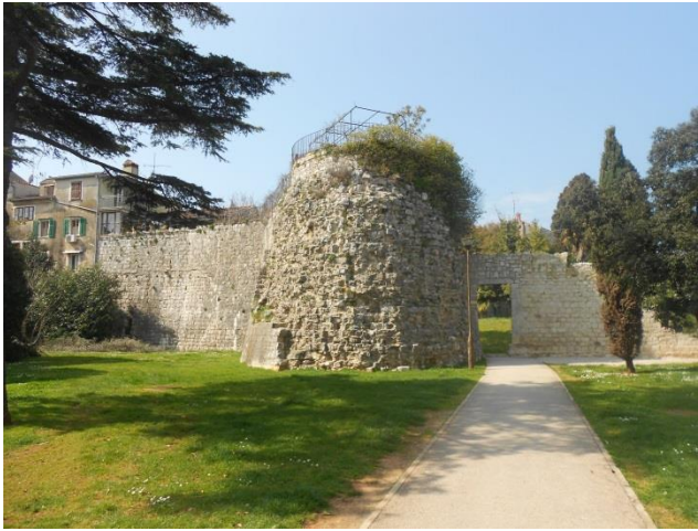
Slika 5: Sjeverna obrambena kula koja se nalazi uz uvalu Peškera (1473.)

nadograđivao na te vrijednosti, ali u suštini ostao isti. Svaka kulturna politika i politički događaji koji su se odvijali nakon rimskog doba suživjeli su s tim građevinama kao što i mi danas suživimo s njima.