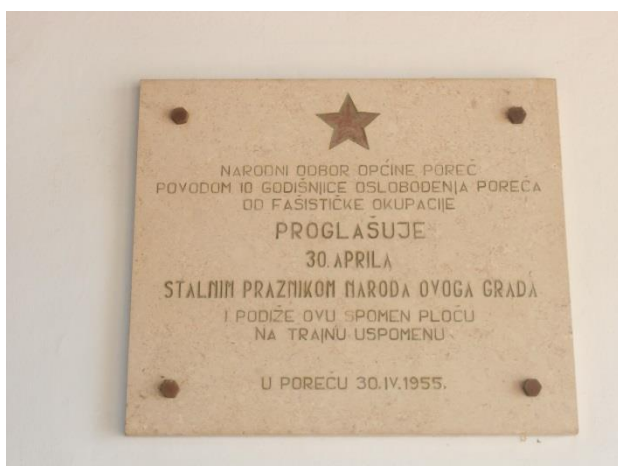
Slika 20: Ploča postavljena na zgradi Općine Poreč

sjećanje na dan kada se grad oslobodio od okupatora te brojna kulturna događanja, održava se sjednica Gradskog vijeća i obilaze se komemorativna mjesta koja utvrđuju sjećanja na ratna događanja. Ceremonijalno se polažu brojni vijenci pored antifašističke materijalne baštine i time se simbolizira velik značaj antifašističkog pokreta za grad. Ovim sjećanjima se potvrđuje svjesnost o prošlosti i utvrđuje pozicija s koje se gleda na nju. Primjer se može naći u govoru koji je održao gradonačelnik Poreča, Edi Štifanić, na ovogodišnjoj obljetnici oslobođenja od okupatora. On ističe: „ Način na koji mi slavimo Dan oslobođenja Grada Poreča, dostojanstveno, s ponosom i zahvalnošću jednako tako pokazuje kakav je Poreč grad. Grad koji se ne srami antifašizma. Poreč prepoznaje vrijednosti koje smo dobili narodnooslobodilačkom borbom i žrtvom boraca u Drugom svjetskom ratu. I naravno, ne treba izjednačavati antifašizam i komunizam, ali to ne znači da smijemo negirati antifašizam koji je u temeljima ovoga grada. “ 127 Ovom izjavom se samo potvrđuje ono što je i vidljivo u gradu, a to je da su temeljna usmjerenja kulturne politike Poreča već odavno utvrđena i nadalje se mogu samo nadograđivati.