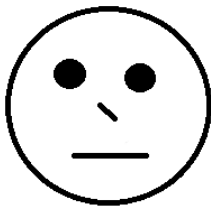
Slika 7. Ispremešteno lice (Ramachandran 2013:75)