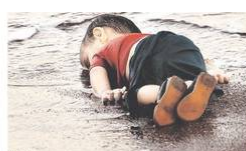
Un niño sirio muerto tras intentar cruzar el mar Egeo para llegar a la isla de Lesbos.

Decidiamo noi, non Bruxelles. Decidiamo noi, non Bruxelles. Decidiamo noi, non Bruxelles.