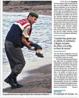
Un niño sirio muerto tras intentar cruzar el mar Egeo para llegar a la isla de Lesbos.