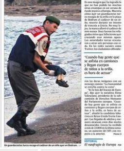
Un niño fallecido tras intentar cruzar el mar Mediterráneo en un bote.

Ante la escasa respuesta otorgada a la llegada de refugiados, la foto del cadáver de un niño simboliza la dimensión de la tragedia