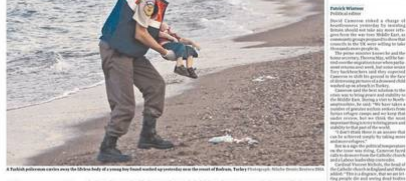
Un niño muerto tras intentar cruzar el mar Mediterráneo en un bote inflable.

The shocking, cruel reality of Europe's refugee crisis. The shocking, cruel reality of Europe's refugee crisis. The shocking, cruel reality of Europe's refugee crisis.