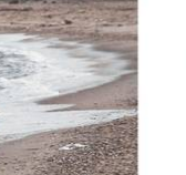
Un niño muerto tras intentar cruzar el mar Mediterráneo en un bote inflable.

Er is een kind verdronken. Er is een kind verdronken. Er is een kind verdronken.