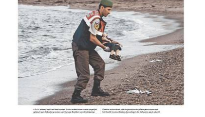
De foto werd gepubliceerd op de BBC-website. Het toont het lichaam van een jongen die is overleden op het strand van Lesbos, Griekenland.