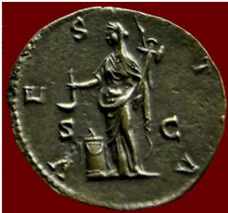
Slika 6. Novčić iz 164. g. po Kr. na kojem je prikazana Vesta

Na novčiću iz 164. g. po Kr. (Sl. 6) vidimo Vestu pored oltara s kojeg gori plamen. Ona u jednoj ruci drži posudu kojom su svećenici pretakali vino na obredima, a u drugoj ruci joj je drveni kip Atene iz Troje, koji je prema legendi Eneja postavio u hram Veste.