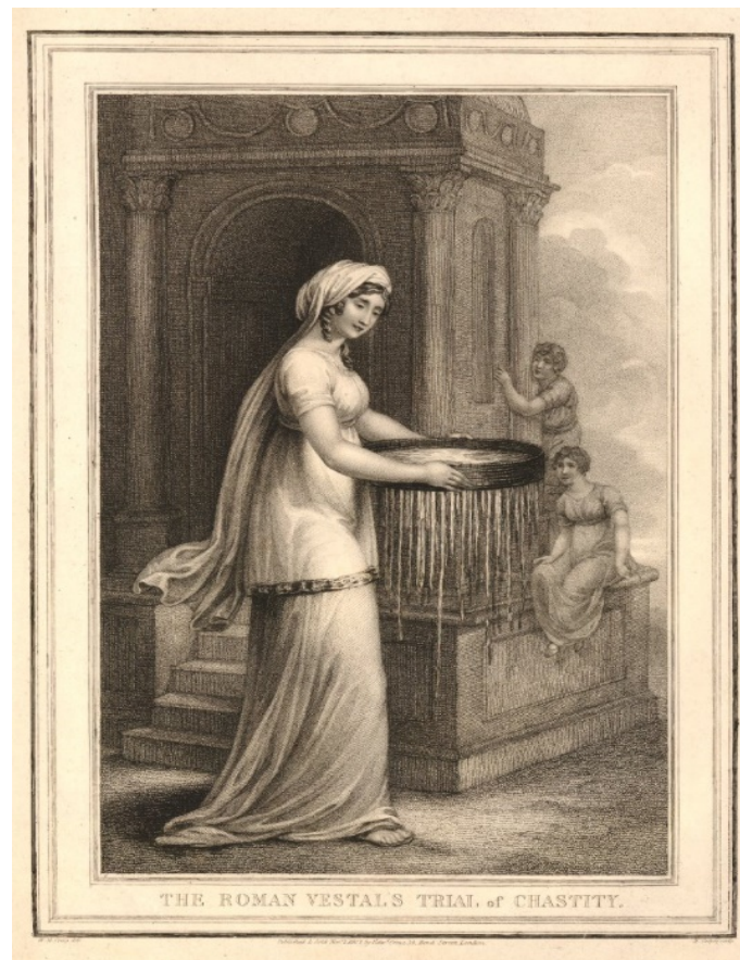
Slika 8. Vestalka Tukija u izvođenju čuda, idejni prikaz

Na slici 8. iz 1807. g., vidimo idejni prikaz Vestalke Tukije u izvođenju čuda kada je nosila vodu u situ kroz Forum.