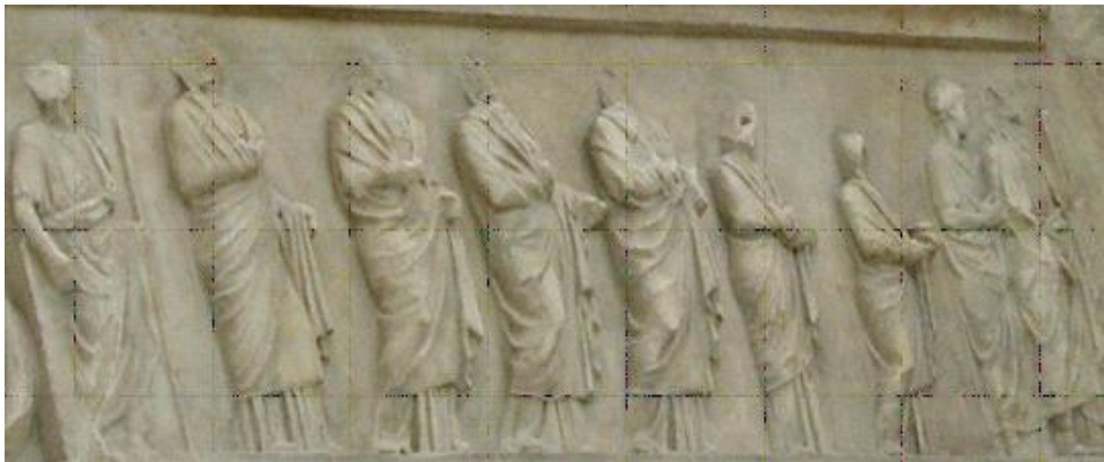
Slika 7. Procesija Vestalki, mramor

Vatra se upotrebljavala i u slavlju blagdana koji se nazivao Listopadski konj , a koji je označavao žrtvovanje životinja. Taj ritual održavao se 15. listopada u čast bogu Marsu, a išao je i zajedno sa završetkom agrikulturne i vojne sezone. Tada bi se, nakon utrka kola, žrtvovao desni konj pobjedničke zaprege. Njegov rep bi se odrezao i objesio, a krv bi kapala po žrtveniku. 48