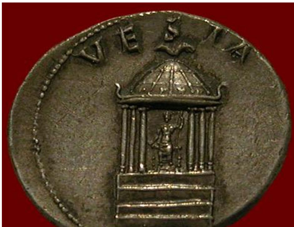
Slika 10. Novčić s prikazom hrama Veste iz doba cara Nerona (54.- 68. g. po. Kr.)

Rimsko je pravo malo služilo ženama, ali je ipak mater familia bila voljena i poštovana od strane svoga muža i potomaka. Obitelj je bila snažna zajednica i trajna snaga Rima, a žena je bila njen stup. Pravno gledano, njihova prava bila su svedena na samo određena prava, a djevojke i žene su uvijek bile pod utjecajem oca ili muža. Ipak, njihov život bio je liberalniji, tolerantniji i slobodniji do prodora kršćanstva. 96