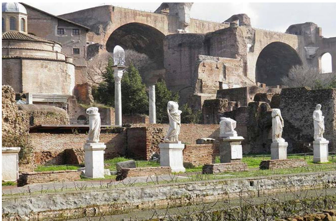
Slika 3. Kipovi Vestalki

Ovi kipovi ( Sl. 3 ) predstavljaju Vestalke koje su se posebno istakle i koje su u svoje vrijeme bile glavne, vrhovne Vestalke, tzv. virgines Vestales maximae