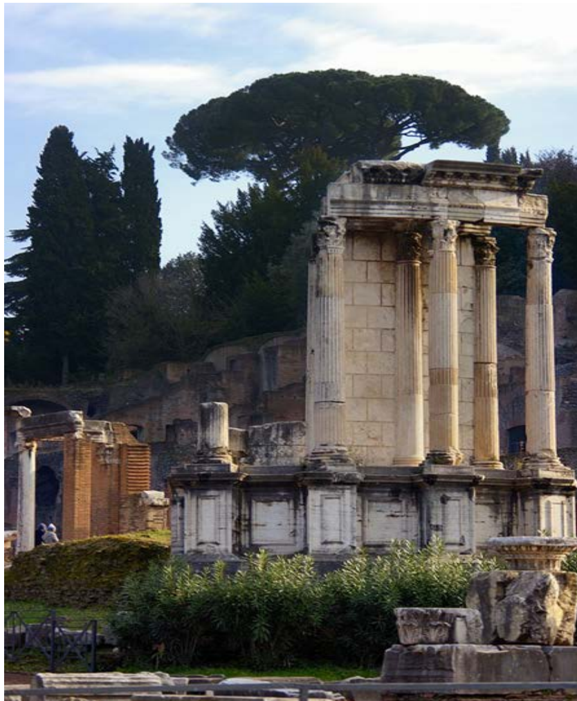
Slika 1. Ostaci hrama Vesta na Forumu Romanu

Na Forum Romanum i danas stoje njihovi ostaci poput Vestinog kružnog hrama zajedno s ognjištem gdje je gorila Vestina vatra (Sl. 1).