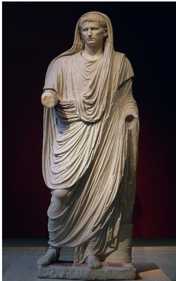
Slika 9. Car August kao vrhovni svećenik

Po prvi puta je rimska religija imala na čelu jednu glavnu osobu, jer je August bio vrhovni svećenik ( Pontifex Maximus ) na vrhu svih religijskih institucija, a ne samo jedne, što je dotad bio običaj (Sl. 9). On je povećao broj povlastica nekim svećenstvima te je nagrađivao mnoge osobe iz Senata svećeničkim mjestima. August je 29. g. pr. Kr. mogao odabrati čak i veći broj svećenika od uobičajenog broja. 71 Postojalo je pravilo, posebice u prva dva stoljeća Carstva, da senator ne može biti član u više svećeničkih redova već u samo jednom. Neki su senatori vidjeli ovu poziciju kao moćniju i snažniju te su pretendirali za članstvo i viši položaj u religijskim institucijama. 72 Na sljedećoj slici se nalazi kip Augusta kao Pontifex Maximus .