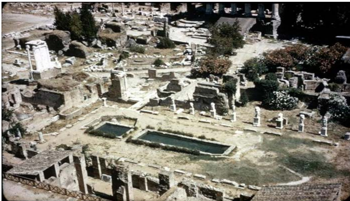
Slika 2. Arheološki ostaci Vestinog hrama i obitavališta

Na slici 2. vidi se panoramski snimak arheoloških ostataka Vestinog obitavališta i hrama, te kipovi Vestalki, koje se nalaze u dvorištu toga obitavališta.