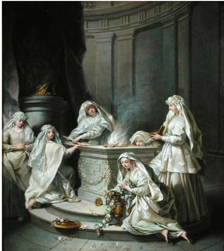
Slika 5. Idejna rekonstrukcija Vestalki u ritualu s vatrom

Jedna od dužnosti Vestalki bilo je „pročišćenje“ koju su izvodile s vatrom božice Veste i upotrebom vode (Sl. 5). Rimljani su prepoznavali dvije vrste vatre: jedna je bila simultano muška i plodna povezana s Vulkanom, bogom vatre, a druga je bila ženska i sterilna i povezana s Vestom. 33 Ovidije navodi: „Nemojte shvaćati Vestu kao ništa drugo nego živu vatru. Vidite kako nijedno tijelo nije bilo rođeno iz vatre. To znači da je djevica svojom voljom i da ne traži nikakva sjemena niti ih prima, te uživa u svojoj nevinosti.“ (Ov. Fast. 6. 291– 294) Dionizije od Halikarnasa piše kako su neki govorili da je razlogom čuvanje vatre povjereno djevicama radije nego muškarcima, jer je vatra nepokvarena, a djevica je neokaljana. Navodi i kako ono što je najčednije od smrtnih stvari mora biti u suglasju s najneokaljanijim od onog koje je božansko. 34