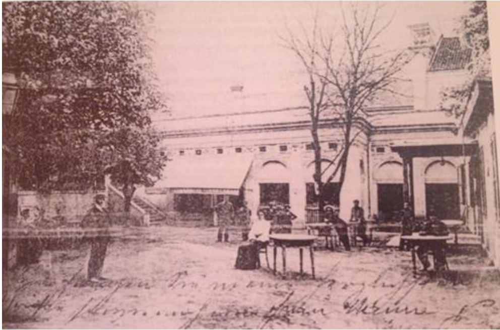
Prilog 3.5.1, Stari, drveni Teatro Fenice, početkom 20. stoljeća, izvor: Radmila Matejčić, Kako čitati grad , Rijeka, 2013.