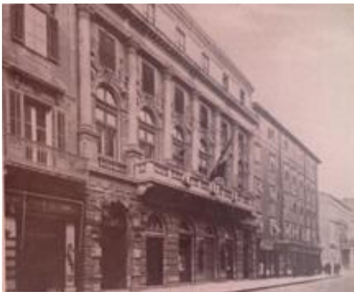
Prilog 3.4.1, Zgrada Filodrammatice uklopljena u niz fasada na Korzu