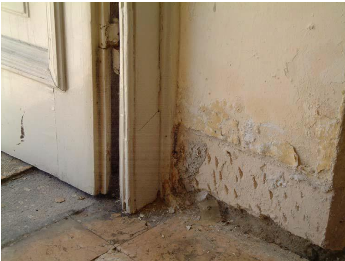
Prilog 4.1.1, Zatečena stanja kapilarne vlage, izvor: HNK Ivana pl. Zajca u Rijeci, Projekt sustava zaštite od kapilarne vlage; Izvedbeni projekt – tehnički opis, Zagreb, veljača 2014.