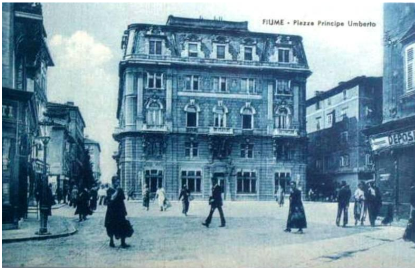
Prilog 3.3.2, Pročelje Palače Modello