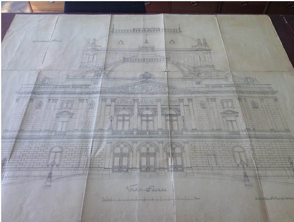
Prilog 3.2.1, Nacrt pročelja zgrade kazališta, izvor: DAR, JU – 51, 104