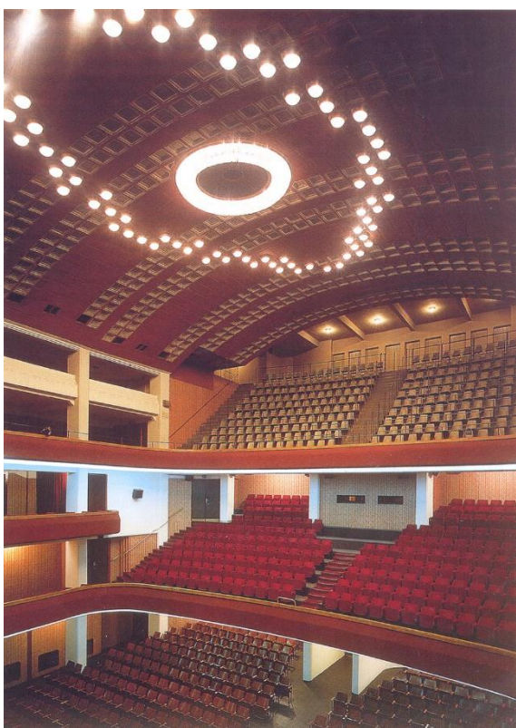
Prilog 3.5.4, Dvorana Teatra Fenice, izvor: http://paudio.hr/portfolio/teatro-fenice-rijeka/