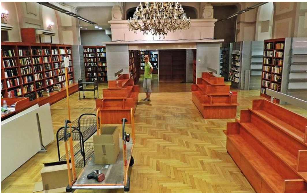
Prilog 4.2.1, Interijer novog prostora Gradske knjižnice u zgradi Filodrammatice