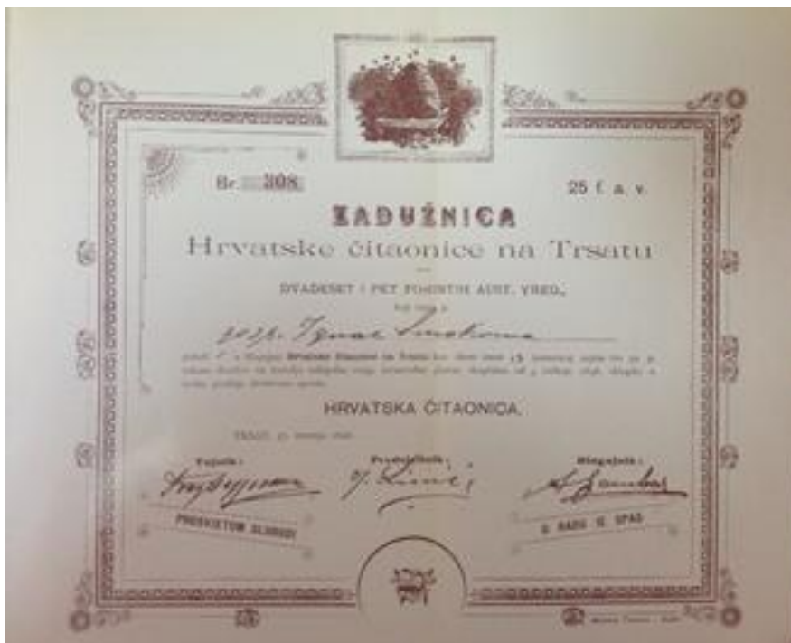
Prilog 3.6.1, Zadužnica Hrvatske čitaonice na Trsatu, izvor: VINKO ANTIĆ, Trsat od davnih do današnjih dana , Rijeka 1982.