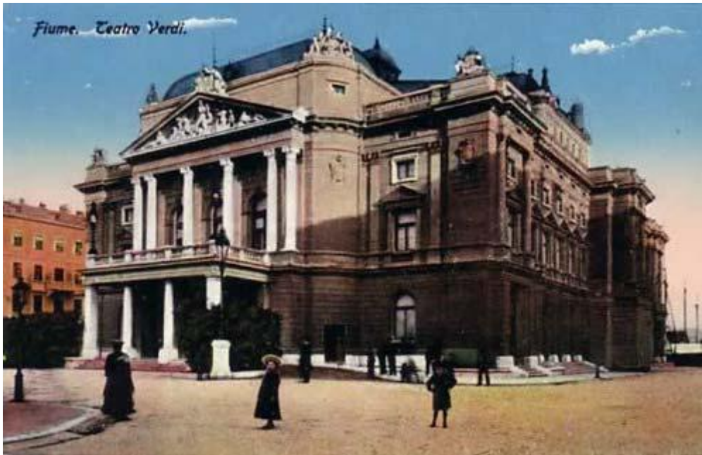
Prilog 3.2.5, Pročelje riječkog kazališta u obliku hrama, izvor: http://rijecani.com/portal/stare-slike-rijeke/