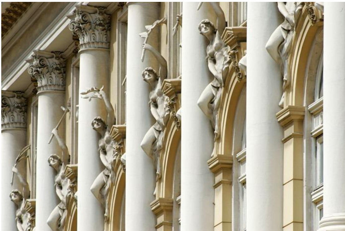
Prilog 3.4.3, Detalj pročelja, izvor: http://www.rijeka.hr/Default.aspx?art=7894

http://www.kvarner.hr/turizam/sto_raditi/Poslovni_turizam/Kongresi_i_skupovi/Rijeka