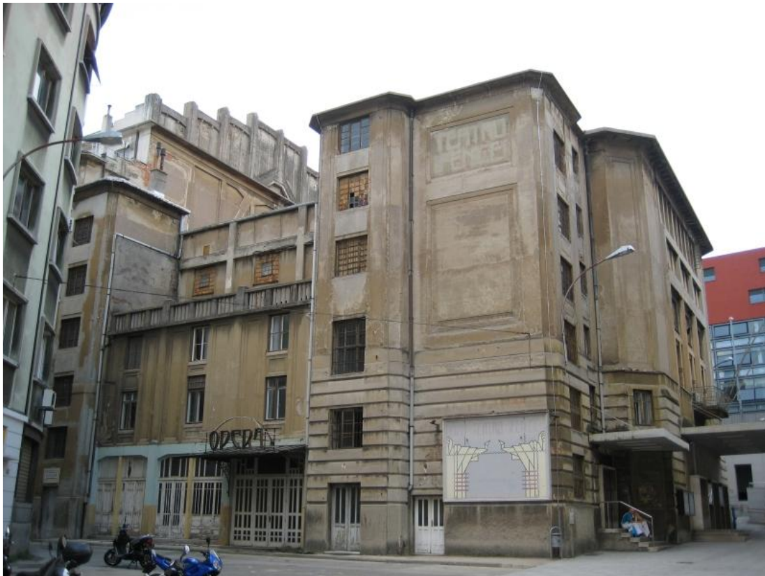
Prilog 4.4.1, Današnji izgled zgrade Teatra Fenice, izvor: http://virtualna.nsk.hr/1914/26-travnja-1914/