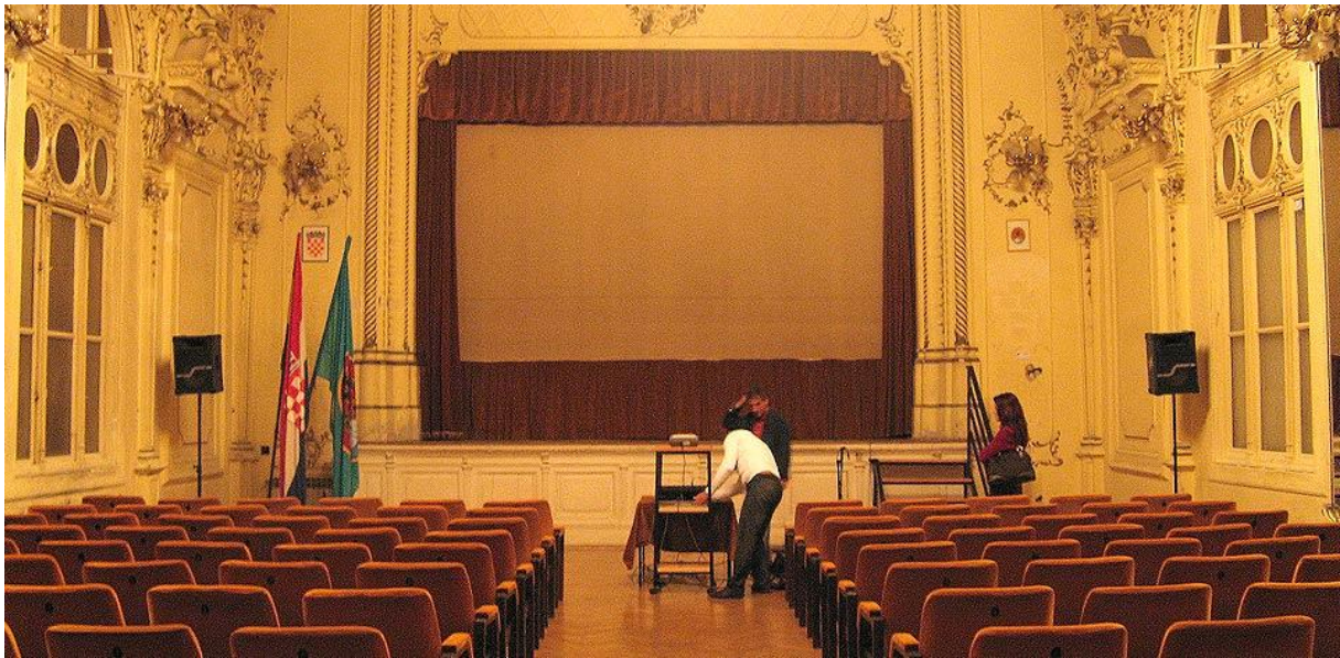
Prilog 3.4.2, Dvorana Filodrammatice, izvor:

http://www.kvarner.hr/turizam/sto_raditi/Poslovni_turizam/Kongresi_i_skupovi/Rijeka