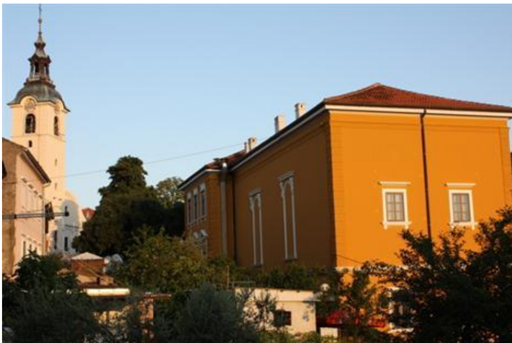
Prilog 4.5.1, Izgled Čitaonice danas, izvor: http://www.rijeka.hr/Default.aspx?gpic=12&g=84