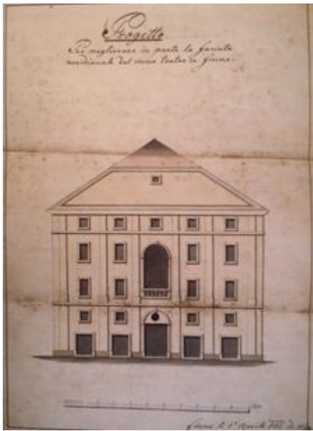
Prilog 3.1.1, Projekt za Adamićevo kazalište, izvor: Radmila Matejčić, Kako čitati grad , Rijeka, 2013.