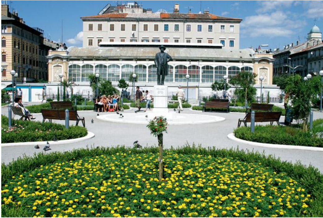
Prilog 4.1.2, Kazališni park, izvor: http://www.rijeka.hr/UredjenjeKazalisnogParka