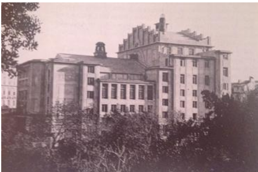
Prilog 3.5.3, Armirano-betonski Teatro Fenice