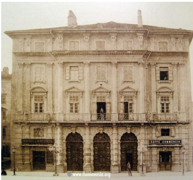
Prilog 3.1.2, Fasada Adamićevog kazališta neposredno prije rušenja