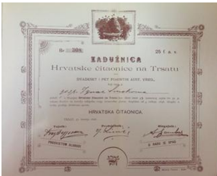
Prilog 3.6.1, Zadužnica Hrvatske čitaonice na Trsatu, izvor: VINKO ANTIĆ, Trsat od davnih do današnjih dana , Rijeka 1982.