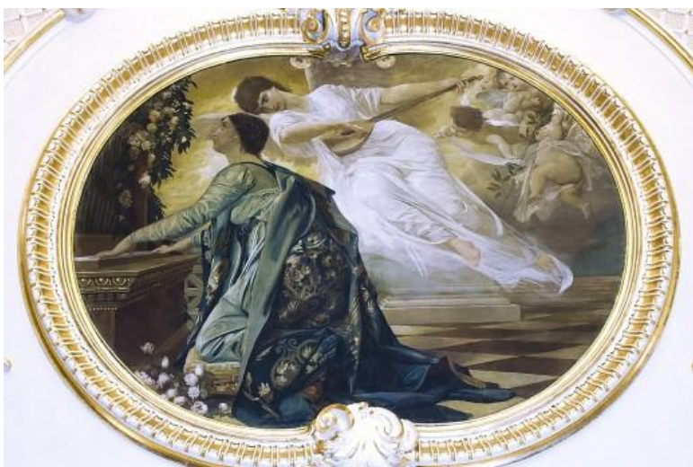
Prilog 3.2.2, Strop riječkog kazališta, Gustav Klimt, Religiozna glazba , izvor: http://www.novolist.hr/Kultura/Ostalo/Gustav-Klimt-oslikao-strop-i-rijeckog-kazalista