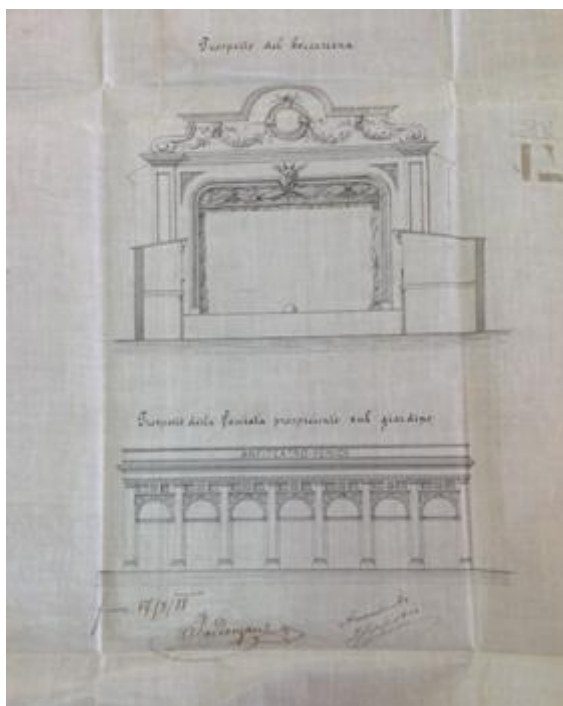
Prilog 3.5.2, Projekt kazališta, Nikola Predoznany, 1888., izvor: DAR, JU – 51, 127