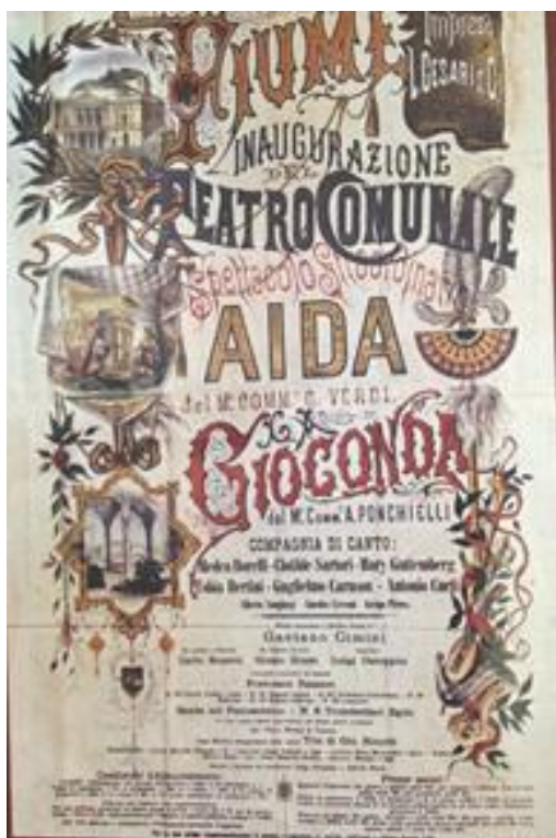
Prilog 3.2.3, Plakat prve predstave održane 1885., izvor: Narodno kazalište Ivan Zajc , RADMILA MATEJČIĆ, Povijest gradnje Općinskog kazališta u Rijeci , Rijeka, 1981.