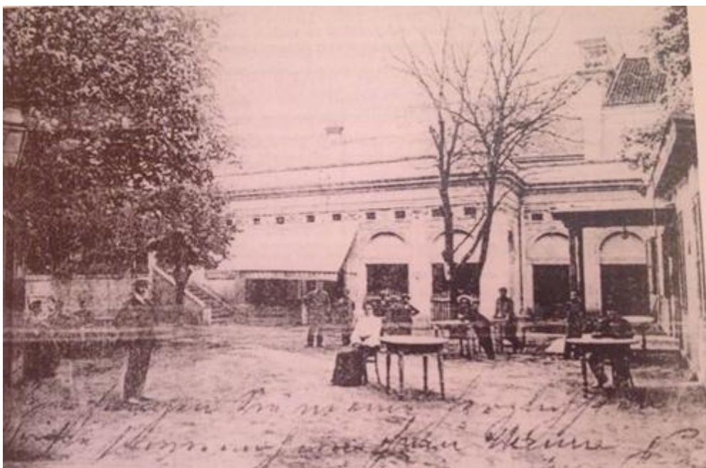
Prilog 3.5.1, Stari, drveni Teatro Fenice, početkom 20. stoljeća, izvor: Radmila Matejčić, Kako čitati grad , Rijeka, 2013.