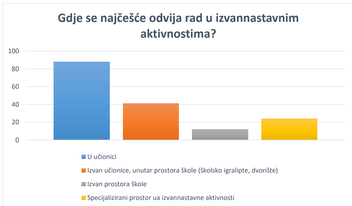
Graf 6. Prostor na kojem se odvija rad u izvannastavnim aktivnostima

Rad u izvannastavnim aktivnostima prema odgovorima učenika najčešće se odvija u učionici (f=88, p=53,3%), zatim izvan učionice unutar prostora škole, kao npr. na školskom igralištu, dvorištu (f=41, p=24,8%). U specijaliziranim prostorima za izvannastavne aktivnosti tek 14,5% ispitanika da se odvija rad izvannastavnih aktivnosti (f=24, p=14,5%), dok najmanji postotak učenika, njih 7,3% navodi kako se rad odvija izvan prostora škole (f=12, p=7,3%). Navedenim rezultatima prihvaćamo hipotezu H9 Rad u izvannastavnim aktivnostima se najviše odvija u učionici. (Graf 6.)