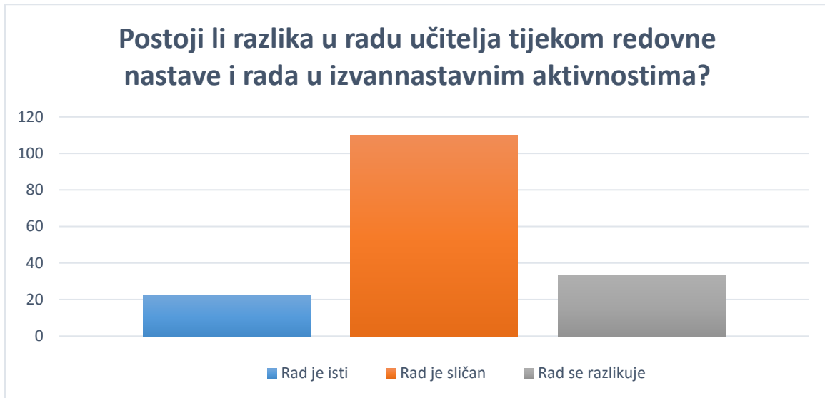
Graf 4. Postojanje razlika u radu učitelja tijekom redovne nastave i rada u izvannastavnim aktivnostima.