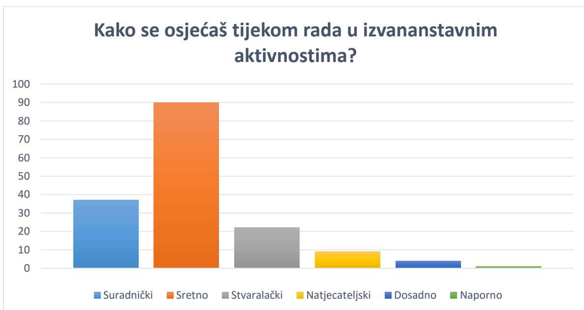
Graf 5. Osjećaji učenika tijekom rada u izvannastavnim aktivnostima

Učenici se tijekom rada u izvannastavnim aktivnostima najviše osjećaju sretno ( f=90 , p=54,5\% ), zatim suradnički ( f=37 , p=22,4\% ) i stvaralački ( f=22 , p=13,3\% ). Navedeni rezultati potvrđuju hipotezu H8 Učenici se tijekom rada u izvannastavnim aktivnostima ponajviše osjećaju sretno. (Graf 5.)