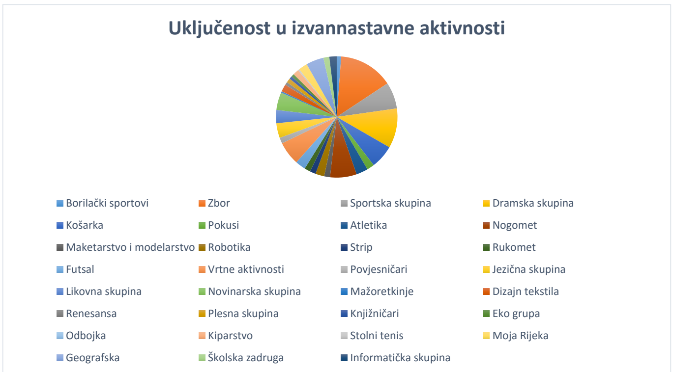
Graf 2. Vrste izvannastavne aktivnosti u koje su uključeni učenici

Sljedeća izvannastavna aktivnost na koju se učenici najviše uključuju je zbor, uključeno je 35 ispitanih učenika (f=35).