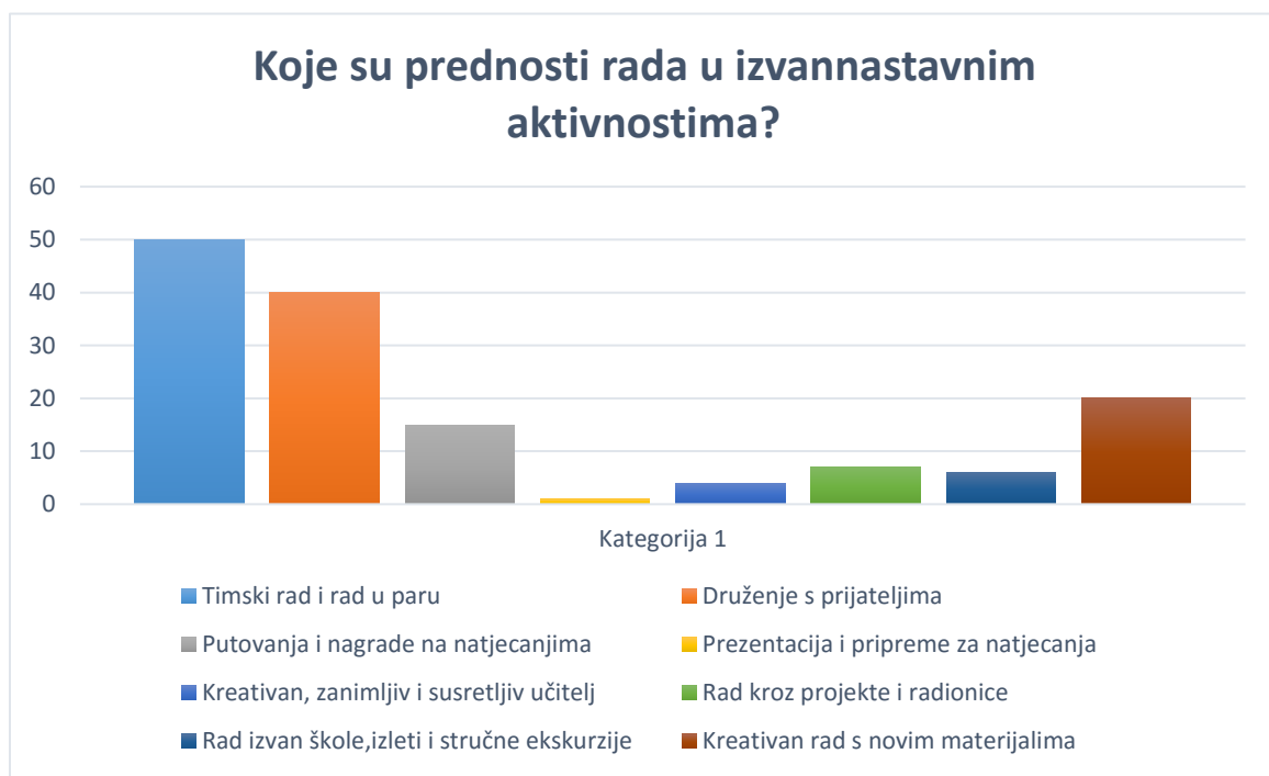
Graf 3. Prednosti rada u izvannastavnim aktivnostima

Prednostima rada u izvannastavnim aktivnostima najveći postotak ispitanika navodi: timski rad i rad u paru ( f=50 , p=31,1\% ) i druženje s prijateljima ( f=48 , p=29,8\% ). Sudjelovanjem u izvannastavnim aktivnostima učenici grade nove ili mijenjaju stare stavove, stvaraju pozitivne emocije i osjećaj pripadnosti, uče se liderskim govorničkim vještinama, kritičkom mišljenju, toleranciji i timskome radu (Mlinarević, Brust Nemet, 2012). Potvrđujemo hipotezu H3 Najviše učenika procjenjuje da je prednost rada u izvannastavnim aktivnostima druženje s prijateljima , što odražava važnost kvalitetnih međuljudskih odnosa u stvaranju selfa učenika.