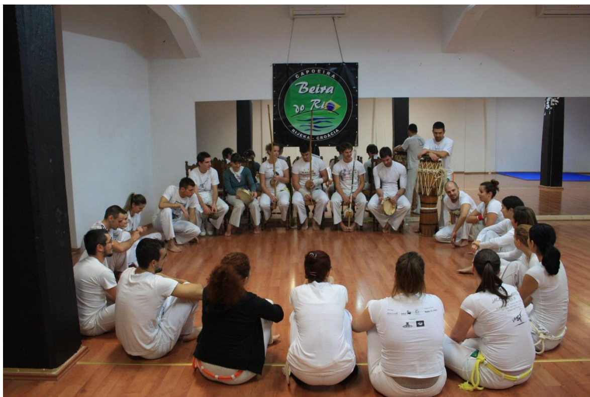
Slika 1. Roda