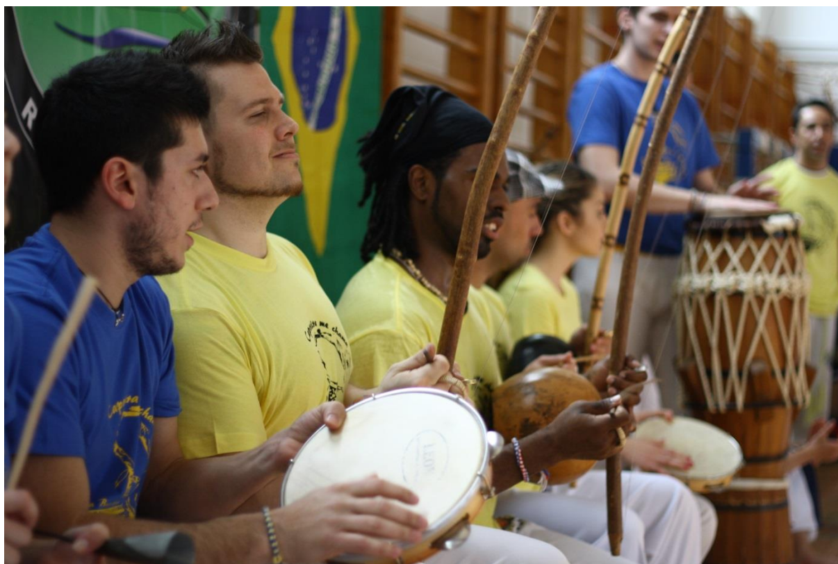
Slika 2. Bateria (glazbeni sastav)