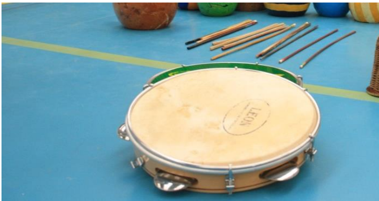
Slika 6. Pandeiro