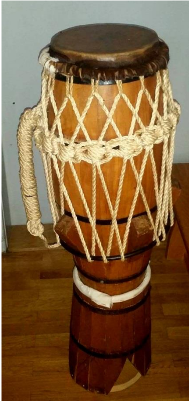
Slika 5. Atabaque