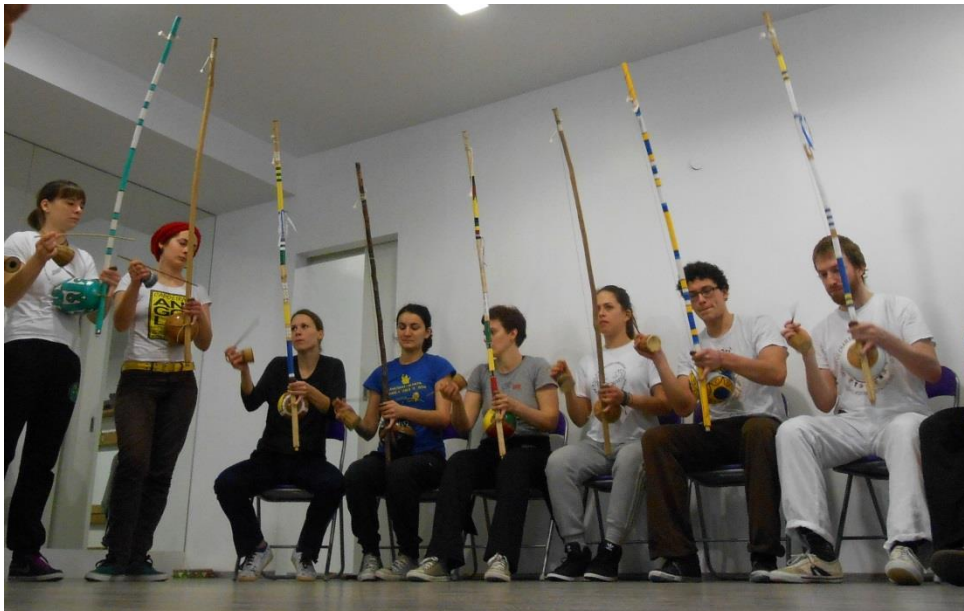
Slika 3 i 4. Berimbau