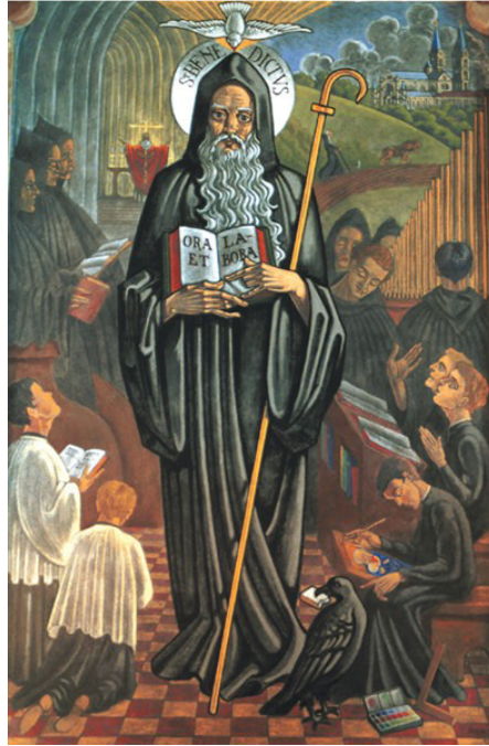
Slika br. 14: sv. Benedikt iz Nursije 75

Ipak, za utemeljenje zapadne samostanske kulture najzaslužniji je Flavije Magnus Aurelije Kasiodor Senator, poznatiji kao Kasiodor (Skilacej danas Squillace u Kalabriji, oko 490 – samostan Vivarij, pokraj Skilaceja, oko 583). Najzaslužniji je na polju ponovnog povezivanja s antičkom kulturnom baštinom pri čemu je i iskoristio svoj društveni položaj pripadnika ugledne rimske obitelji i ministra gotskog kralja Teodorika u Ravenni. Najprije je u Rimu pokušao osnovati neku vrstu akademije po uzoru na aleksandrijski Muzej gdje bi se okupili učeni ljudi i razvijali znanost i umjetnost. U tome ga je spriječio upad Bizantinca Belizara u Rim, a svoj naum je ostvario osnivanjem samostana Vivarija na svom imanju u Kalabriji. Naravno, opet je Aleksandrija poslužila kao uzor, a ključnu ulogu je trebala imati knjižnica. Za razliku od brojnih drugih kršćana, Kasiodor se od početka zauzimao ne samo za prepisivanje i očuvanje antičke kulturne baštine, nego i za njihovo proučavanje. U zborniku svojih spisa pod nazivom Variae tako navodi: Propositi quidem nostri est nova construere