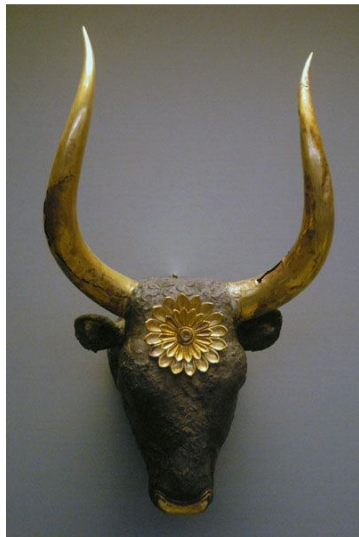
Slika br. 5: srebrna glava bika sa zlatnim rogovima, 1600. pr. Krista. Nacionalni arheološki muzej, Atena. 41

Kod nekih je hebrejskih slova prilagodbom u grčkom pismu došlo do doslovnog preokreta. Slovo koje je predstavljeno glavom bika u kretska – sinajskom pismu (trokutasta glava s dva roga), Grci su počeli pisati naopako , pa je tako nastalo i slovo A (glava bika postavljena naglavce). Rijetko kada razmišljamo o tome da je u običnom slovu abecede zapisana priča o stvaranju stara preko tri tisuće godina.