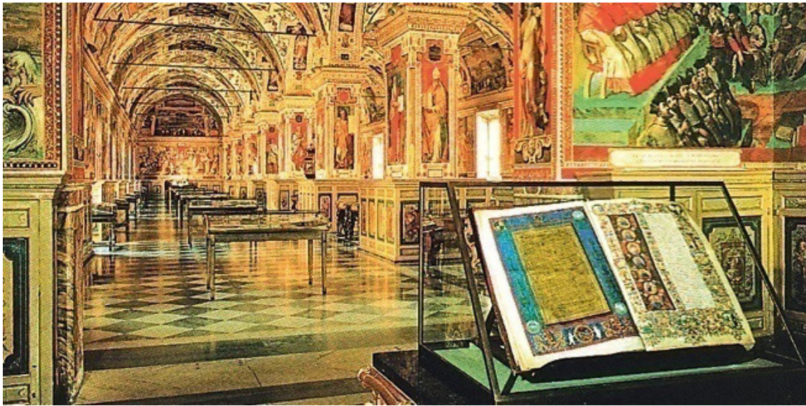
Slika br. 17: Vatikanska knjižnica (Bibliotheca Apostolica Vaticana) 81

Djelo Nikole V nastavio je Siksto IV (1471-1484) koji je odabrao izvrsnog knjižničara humanista Platinu. Za njihovog vremena broj svezaka se povećao na više od 3500, a bile su izgrađene i posebne prostorije koje su ukrasili tadašnji vodeći umjetnici. Prostorije su se dijelile na javnu knjižnicu koja je imala latinski i grčki odjel i tajnu knjižnicu za čuvanje rijetkosti. 82