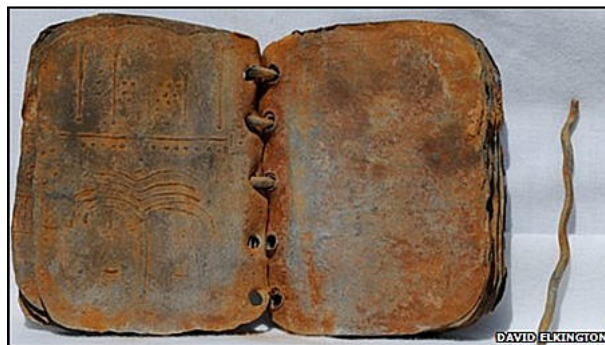
Slika br. 9: Jordanski olovni kodeks (veličine kreditne kartice) 57

Iznimno rijetko su se za pisaći materijal u antici koristili tanki listovi od zlata i srebra. Od drugih se metala češće upotrebljavalo olovo i to već u 5. st. pr. Krista zbog pogodnog karaktera- mekano je pa su se u njega lako urezivala slova i savitljivo što je po potrebi omogućavalo svijanje u svitak. Iako je bio podoban kao materijal, to nije bio primarni razlog njegove šire upotrebe. Naime, Grci, Etruščani i Rimljani su na olovne pločice zapisivali razne magijske formule zbog vjerovanja u magijska svojstva olova. Mnoge od njih sačuvala su se uz posmrtnu ostatku budući da su čarobne formule pokojnike štatile od zlih duhova. 56