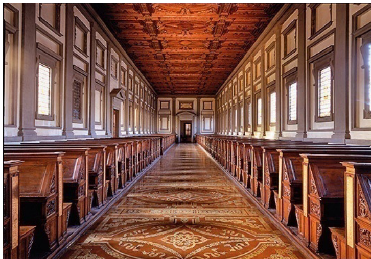
Slika br. 16: Lorenziana 79

samostanu pri medicejskoj bazilici sv. Lovre prema projektu Michelangela Buonarrotija, a pod pokroviteljstvom pape Klementa VII, također iz porodice Medici. U njoj je pohranjeno preko 11 000 drevnih rukopisa i 4 500 ranih tiskanih knjiga.