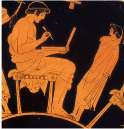
Slika br. 7: Pisanje na voštanoj pločici, slikar Douris oko 500. god. pr. Krista. (Berlin) 54

što doslovno znači okrenuti stilus odnosno brisati, a u prenesenom značenju ispravljati tekst.