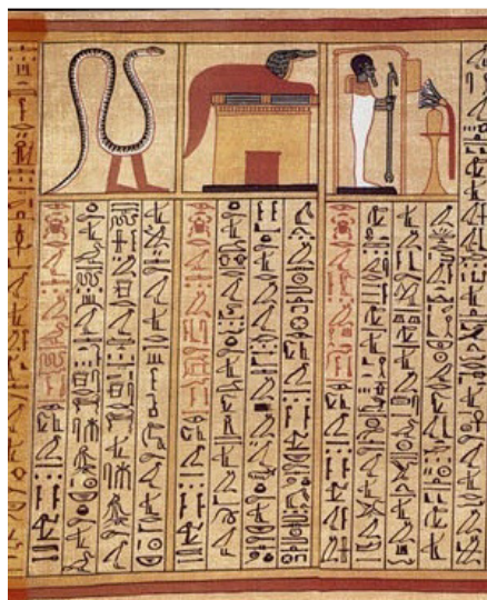
Slika br. 4: Anijev odlomak iz Knjige mrtvih pokazuje kako se duša pokojnika može regenerirati u životinju ili čak božanstvo Ptaha 22