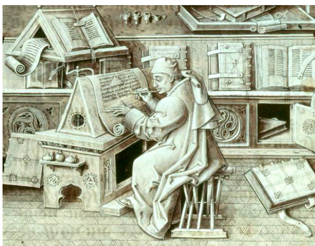
Slika br. 11: skriptorij 69

Kada bi pisari završili svoj dio posla, rukopise su preuzimali minijaturisti koji su crvenom tintom izrađivali inicijale i uređivali naslove, podnaslove i slično, po završetku su se knjige uvezivale. Tako su nam u nasljeđe ostavljena jedinstvena umjetnička djela.