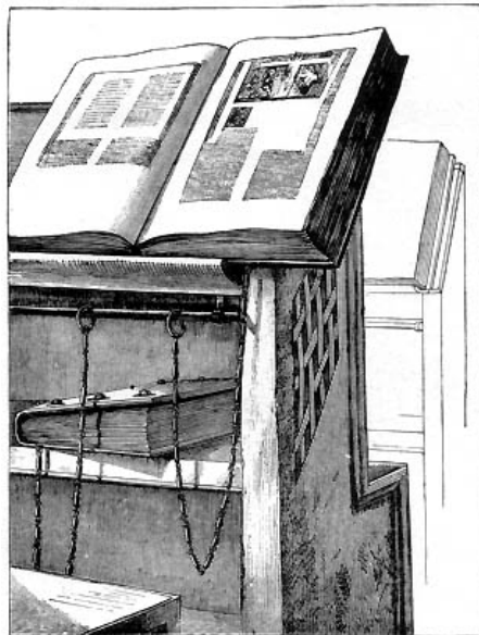
Slika br. 13 73

Kako su knjige u to doba bile vrlo cijenjena i skupa imovina, postojao je i sigurnosni sustav koji ih je štutio od potencijalnih kradljivaca. Tako su se u 14. stoljeću s pojavom prvih javnih knjižnica pojavile i knjige okovane lancima (lat. libri catenati). Knjige su bile privezane lancima za klupe i police. Lanac je najčešće prolazio kroz alke na rubovima korica kako bi se spriječilo oštećivanje hrpta. Zbog takvog su položaja lanaca knjige stajale hrptom okrenutim od korisnika.