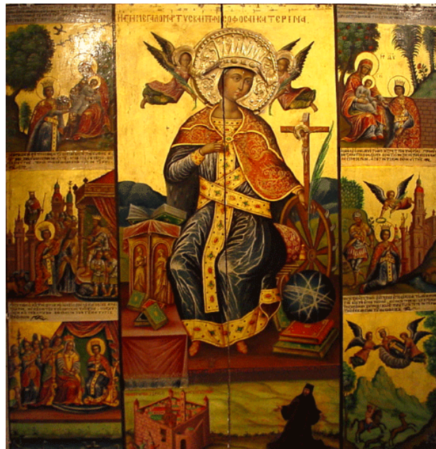
Slika br. 10: Sveta Katarina, ikona iz istoimenog samostana na Sinaju kojeg je podigao car Justinijan (527- 565). Prikazuje se s kotačem kojim je mučenički usmrćena. 65

U slikarstvu su te asocijativne elemente predstavljali npr. predmeti koji su se slikali uz pojedine svece. Uglavnom su to bili predmeti ili oruđa kojima su mučenici bili ubijeni i po kojima ih i danas prepoznajemo. To su tzv. slikovni atributi čija je funkcija upravo prepoznavanje likova na slikama, reljefima ili skulpturama.