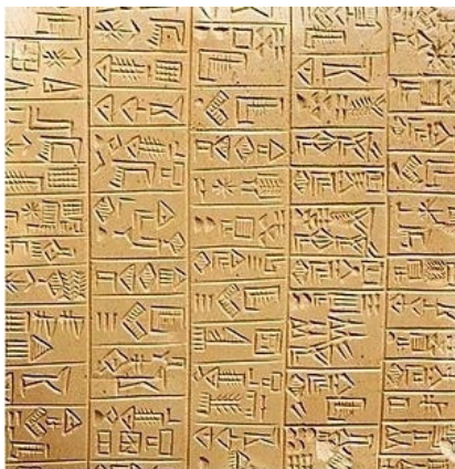
Slika br.1: Sumerski natpis u arhaičnom monumentalnom stilu oko 26. st. pr. Krista 8

Stare civilizacije Mezopotamije bile su smještene na području današnjeg Iraka. Najpoznatija sumerska kultura odgovarala je području sjeverne Mezopotamije i podrazumijevala je mješovitu lingvističku i etničku skupinu. Sumerani su bili iznimno kreativna kultura koja je nastala pod utjecajem nepredvidljivih čudi velikih rijeka Eufrata i Tigrisa izgrađivši poznate gradove Uruk, Eridu, Kiš, Lagaš, Agad, Akaš i poznati Ur, mjesto Abrahamovog rođenja. Tako su mnogi sumersku ostavštinu kao što je zakonodavni sustav, kotač, pismo, astronomiju i književnost smatrali zalogom velikih rijeka. Izloženost na milost i nemilost rijekama objašnjava i religijsku orijentaciju izrazito panteističkog tipa koja uključuje božanstva kao personificirane sile prirode. Kako je s tim silama bilo potrebno razgovarati, s nadom u njihovu blagonaklonost, razvio se elitni svećenički sloj. Svećenstvo je diktiralo prvenstveno gospodarskim resursima kao što je agrikultura, a posredno svim ostalim granama kao što je trgovina i ratovanje, budući da je sve što postoji, osobito kada se radi o teritorijalnom bogatstvu, pripadalo bogovima. Tako se od početka uporabe u 4. tisućljeću pr. Krista do prijelaza iz 3. u 2. tisućljeće pismom pretežno služi svećenstvo i administrativni sloj pri vođenju državnih