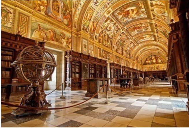
Slika br. 12: Knjižnica samostana u El Escorialu 72

Kako su knjige u to doba bile vrlo cijenjena i skupa imovina, postojao je i sigurnosni sustav koji ih je štutio od potencijalnih kradljivaca. Tako su se u 14. stoljeću s pojavom prvih javnih knjižnica pojavile i knjige okovane lancima (lat. libri catenati). Knjige su bile privezane lancima za klupe i police. Lanac je najčešće prolazio kroz alke na rubovima korica kako bi se spriječilo oštećivanje hrpta. Zbog takvog su položaja lanaca knjige stajale hrptom okrenutim od korisnika.