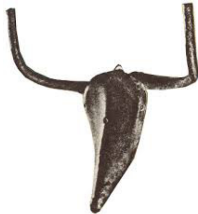
Slika br. 6: Pablo Picasso. Glava bika, 1943. Dijelovi bicikla, bronca. Galerija Louise Leris, Pariz. 42