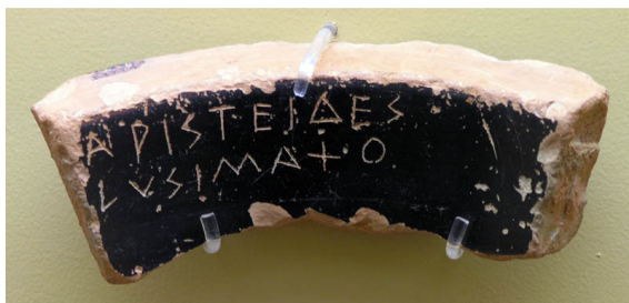
Slika br. 8: Ostrakon s Aristidovim imenom, 483- 482. god. pr. Krista, Muzej antičke Agore u Ateni.

Za pravljenje kraćih bilježaka Grci su upotrebljavali ostatke od rabljenih glinenih posuda koje su nazivali ostrakon. Na njima se obično pisalo na unutrašnjoj, konkavnoj strani. Budući da se mogao naći u svakoj kući, bio je to pisaći materijal siromašnog sloja. Atenjani su na tim keramičkim otpacima zapisivali i imena ljudi koji su bili osuđeni na progonstvo, a od tuda dolazi i izraz ostrakizam za odluke o protjerivanju. 55