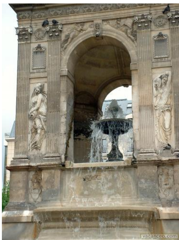
Slika 5. Jean Goujon, Fontana nevinih , 1547. godina