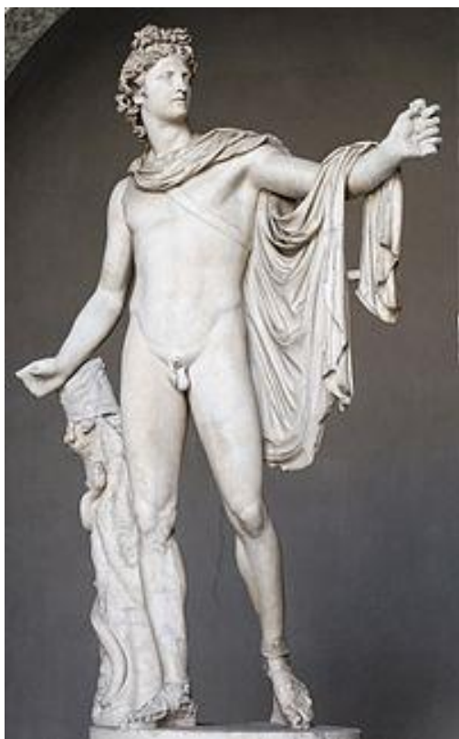
Slika 2. Apolon Belvederski , rimska mramorna

Ova skulptura se prvotno nalazila unutar arhitektonske niše u Versaillesu, da bi zatim krajem 18. stoljeća pod utjecajem novih hortikulturnih tendencija iz Engleske bila preseljena na u umjetnu špilju u parku. 50 Likovi su monumentalni i herojski, a klesanje je profinjeno i s mnoštvom detalja koji se najbolje mogu zamijetiti u dekoraciji vaza. 51 Klečeća figura s draperijom u ruci, nimfa Mélicerte , mogla bi se izdvojiti kao najbolje isklesan lik među nimfama, što je naročito vidljivo u oblikovanju draperije i kose. 52 Klasičan stil kojim je izrađena ova skupina može se povezati s Fidijom. 53 Glavni problem s kojim se Girardon susreo prilikom izrade ove skulpture bilo je kako uklopiti individualne figure u jednu koherentnu grupu. 54