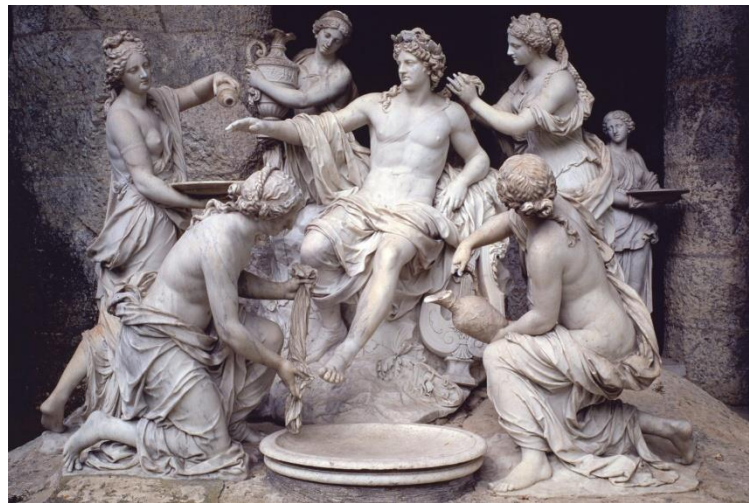
Slika 1. François Girardon, Apolona dvore nimfe , Versailles, 1666.-1675. godina

Girardonovi prvi radovi pokazuju da je bio pod utjecajem stila Jacquesa Sarazina (1588.-1660.). 45 Njegov uzlet započinje kada izrađuje svoje najmonumentalnije djelo; skulpturu Apolona dvore nimfe (slika 1) dominantni simbol vrta i skulpture u Versaillesu za koju je dobio narudžbu 1666. godine. 46 Grupa se sastoji od sedam slobodnostojećih skulptura koje predstavljaju Apolona i nimfe u Tetidinoj špilji, gdje Apolon odlazi nakon dnevnog puta u kočiji. 47 Model za Apolona bio je klasični Apolon Belvederski (slika 2) koji se nalazi u Vatikanskom muzeju. 48 Skulptura za cilj ima utjeloviti simboličnu referencu na kralja Luja XIV., koji kao i bog Apolon, neumornim posluživanjem svojih ljudi izaziva poštovanje. 49