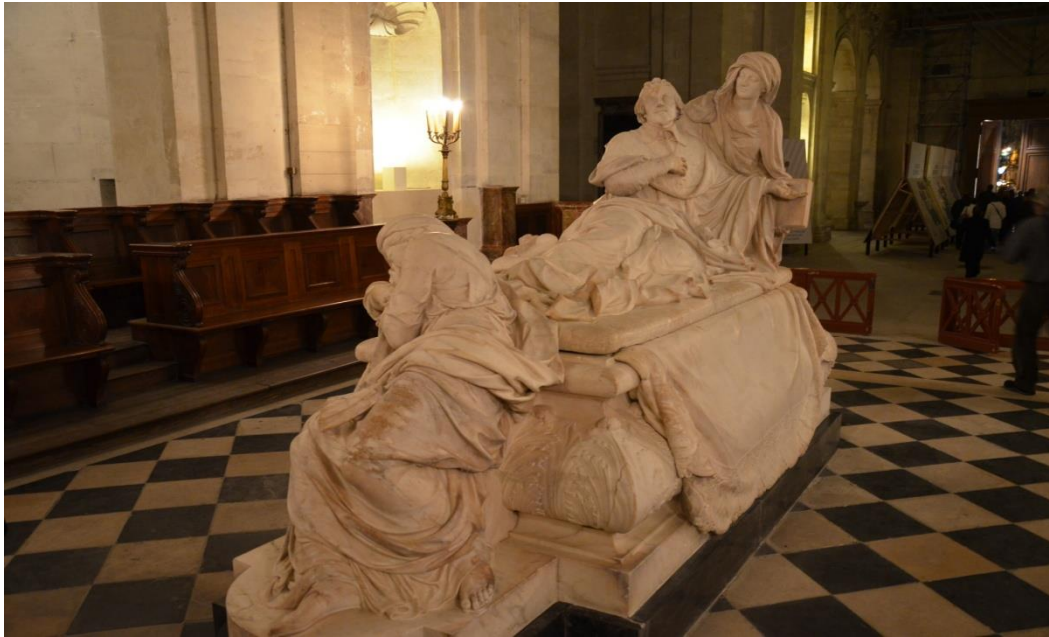
Slika 8. Francois Girardon, grobnica kardinala Richelieua , Sorbonne, Pariz, 17. stoljeće

Važno Girardonovo djelo je grobnica kardinala Richelieua (slika 8), izvedena između 1675. i 1694. godine, koja je originalno bila smještena na centralnoj osi crkve Sorbonne u Parizu. 62 Uz prelata se nalaze ženske figure; alegorije religije i znanosti ( religio i scientia ). Kardinal je prikazan dostojanstveno te s naturalističkim elementima. 63 Girardonova skulptura promicala je stil klasične grobne umjetnosti u kojem se pokojnik, predstavljen u aktivnoj gesti na svojoj smrtnoj postelji, nalazi između sfere života i smrti. 64