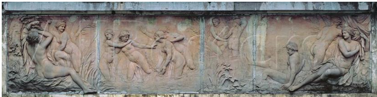
Slika 4. Francois Girardon, Kupanje nimfi , 1668.-1670. godina

Girardonove druge skulpture za vrt Versaillesa, koje odskoču zbog svoje izvrsnosti, su reljef Kupanje nimfi (slika 4) i skulptura Otmica Perzefone . 55 Reljef Kupanje nimfi Girardon je izradio između 1668. i 1670. godine. Zbog svoje uravnotežene kompozicije i klesanja predstavlja njegovo najbolje reljefno djelo. 56 Mogući uzor za izradu ovog reljefa bili su oni na Fontani nevinih (slika 5) Jeana Goujona (1510.-1568.). 57