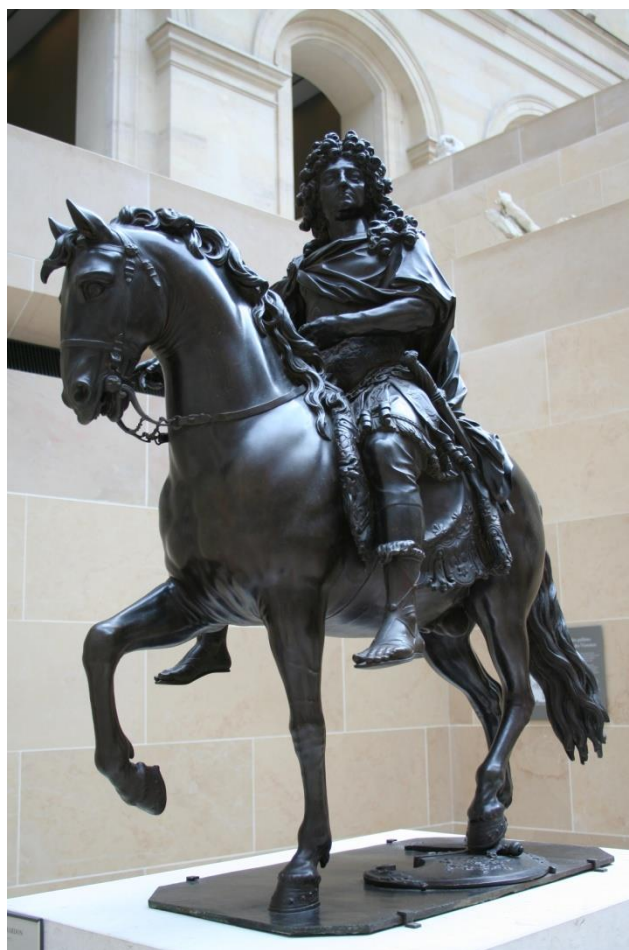
Slika 7. Konjanička skulptura Luja XIV, Louvre, 1692. godina

Kako je Luj XIV. bio veliki ljubitelj antike, skulptura je nastala prema modelu konjaničke skulpture cara Marka Aurelija na rimskom Campidogliu , a zajednička im je i propagandna ideja veličanja mudrog vladara. Rad na skulpturi je započeo 1687. godine, te je ona postavljena na trg 1699. godine. 67 Da ova skulptura potvrđuje izvrsnost kipara najbolje je vidljivo u detaljnoj izradi uzoraka ljiljana na tkanini ispod sedla i kod oblikovanja repa konja, koji je izveden u čvoru. 68