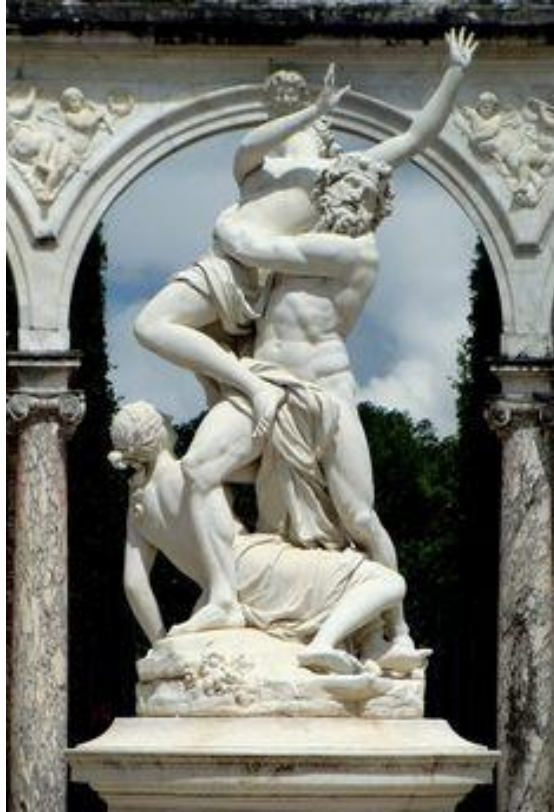
Slika 6. Francois Girardon, Otmica Perzefone, Versailles, 1677.-1699. godina

Otmica Perzefone (slika 6) jedna je od četiri prikaza otmica koje su bile namijenjene za skulpturalni program u Parterred'Eau u Versaillesu. Svaka otmica simbolizira jedan od četiriju elemenata, a Girardonova simbolizira element vatre. Taj je program vezan uz kozmološku shemu koja asocira na Luja XIV. kao Kralja Sunca. 58