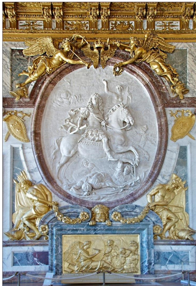
Slika 8. Antoine Coysevox, Pobjeda Luja XIV., Versailles, 1678.-1686. godina

Antoine Coysevox rođen je 1640. godine u Lyonu. 69 Dolazi u Pariz 1657. godine, da bi 1666. godine, navršivši dvadeset i šest godina, postao dvorskim kiparom, a 1678. godine učitelj na akademiji. 70 Godine 1702. izabran je za direktora Akademije, čime je postao najuspješniji kipar Luja XIV. Njegov monumentalni plastični reljef Pobjeda Luja XIV. (slika 8) nalazi se među njegovim najznačajnijim djelima, a izveden je kao dio zidne dekoracije Salona de Guerre u Versaillesu.