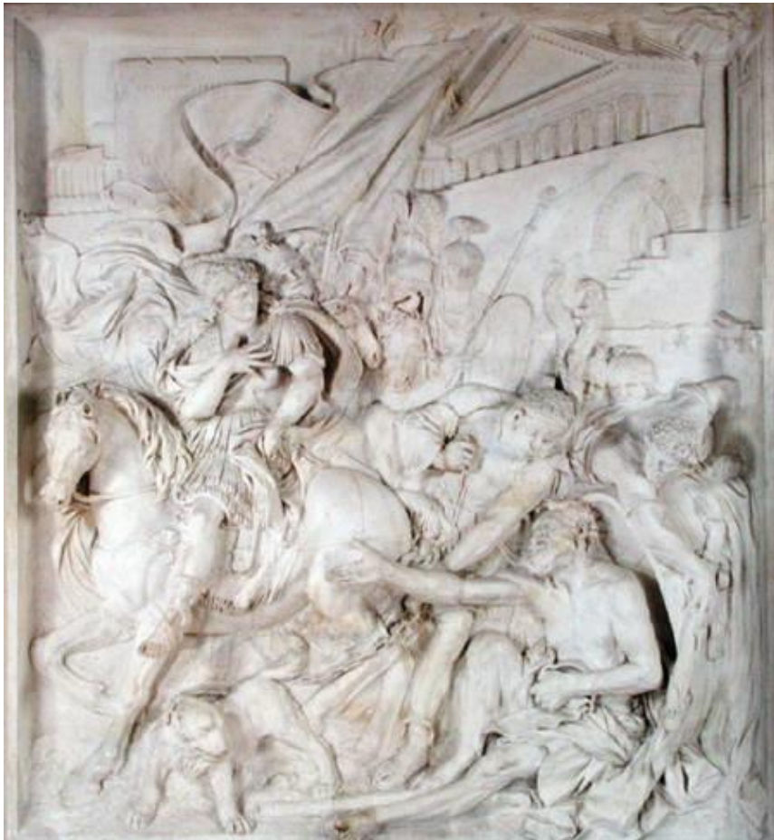
Slika 13. Pierre Puget, Aleksandrov susret s Diogenezom , Musée du Louvre, Paris, 1671.- 1689. godina

Aleksandrov susret s Diogenom (slika 13) najvažniji je mramorni reljef koji je izradio Puget. Cijela je kompozicija strogo planirana, a posebno se ističu arhitektonski elementi u pozadini reljefa kojima Puget zatvara pozadinu cjelinu.