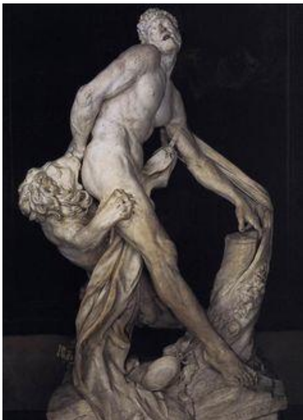
Slika 11. Pierre Puget, Milon iz Crotone, Pariz, David, 1671.-1682. godina

Početak Pugetove kasne faze obilježen je njegovom najboljom mramornom skulpturom Milon iz Crotone koju radi za park kraljevske palače Versailles. 89 Pugetova kompozicija snažno dočarava unutarnju dramu junaka kojeg napada lav dok mu je ruka zaglavljena u panju. Zvijer napada Milona otraga i zabada mu svoje pandže u bedro, a on se izvija i vrišti od bola. Skulptura Milon iz Crotone može se usporediti s Berninijevim Davidom (slika 12), ali je jasno vidljivo kako je Pugetova kompozicija suzdržanija od Berninijeve.