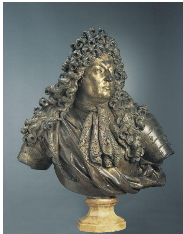
Slika 10. Antoine Coysevox, Brončana bista Luja XIV., London, 1686. godina

Veliki broj portretnih statua i bista pokazuje da je Coysevox bio promišljeni promatrač prirode. On nije idealizirao portretirane modele, ali im je dao uzvišeni izraz služeći se elementima njihove odjeće ili insignija. Brončanu bistu Luja XIV. (slika 10) Coysevox je izradio oko 1686. godine. 76 Svakako treba spomenuti da je prilikom izrade svoje biste Luja XIV. imao priliku vidjeti kraljevu bistu, a koju je 1665. napravio Gian Lorenzo Bernini. No, Coysevoxaova bista izgleda smireno pored nemirnih i vrtložnih tendencija vidljivih kod Berninijeve biste 77 .