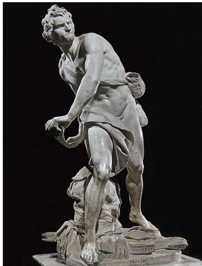
Slika 12. Gian Lorenzo Bernini, David, Rim, 1623.-1624. godina