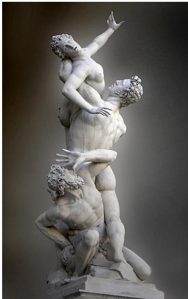
Slika 7. Giambologna, Otmica Sabinjanke , Firenca, 1574.-1582. godina

Skulptura Otmica Perzefoneje prema nekim svojim karakteristikama izrađena prema Giambologninom modelu. Za razliku od višedimenzionalne kvalitete Giambolognine Otmice Sabinjanke (slika7), Girardonova Perzefona djeluje, sukladno ideji da se skulpturi da jedno jako očište, jednodimenzionalno, poput kakvog velikog reljefa. 61 Stoga je ona po kompoziciji i ideji međusobnog odnosa likova bliža Berninijevom istoimenom djelu iz Galerije Borghese u Rimu, nastalom 1620. godine.