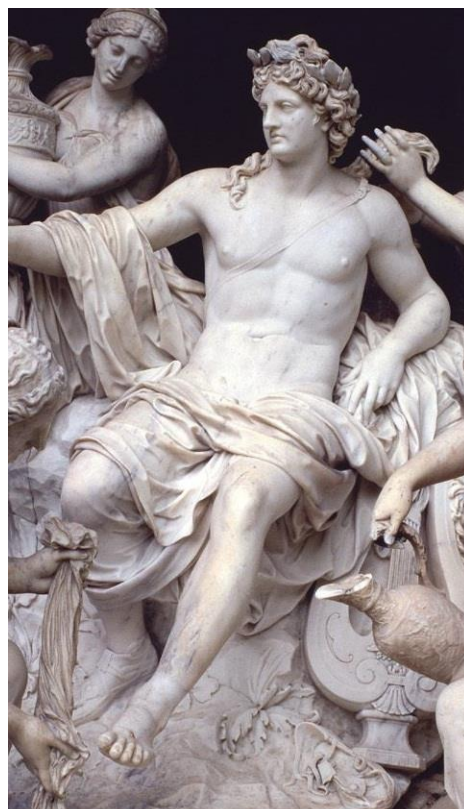
Slika 3. Detalj Apolona dvore nimfe

kopija iz 130.-140., Vatikanski muzeji, Rim.