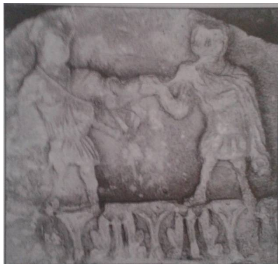
Slika 2. Reljef plesača iz Zostroga 3