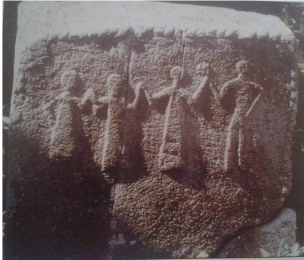
Slika 1. Stećak iz Krvavice 2