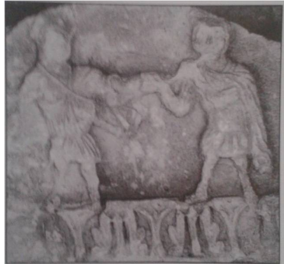
Slika 2. Reljef plesača iz Zostroga 3