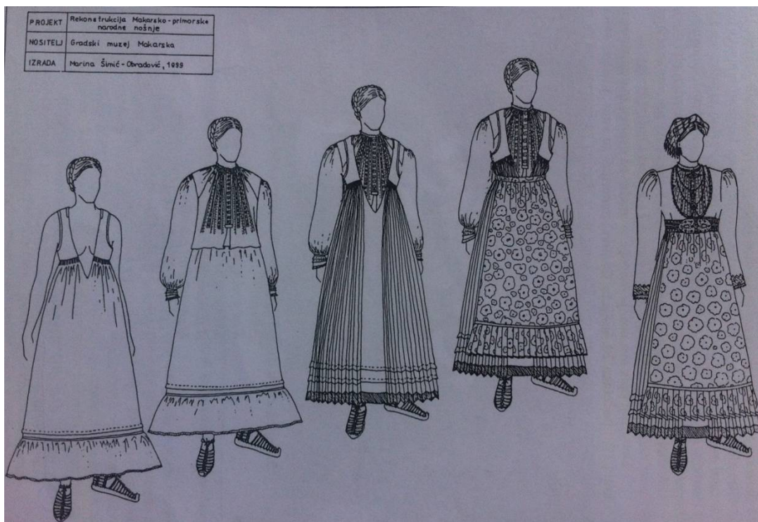
Slika 3. Način i redoslijed oblačenja ženske svečane nošnje 8

Suknje nose modre i zelene, A fuštane bile bumbažine Maramice, a i obrušice, I oprege riza zadarskoga A bičvice štama mletačkoga, Nestvenice kroja sarajnskoga. 7