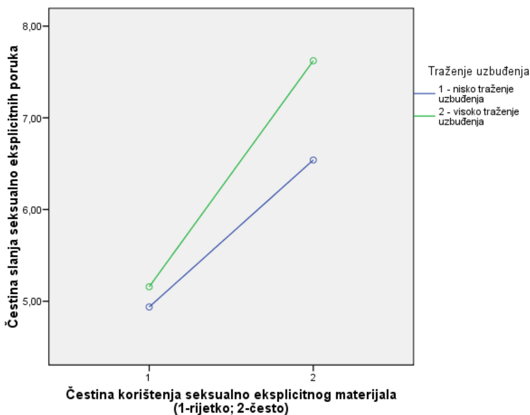
Slika 1. Prikaz čestine slanja seksualno eksplicitnih poruka ovisno o razinama traženja uzbuđenja i čestine korištenja SEM-a

kod djevojaka. U drugom su koraku uneseni sljedeći prediktori: stupanje u spolni odnos i korištenje SEM-a koji su se pokazali značajnim pozitivnim prediktorima slanja seksualno eksplicitnih poruka kod mladića i djevojaka. Drugi korak je objasnio ukupno 16% varijance kod mladića i 23% varijance kod djevojaka. U trećem su koraku unesene interakcijske varijable između SEM-a i traženja uzbuđenja, samopoštovanja i anksioznosti i depresivnosti, nakon čega traženje uzbuđenja i anksioznost i depresivnost nisu više značajni prediktori. Traženje uzbuđenja i depresivnost i anksioznost su se pokazali značajnim pozitivnim moderatorom efekata SEM-a na slanje seksualno eksplicitnih poruka u prvom mjerenju i to samo na poduzorku mladića. Oni mladići koji su skloniji traženju uzbuđenja i češće koriste SEM te oni mladići koji su anksiozniji i depresivniji i češće koriste SEM učestalije šalju seksualno eksplicitne poruke u prvom mjerenju (Slika 1. i 2.). Treći korak je objasnio 3.4% varijance kod mladića.