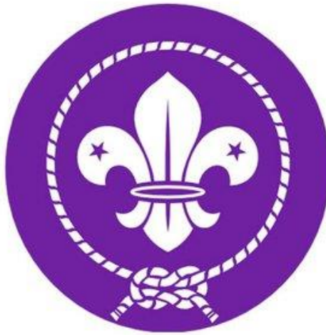
Slika 3. Znak WOSM-a