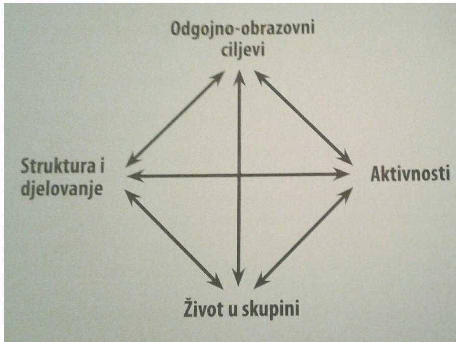
Slika 2. Dinamika izviđačkog pokreta

Za provođenje izviđačke metode u praksi potrebno je spomenuti dinamiku izviđačkog pokreta. Uz elemente izviđačke metode za voditelja je potrebno da primjenjuje ovu dinamiku.