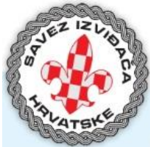
Slika 4. Znak SIH-a

Jedan od bitnijih segmenta izviđačkog života su izviđački zakoni. Od svakog člana i volontera skautskog pokreta očekuje se da će poštivati i živjeti prema zakonima izviđača.