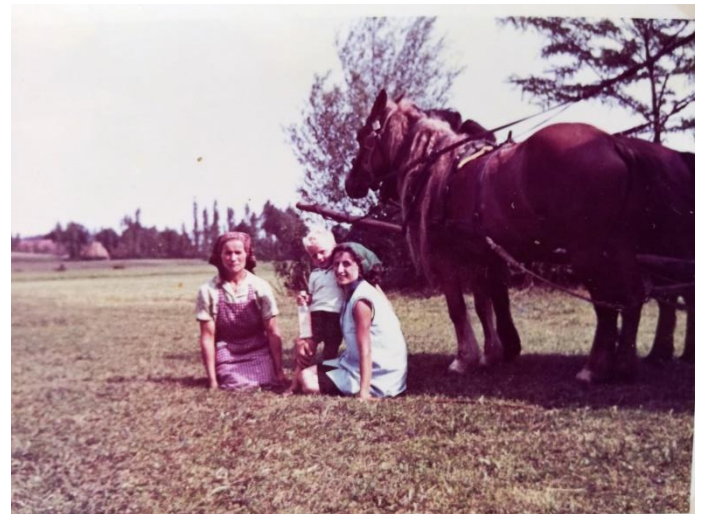
Slika 5: Konji kao prijevozno sredstvo