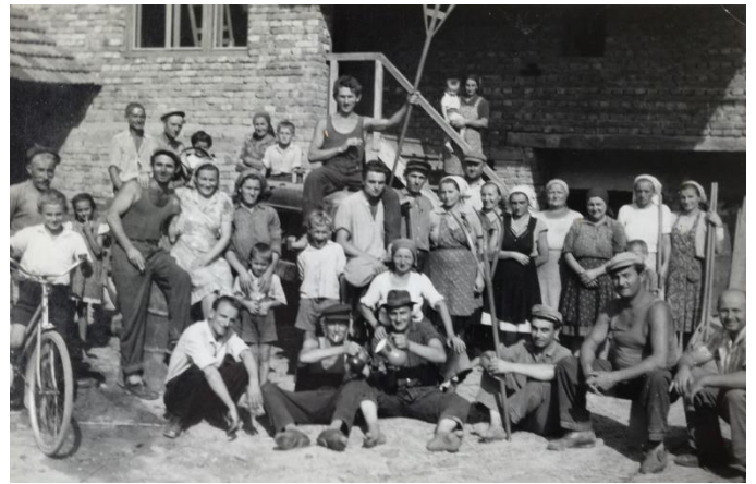
Slika 2: Vršidba – vršenje