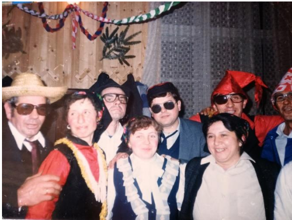
Slika 1: Maškare – mačkare