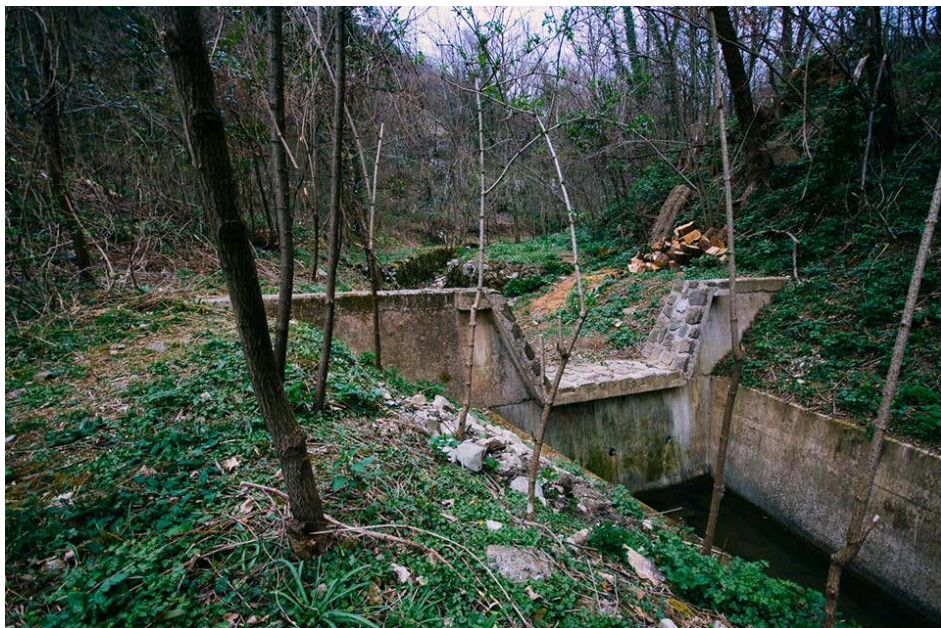
Slika 3. Brana koja je u Sanjinoj svijesti imaginarna granica Pašca i šume.

Prolazimo dijelom gdje je ograda ostala nedovršena i dolazimo do završetka betoniranog dijela potoka. Kazivačica tu lokaciju smatra početkom šume. Prelazimo preko zemlje, na kojoj je vidljivo da po njoj inače teče voda, no vode trenutno nema. Potom dolazimo do raspiljenog debla koje je burovito nevrjeme srušilo i koje je do nedavno preprječivalo put, a sada je stajalo raspiljeno u prikrajku, što je kazivačica prokomentirala rečenicom „netko mi uništava šumu“. Prevrnuto stablo djelovalo joj je simpatično i imala je dojam da označava službeni ulaz u šumu.