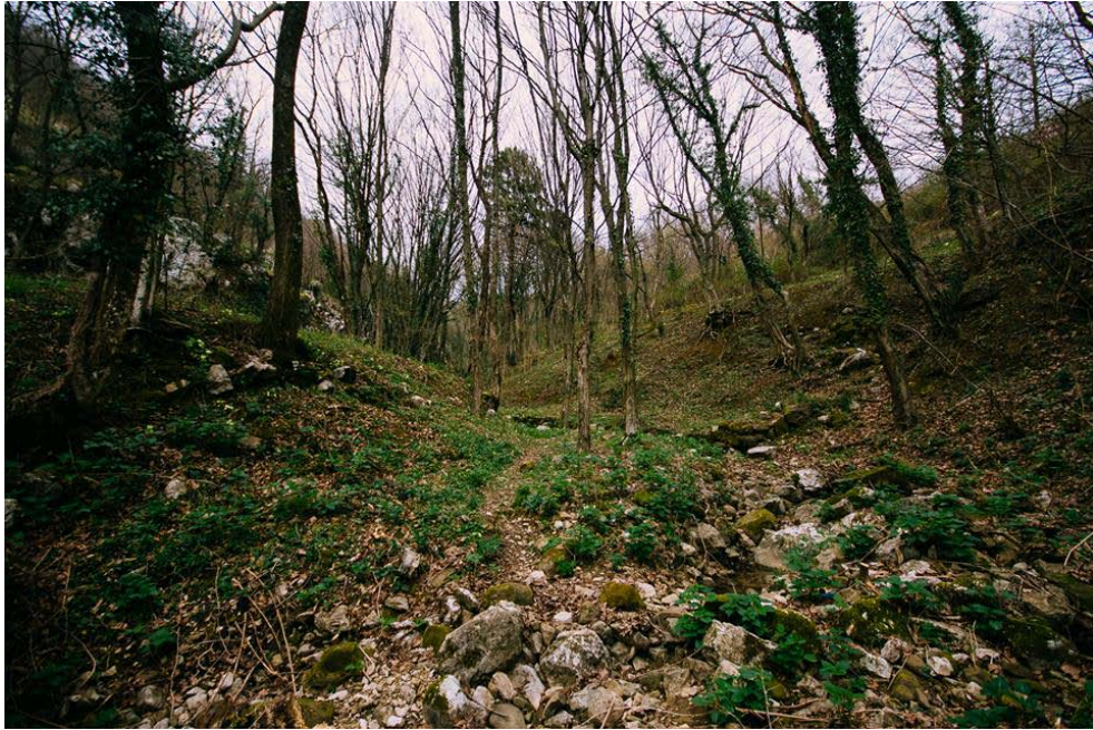
Slika 4. Početak šume, puteljak i kamenje oko kojih teče potok za kišnijih razdoblja.

Ulazimo u šumu krećući se po već razgaženom puteljku. S naše lijeve strane nalazi se korito potoka te zemlja koja je poduprta suhozidom. Iznad potoka nalazi se još nizova suhozida, gdje su nekada bile njive i voćnjaci, koji su neodržavani i na nekim mjestima u potpunosti srušeni, no ostali su vidljivi kao ljudska intervencija u prostoru. „Tu se više manje učvršćivala zemlja. Po priči mame, none i nonića možda je nešto od toga moje.“ No katastarske čestice su prije ugovarane i razmjenjivane među rodbinom stoga nije bilo službenih bilježenja te se vjerojatno s izmjenom generacija izgubilo samo vlasništvo nad zemljom. „Krajolik je konstituiran kao trajan zapis i svjedočanstvo života i rada prijašnjih naraštaja koji su obitavali u njemu i čineći to, ondje su ostavili nešto svoje“ (Ingold 1993 u Aldred 2010: 65). Aldred govori kako je trajan zapis, koji spominje Ingold, ono što je prisutno u krajoliku kao ostatak materijalnih stvari. Dok se drugi aspekti krajolika mijenjaju, neki materijalni elementi u krajoliku preostaju gotovo nepromijenjeni nakon svoga oblikovanja i inicijalne uporabe. To je primjetno na primjeru suhozida, koji više nemaju prvotnu funkciju odjeljivanja posjeda, već su samo estetski preostatak ljudske intervencije u krajoliku.