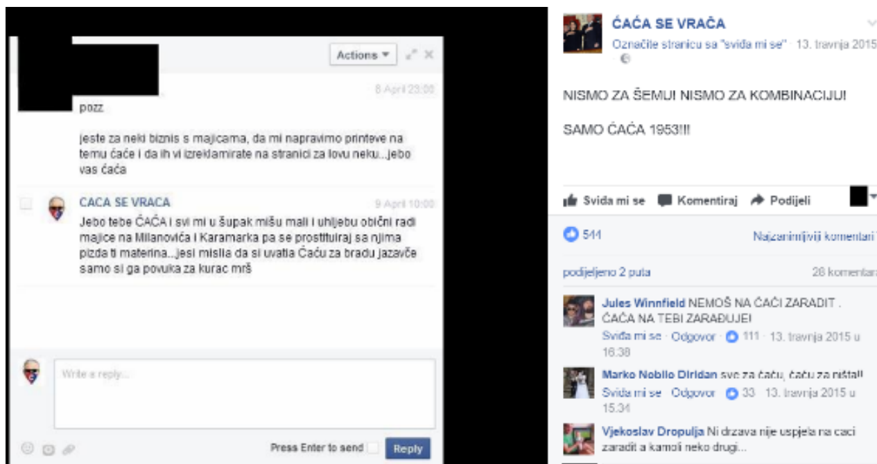
Odbijanje „biznisa s majicama“

U pogledu inkorporacije i komodifikacije vidljive su, dakle, dvije re/akcije. Po pitanju komodifikacije, dica ćaćina odbijaju ponude za brendiranjem i opredmećivanjem ĆAČE. Drugim riječima, odbijaju svoje aktivnosti vrednovati novčano. To je jedan od ko/autora, odnosno jedno dite ćaćino eksplicitnije i potvrdilo u svom gostovanju u emisiji Veto na Jabuci TV, rekavši kako su dobili nekoliko ponuda za prodaju stranicu, te kako su sve odbili, jer ju ni po kojoj cijeni ne bi prodali 17 . Iz toga bi se dalo iščitati kako dica ćaćina nastoje zadržati određeni stupanj autonomnosti (i anonimnosti), onoliko koliko ju je moguće zadržati u već definiranim parametrima Facebooka čijem razvoju i kapitalizaciji, htjeli to ili ne, doprinose svojim objavama i brojnim klikovima pratitelja. Dok s jedne strane, dakle, odbijaju komodifikaciju i inkorporaciju ĆAČE u politički diskurs pojedinih političara, s druge strane prihvaćaju, promoviraju te sami sudjeluju u procesima inkorporacije ĆAČE i diskursa Facebook stranice ĆAČA SE VRAČA u dominantne medijske kanale. Izgleda kako na taj način semiotički otpor, koji je nastao u opoziciji naspram dominantnog medijskog diskursa i dominantnog značenja Ive Sanadera, kroz proces sve češće inkorporacije poprima oblik privremenih, karnevalizacijskih praksi koje samo naizgled subvertiraju dominantna značenja i koje se povremeno pojavljuju kao noviteti spektakla u dominantnim medijskim trendovima.