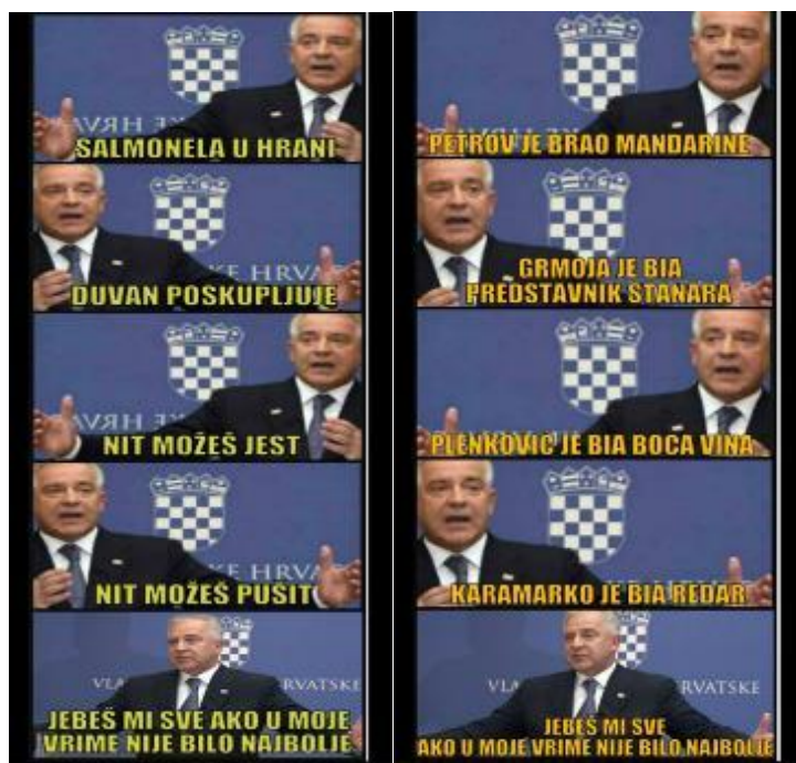
Primjer 6b – ČAĆOSTALGIJA