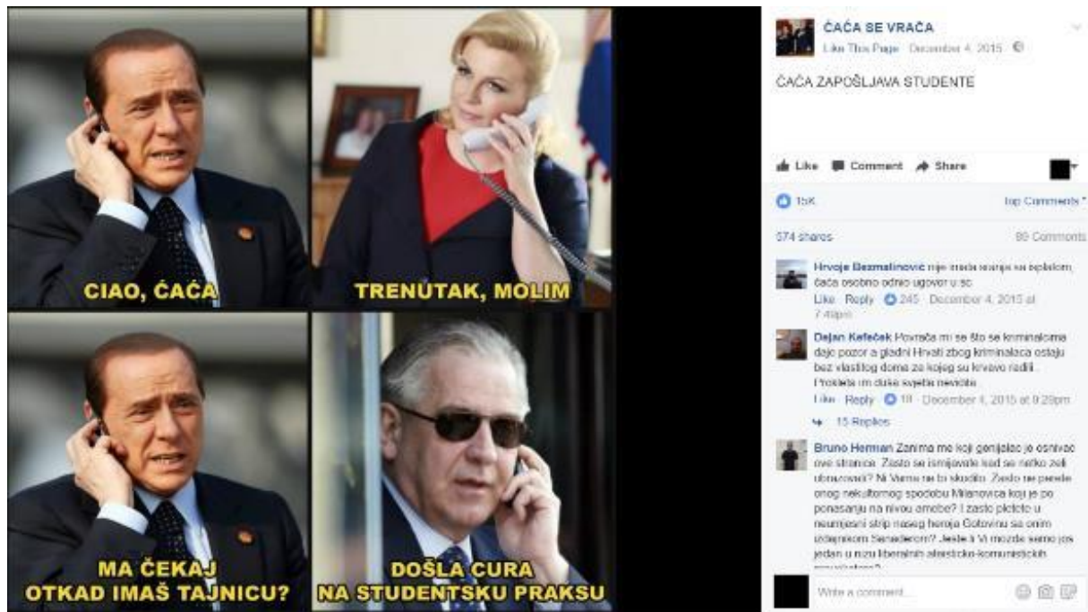
Primjer 1a – "Studentica Kolinda"

figurira kao svojevrsan mentor, moralni korektiv, uzor, „strog, ali pravedan“ otac koji Studenticu Kolindu pokušava (pre)usmjeriti na pravi put 14 .