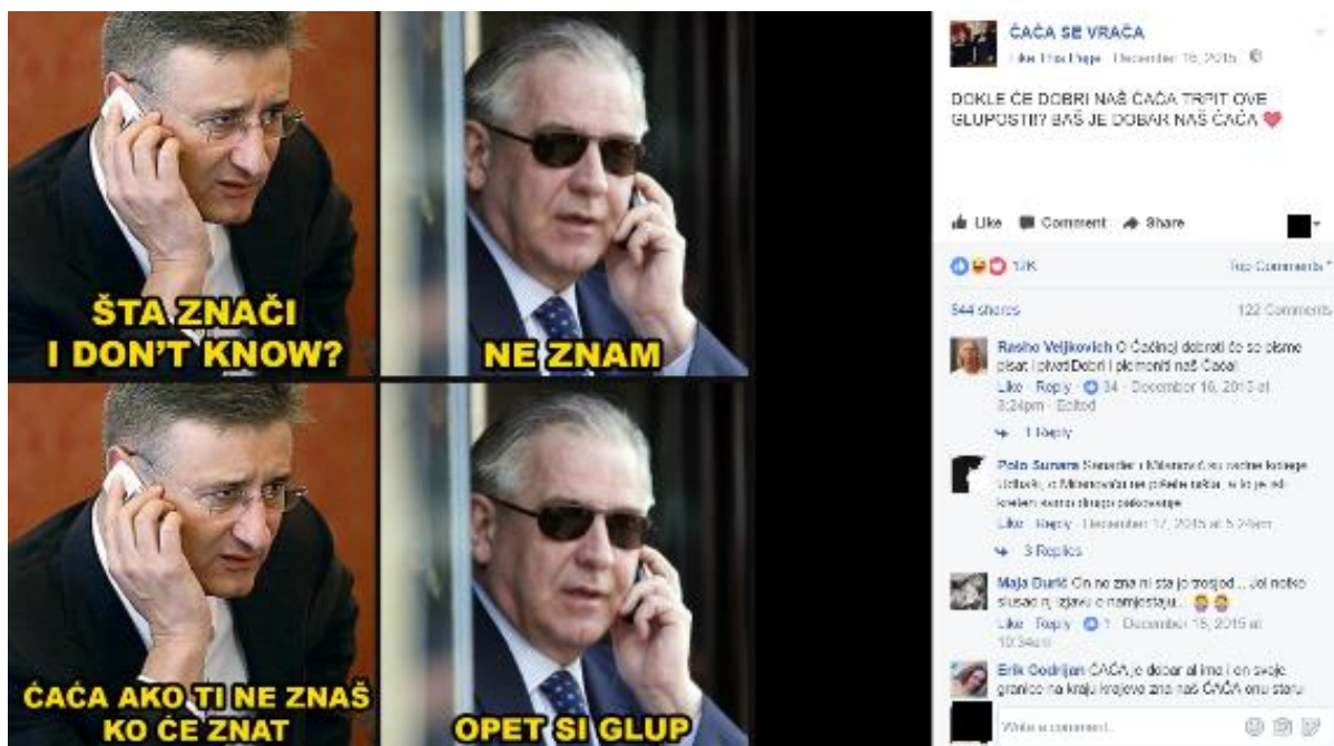
Primjer 3 - ČAĆA i Tomislav Karamarko