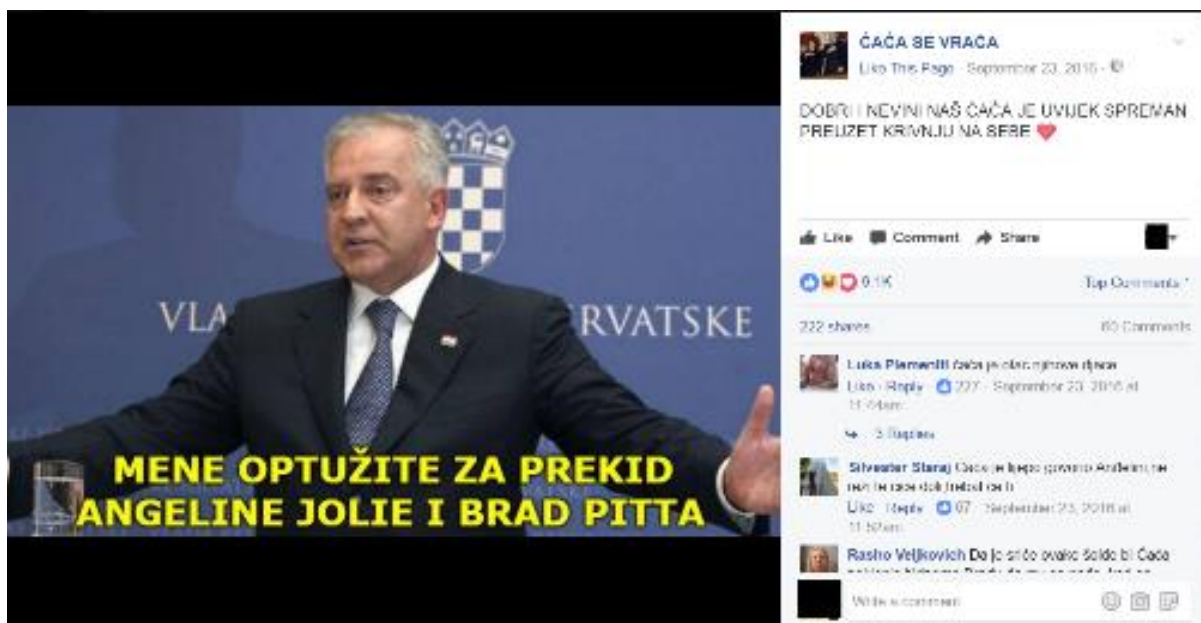
Primjer 5a – ČAČA i prekid Jolie-Pitt

Primjer 5a prikazuje ČAČU kako reagira na medijsku spektakularizaciju rastave braka holivudskih filmskih zvijezda Angeline Jolie i Brada Pitta, kada se u mnogim tabloidnim, kao i informativnim emisijama, senzacionalistički pratio rasplet njihova odnosa, dok je jedno od glavnih pitanja bilo – tko je kriv za prekid? ČAČA ponovno istupa, spreman preuzeti krivicu za njihov prekid.