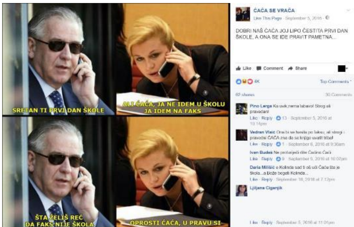
Primjer 1- "Studentica Kolinda"

Jedan od obrazaca unutar kojih se ČAČA konstantno pojavljuje je onaj Studentice Kolinde . Pojava i objava memeova u kojima se predsjednica RH Kolinda Grabar Kitarović pojavljuje u ulozi nemarne, neiskusne i pomalo nespretno studentice koja od mudrog, „strogog, ali pravednog“ ČAČE traži savjete, dopuštenja za razne aktivnosti ili se pak jednostavno opravdava zbog kojekakvih "propusta" na fakultetu, korespondira s periodom u kojem je predsjednica Grabar Kitarović upisala doktorski studij na Fakultetu političkih znanosti Sveučilišta u Zagrebu. Njezino je upisivanje na studij izazvalo burne reakcije u medijima, pa se tako u raznim emisijama, dnevnicima i tiskovinama burno raspravljalo o primjerenosti, praktičnosti i drugim implikacijama takvog poteza. Paralelno, sam je lik predsjednice satirički resemantiziran u ČAČINOM diskursu i praksama dice čačine : dominantno političko-medijsko i šire društveno značenje njezine institucionalne funkcije predsjednice Republike u ČAČINOM je diskursu preokrenuto i lišeno bilo kakve ozbiljnosti i važnosti. „Ozbiljna“, visoka državna dužnosnica u ČAČINOM je satiričkom imaginariju infantilizirana, dok je sam lik predsjednice dekodiran i ponovno kodiran u opozicijskom ključu u kojem gubi državničku, realpolitičku relevantnost. Predsjednica u ČAČINOJ perspektivi postaje isključivo studentica , dok ČAČA