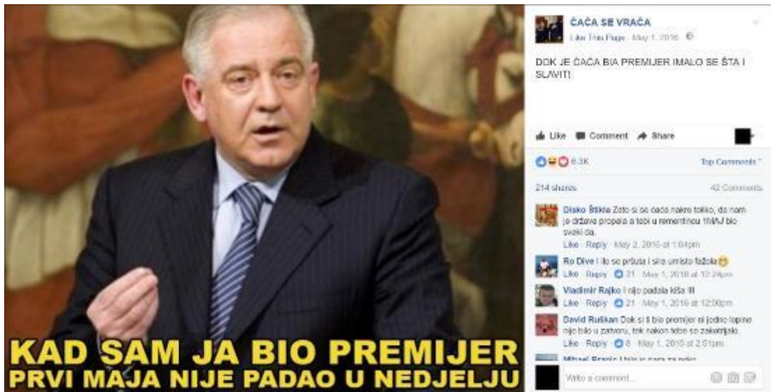
Primjer 6 – ČAČOSTALGIJA

I primjera ćaćostalgije , poput ostalih tipova memeova , ima mnogo. U njima prakse dice ćaćine kreiraju specifično značenje ČAĆE koje je moguće sagledati na dvije razine. Prvo, uočavaju se momenti u sadašnjosti koji se smatraju negativnim i problematičnim. U većini slučajeva, radi se o detektiranju problematičnih točaka u aktualnim društveno-političkim zbivanjima. Drugo, na temelju uočenih problema sadašnjost se uspoređuje s prošlošću, odnosno sa "Sanaderovom erom", te se prema određenim pokazateljima zaključuje da je u Sanaderovo vrijeme bilo (naj)bolje. Ovim se značenjskim i satiričkim obratom vrijeme Sanaderove vladavine mitologizira i idealizira, a na taj način, parafrazirajući Nikića Čakara (2009) iz poglavlja 3.1., Facebook stranica osigurava Sanaderu satirično-simboličku pozornicu na kojoj može realizirati ulogu mitskog, nikad prežaljenog velikog vođe čiji se mesijanski povratak iščekuje.