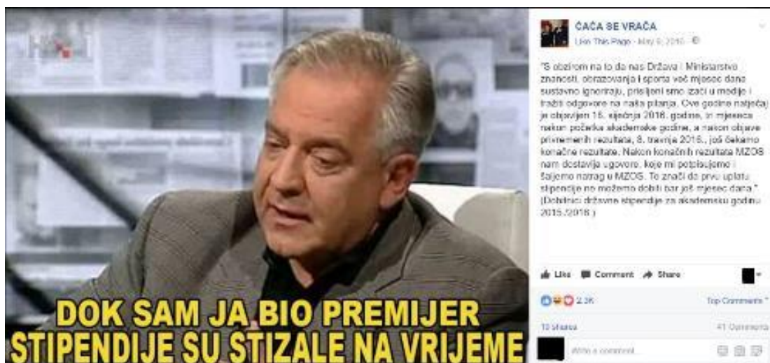
Primjer 6a - ČAĆOSTALGIJA

Ono što primjeri ćaćostalgije u principu nude, svojevrsna je sinteza ČAĆINA mnogoznačja koje prakse dice ćaćine produciraju. Posredstvom satirične nostalgije za ČAĆOM kritizira se sadašnjost, a u mitologiziranom i idealiziranom liku velikog vođe iz prošlih, (naj)boljih vremena, sažete su brojne ČAĆINE uloge i značenja: (naj)sposobni(ji) premijer, zaštitnik slabijih, sveznajući i praktički svemogućí lider, brižljiv i dobroćudan mentor, spasitelj i rješavatelj svih problema, itd. U ćaćostalgijskoj praksi se najpreciznije može uočiti efekt semiotičkog otpora: nakon odbijena dominantnog značenja Sanadera kao krivca, te opozicijskim preoblikovanjem Sanadera u ČAĆU - žrtvu, dolazi se do afirmativne satiričke konstrukcije ČAĆE kao nikad prežaljenog vođe.