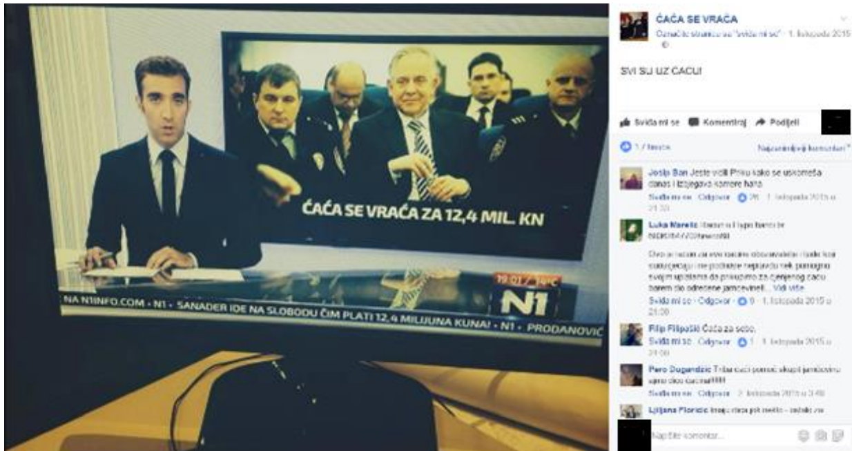
ĆAČA SE VRAĆA u informativnoj emisiji N1 televizije

Drugim riječima, dominantne su pozicije prepoznale i prihvatile opozicijsko-satirički diskurs koji se konstituirao upravo kroz karikaturu i odbijanje tih pozicija.