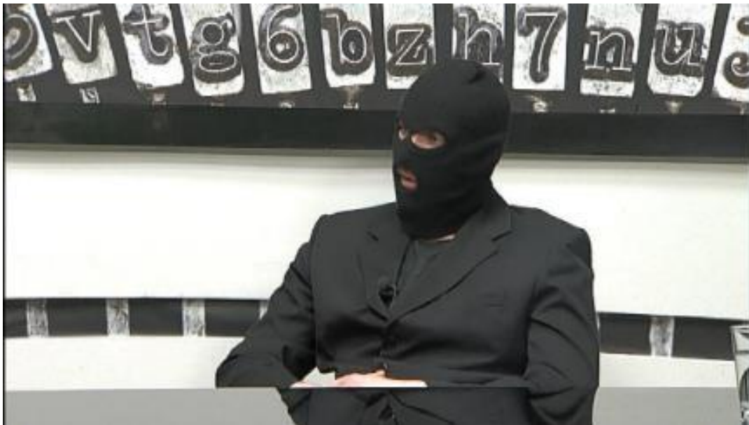
Dite ćaćino gostuje u emisiji Veto, Jabuka TV

istupati u medijima pa tako, osim intervjua u tisku i na portalima koji se mogu obavljati i putem pismene korespondencije, u nekoliko navrata gostuju i uživo u zabavnim televizijskim emisijama i drugim javnim događanjima koja su medijski popraćena. Prateći takvu vrstu njihove zastupljenosti u medijima za zaključiti je da se ko/autori izmjenjuju u svojim ulogama govornika (iako je teško odrediti njihov konačan broj), a svoje identitete i u takvim okolnostima pokušavaju zaštititi čineći to stereotipnim "lopovskim" maskama koje navlače preko glave skrivajući svoja prava lica, ali i izvodeći daljnji performans na temu ČÁĆINE navodne pljačke, solidarizirajući se s njime na način da se i sami pojavljuju u prepoznatljivom kostimu karikaturalnog kradljivca, kriminalca i huligana. Također, ko/autori kroz humor preusmjeravaju svako osobno pitanje na pitanje ČÁĆE i njegove dice , pa se, osim splitskog dijalekta, vrlo teško razabiru podaci o njihovim zbiljskim osobama.