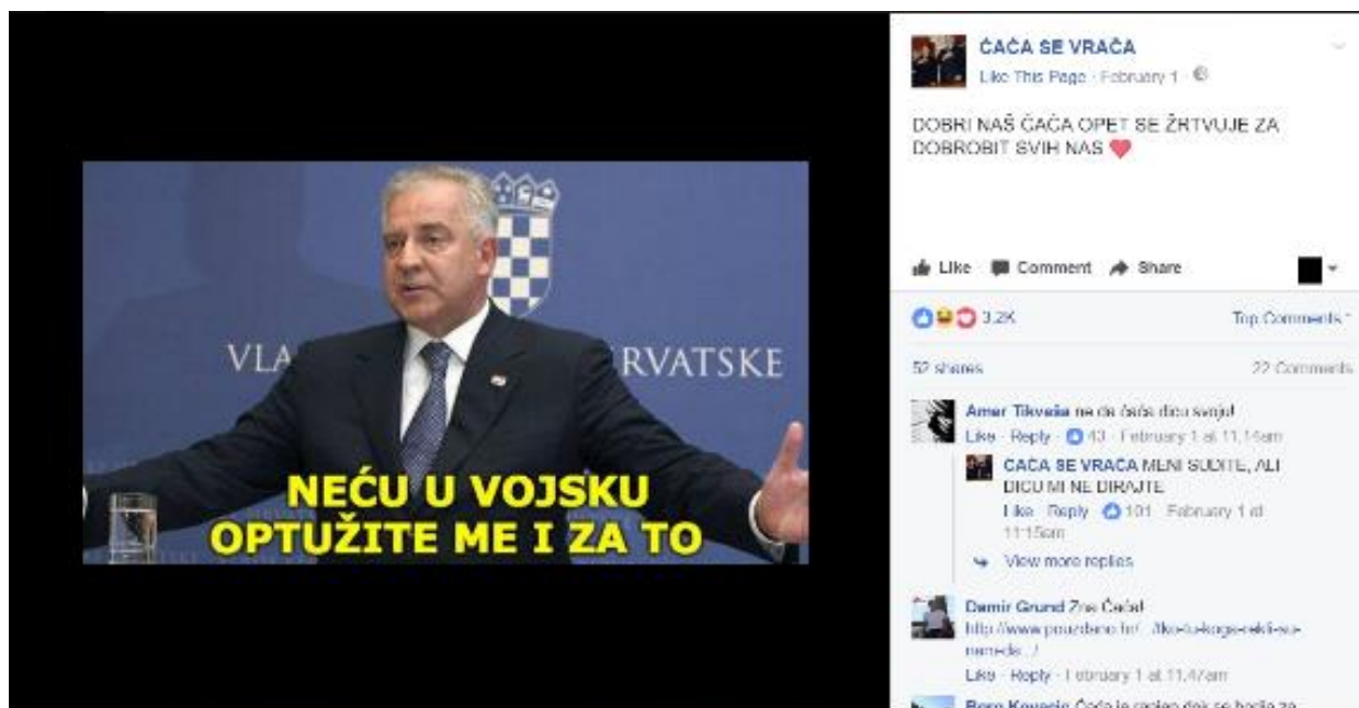
Primjer 5 - ĆAĆA i vojska