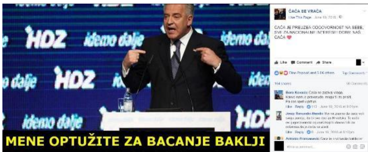
Primjer 5b – ČAČA i baklje

Primjer 5a prikazuje ČAČU kako reagira na medijsku spektakularizaciju rastave braka holivudskih filmskih zvijezda Angeline Jolie i Brada Pitta, kada se u mnogim tabloidnim, kao i informativnim emisijama, senzacionalistički pratio rasplet njihova odnosa, dok je jedno od glavnih pitanja bilo – tko je kriv za prekid? ČAČA ponovno istupa, spreman preuzeti krivicu za njihov prekid.