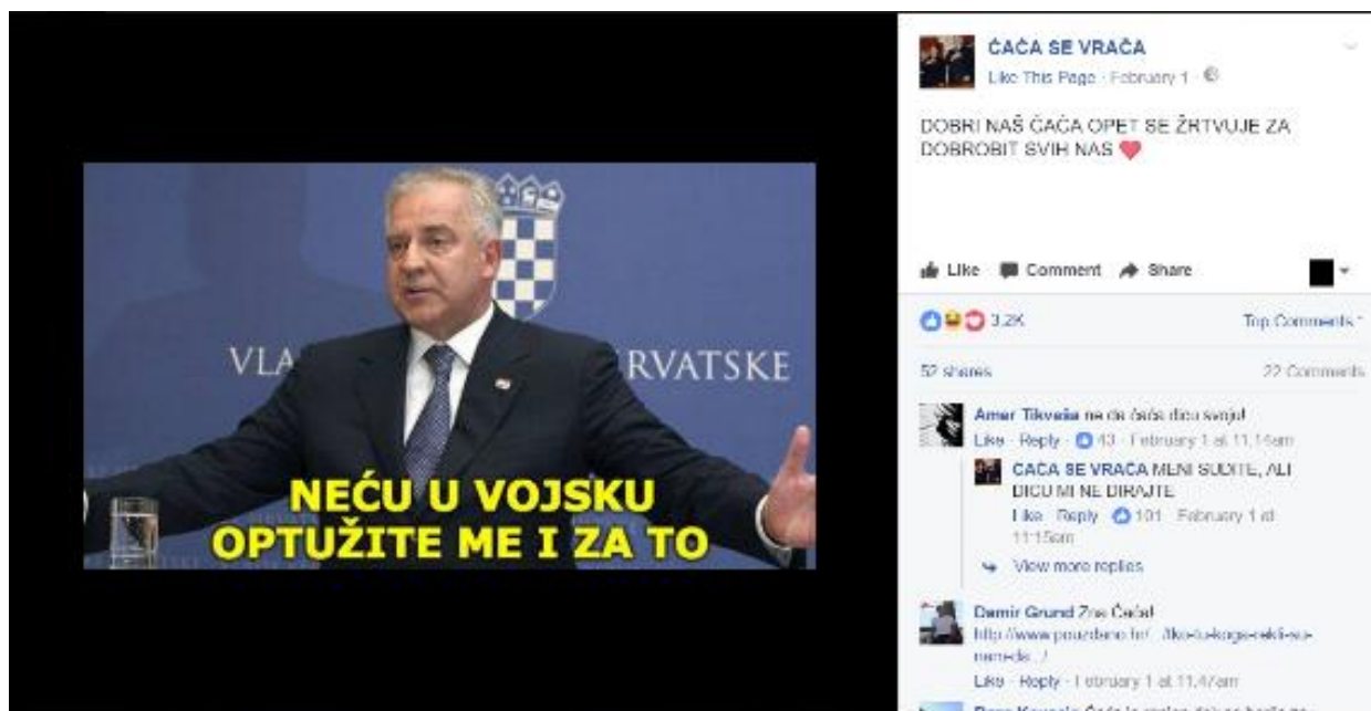
Primjer 5 - ĆAĆA i vojska