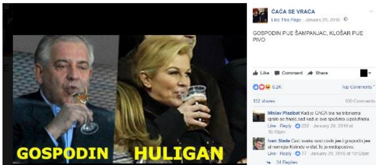
Primjer 2a - ĆAĆA i "Kolinda huligan"

Mnogostrukost značenja ĆAĆE dolazi nadalje do izražaja u brojnim memeovima u kojima ĆAĆA ostvaruje interakciju s mnoštvom različitih ličnosti s političke, estradne, pop-kulturne i šire društvene sfere. U njima ĆAĆA preuzima brojne uloge: od pronicljivog kritičara aktualnih socio-političkih događaja koji kritiku adresira na ironičan i humorističan način, preko detektora nepravde i borca za društvenu pravdu, pa do korektiva koji ironizacijom i podrugivanjem ukazuje na licemjerje, dvoličnost i kontradikcije, kao i na nesposobnost i neznanje sugovornica/ka s kojima u datom memeu komunicira.