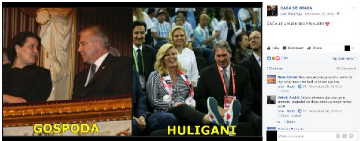
Primjer 2- ĆAĆA i "Kolinda huligan"

dominantni medijski diskurs koji je nerijetko isticao upravo Sanaderov kulturni kapital kao njegovu političku prednost i specifičnost, te se na taj način ironizira i indirektno, satirički kritizira „manjak“ kulturnog kapitala Kolinde huligana/predsjednice Grabar Kitarović.