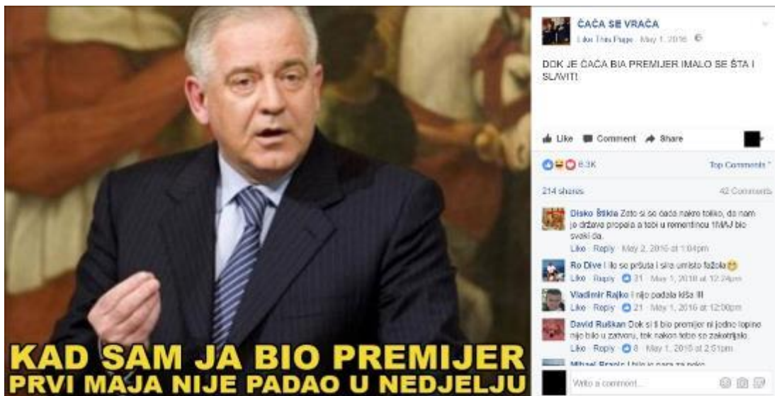
Primjer 6 – ČAČOSTALGIJA

I primjera ćaćostalgije , poput ostalih tipova memeova , ima mnogo. U njima prakse dice ćaćine kreiraju specifično značenje ČAĆE koje je moguće sagledati na dvije razine. Prvo, uočavaju se momenti u sadašnjosti koji se smatraju negativnim i problematičnim. U većini slučajeva, radi se o detektiranju problematičnih točaka u aktualnim društveno-političkim zbivanjima. Drugo, na temelju uočenih problema sadašnjost se uspoređuje s prošlošću, odnosno sa "Sanaderovom erom", te se prema određenim pokazateljima zaključuje da je u Sanaderovo vrijeme bilo (naj)bolje. Ovim se značenjskim i satiričkim obratom vrijeme Sanaderove vladavine mitologizira i idealizira, a na taj način, parafrazirajući Nikića Čakara (2009) iz poglavlja 3.1., Facebook stranica osigurava Sanaderu satirično-simboličku pozornicu na kojoj može realizirati ulogu mitskog, nikad prežaljenog velikog vođe čiji se mesijanski povratak iščekuje.