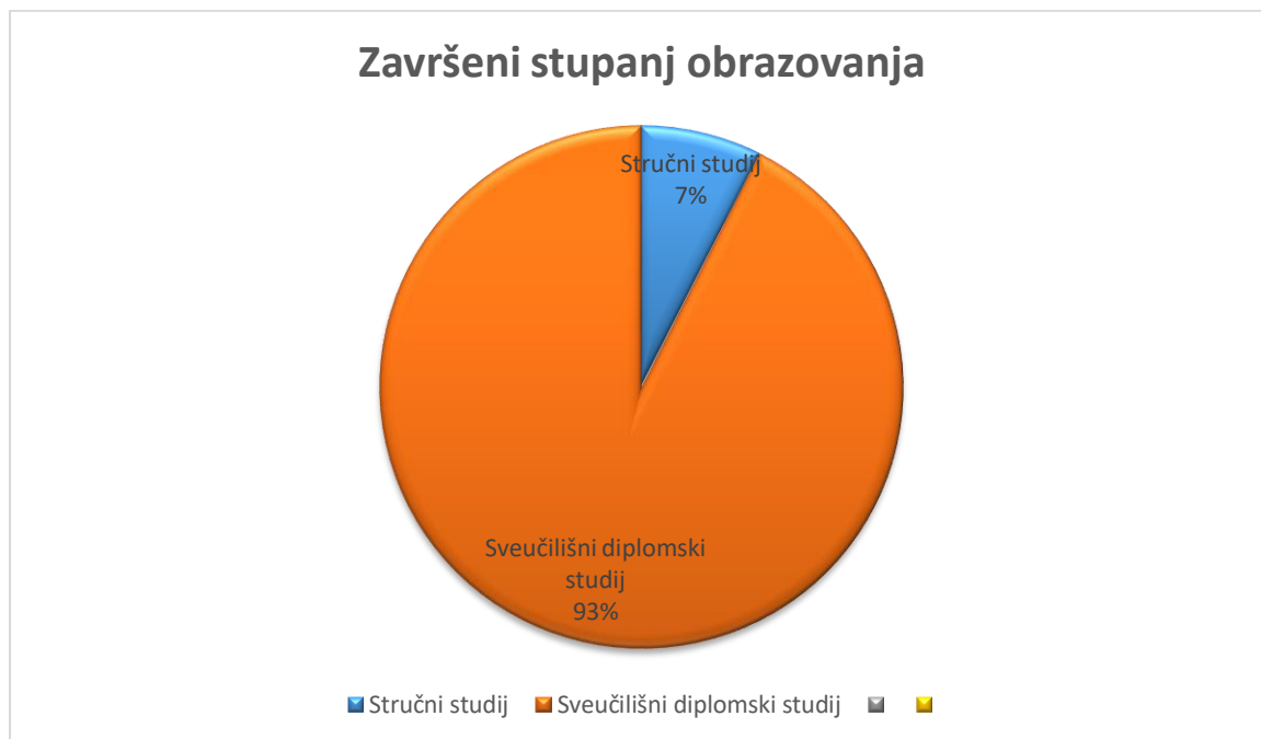
Slika 3. Broj ispitanika s obzirom na završeni stupanj obrazovanja

iskustva, te 23,3% ima 21 godinu i više. Niti jedan ispitanik nema od 11-15 godina radnog iskustva.