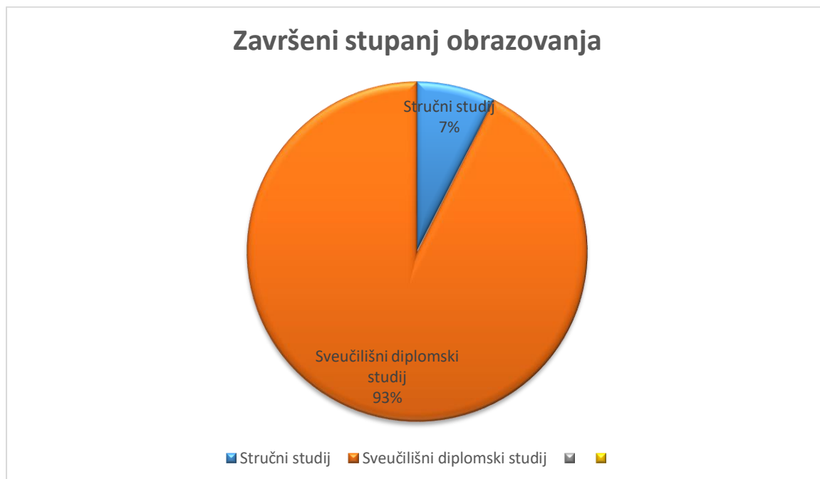
Slika 3. Broj ispitanika s obzirom na završeni stupanj obrazovanja

iskustva, te 23,3% ima 21 godinu i više. Niti jedan ispitanik nema od 11-15 godina radnog iskustva.