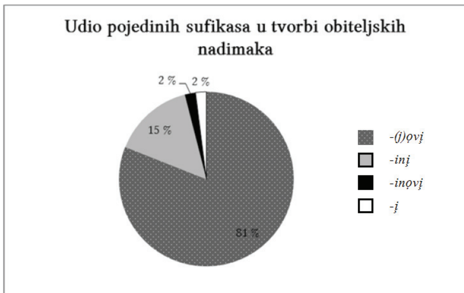
Slika 2. Grafički prikaz udjela pojedinih sufikasa u tvorbi obiteljskih nadimaka u Držimurcu i Strelcu

Sufiksom se -in̆j (pretkazivo) tvore samo obiteljski nadimci kojima su u osnovi imenice e -sklonidbe, dok se sufiksom -(j)ov̆j najčešće tvore obiteljski nadimci kojima su u osnovi imenice a -sklonidbe (i to sufiksom -ov̆j 84 % svih obiteljskih nadimaka obuhvaćenih tvorbenim obrascem O + (j)ov̆j , a sufiksom -jov̆j tvori se 11 % takvih obiteljskih nadimaka). Obiteljski nadimci kojima je osnova imenica e -sklonidbe, a tvore se sufiksom -ov̆j , čine samo 4 % obiteljskih nadimaka, dok se sufiksom -jov̆j tvori 1 % takvih obiteljskih nadimaka.