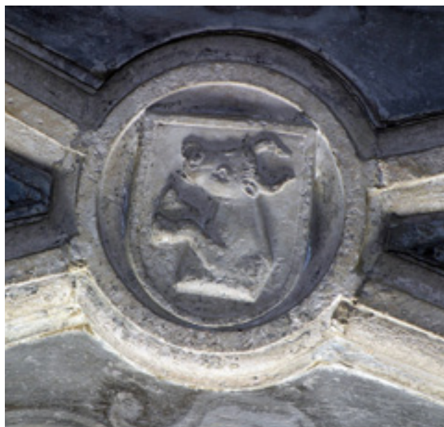
10. Rijeka, kapela Bezgrešnog Začeca, zaglavni kamen s grbom Rauber

nadgrobna ploča, poput one Raunacherovih, također figurira kao import u usporedbi s ukupnom slikom preostalog ornamentalnog repertoara kapele. 46 Princip oblikovanja i svodnja kapele vjerojatno je bio vrlo sličan kao i kod prethodnoga primjera, mada je zbog barokizacije i preinaka 19. i 20. stoljeća riječ o znatno slabijem sačuvanom primjeru. Dekorativna plastika svodnoga zaključka dijelom je uklonjena zbog umetanja baroknoga oltara. U konzervatorskim radovima izvođenim početkom pedesetih godina 20. stoljeća, kojima se htio naglasiti njezin gotički slog, osobito zidni slog i zazidane monofore, izvršene su znatnije pregradnje vanjskoga zida, što je dodatno otežalo čitanje spomenika, primjerice ne nedostaju samo mrežišta prezentiranih prozorskih otvora već i njihove špalete. Usprkos prezidavanjima vidljivo je da je zidni slog znatno kvalitetnije izveden dobro uslojenim klesancima. Križno-rebrasti svod prvoga jarma do portala kruni ključni kamen s reljefnim prikazom sunca, s glavom nasmiješena putta . Ključni kamen drugoga jarma je medaljon s prikazom grba obitelji Rauber, štita na kojem izrasta bik s prstenom u nosnicama (sl. 10). Crni bik trebao bi rasti iz srebrne podloge, iz ustiju