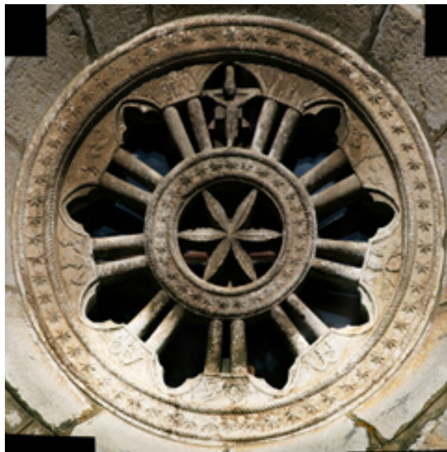
3. Omišalj, rozeta pročelja Stomorine , župne crkve Uznesenja Marijina Omišalj, parish church of Mary's Assumption, rosette in the front façade of the Stomorina

cijeniti kada je ondje ugrađen, preko robusne monofore drugoga kata (kakvima je, barem prema Klobučarićevu prikazu grada Rijeke iz 1579. godine, bila providena završna loža za zvona), na kvarnerskom području svojstvene zvonice prve polovine 16. stoljeća, do kasnogotički koncipirane bifore današnje lože za zvona. Pažnju ćemo ovom prigodom posvetiti isključivo analizi elemenata arhitektonske plastike portala orijentirana prema istoku, tj. pročelju crkve i neposredno nad njim postavljene bifore. Odmah treba istaknuti da je lučno zaključeni portal izveden od monolitna gređa i bez ijednog preveza s građom ziđa, očito posve recentnoga postanka. Na tjemenu njegova plitkoga luka vrlo je pravilnim arapskim brojevima, za našu temu očito također posve nedavno, možda čak prigodom obnove provedene između dva svjetska rata, uklesana 1377. godina. To je možda bila restauracija neke zatečene datacije, no o tome nema podataka. Već nakon