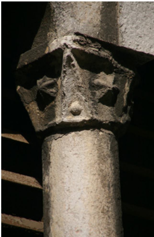
2. Rijeka, kapitel bifore nad portalom zvonika župne crkve Uznesenja Marijina

Rijeka, parish church of Mary's Assumption, capital of the bifora above the belfry portal