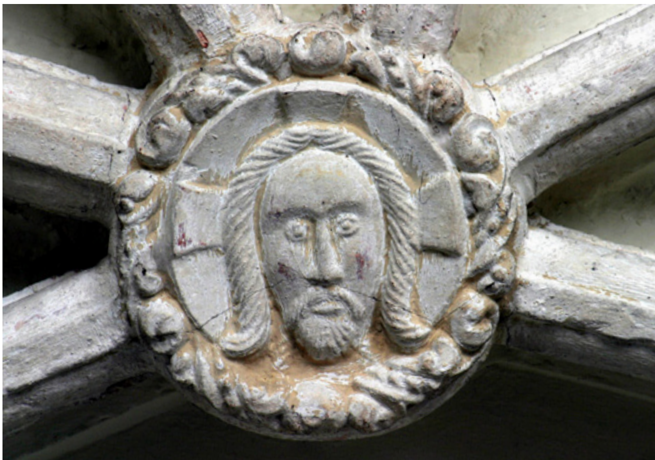
8. Rijeka, kapela Presvetog Trojstva, Vera Icon Rijeka, chapel of the Holy Trinity, Vera Icon