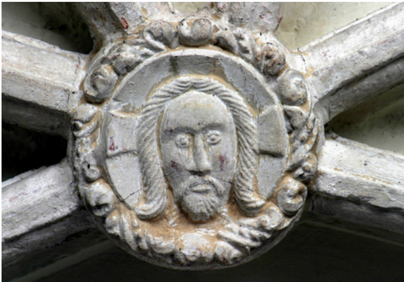
8. Rijeka, kapela Presvetog Trojstva, Vera Icon Rijeka, chapel of the Holy Trinity, Vera Icon