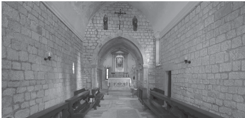
Slika 7: Unutrašnjost crkve sv. Frane na Komrčaru