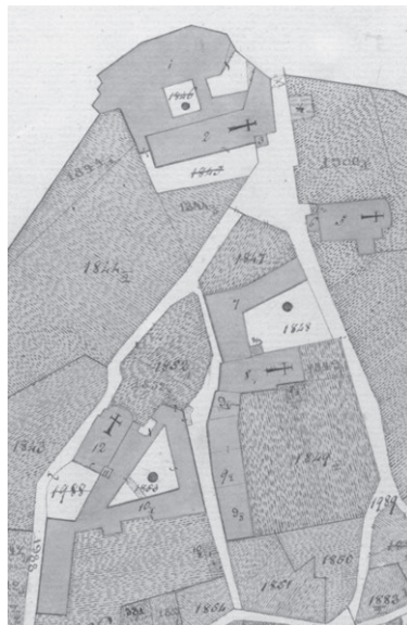
Slika. 1: Sjeverni dio grada Krka na katastarskoj mapi iz 1821. godine

Iako su samostan sv. Franje u gradu Krku trećoreci preuzeli tek 1783. godine 6 , zbog iznimne slojevitosti i starosti toga zdanja upravo njime započinjemo povijesno-umjetnički prikaz trećoredskih samostana na Kvarnerskim otocima. Na eliptičnom, u temeljima pretpovijesnom arealu pružanja krčkih gradskih zidina samostan zauzima njihov sami vršak pokraj sjevernih gradskih vrata Porte Sù(perior) . Iako smješten unutar zidina, ovaj je prostor u srednjem i ranom novom vijeku bio suburbanog karaktera. Podno njega, unutar krčkih gradskih zidina, od zapada prema istoku pružali su se i danas postojeći ženski benediktinski samostan Gospe od Anđela, ukinuti samostan klarisa s crkvom Marijina Navještenja i benediktinski samostan sv. Mihovila, od kojeg je preostala crkva koja danas nosi titular Gospe od Zdravlja. Odreda su se unutar zatvorenih samostanskih cjelina, kako je i uobičajeno uz samostanske zgrade i dvorišta, pružali prostrani vrtovi. Dok samostan sv. Franje zauzima područje uz sjeverne gradske zidine, dijelom se koristeći njima kao svojom sjevernom fasadom, crkva se pruža južno od njega. Pročeljem je orijentirana prema samostanskom vrtu, začeljem prema gradskim vratima, sjevernim zidom prema klausturu, a južnim prema Trgu krčkih glagoljaša, koji je u srednjem vijeku nosio logično ime sv. Mihovila, prema crkvi u koju se s njega moglo neposredno kročiti. 7