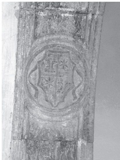
Slika 8: Grb obitelji Dominis na trijumfalnom luku crkve sv. Frane na Komrčaru

Tik pred svetištem, na mjestu rezerviranom za iznimno važna donatora, nalazi se grobna raka rapskoga slikara Juana Boschetusa iz 1515. godine. 40 Ploča je izvrstan i za rapske prilike vrlo složen primjer onoga što se naziva ornamentalnim repertoarom ugarske renesanse. Na sredini svake stranice vegetabilne bordure okvira ploče uklesan je pokojnikov monogram. Na središnjem je štitu, obrubljenom lovorovim vijencem, prikazana piramida, njezin odraz i sunce. Iz ljljlana nad štitom izviru nabrane vijoreće vrpce povijenih krajeva. Podno štita na plitkim vrpcama ovješena je tabula ansata s natpisom o pokojniku. 41 Odmah iza Bosche-