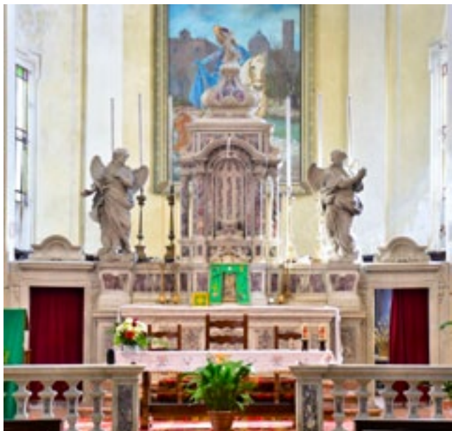
1. Altare maggiore, chiesa parrocchiale, Ceregnano High altar, parish church in Ceregnano