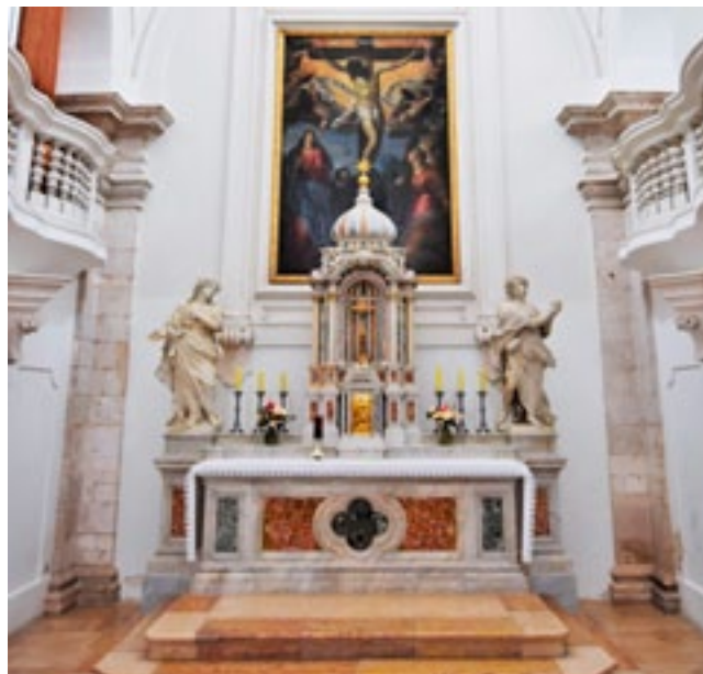
2. Altare maggiore, chiesa benedettina di Santa Maria, Zara High altar, Benedictine church of Saint Mary in Zadar

dell'altare le due porte laterali che conducono al coro ligneo semicircolare che si trova nell'abside dietro l'altare stesso. All'intero complesso presbiteriale appartengono pure le balaustre a colonnine e le piccole custodie parietali per l'olio santo e le reliquie collocate sui pilastri dell'arco trionfale. La decorazione scultorea del manufatto è costituita da due grandi angeli stanti in marmo di Carrara con le ali abbassate; indossano la tunica con un mantello stilizzato. 4 L'Angelo posto a sinistra ha la mano destra tesa in avanti e la sinistra appoggiata al seno, il capo con un movimento deciso è rivolto verso il tabernacolo. L'Angelo di destra presenta un marcato contrapposto mostrando la gamba scoperta, le mani sono congiunte davanti il petto. Due piccoli putti sono distesi sul timpano sovrastante la portella del tabernacolo e reggono i simboli dell'Eucarestia: l'uva e la spiga. Infine, sulla sommità della cupola del tabernacolo si trova il Cristo risorto con le braccia aperte e stese in diagonale. Con la mano destra regge lo stendardo, lo sguardo è rivolto al cielo e ai suoi piedi sono posti due cherubini.