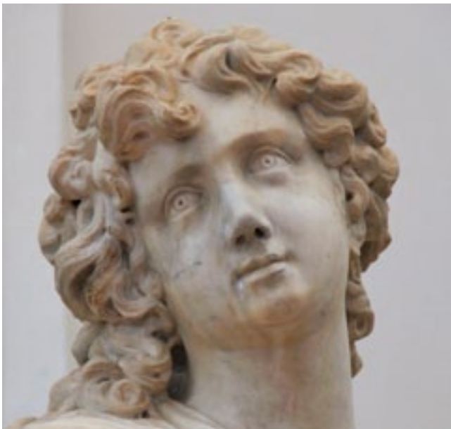
6. Giovanni Maria Morlaiter, Angelo, chiesa benedettina di Santa Maria, Zara, dettaglio

Giovanni Maria Morlaiter, Angel, Benedictine church of Saint Mary in Zadar