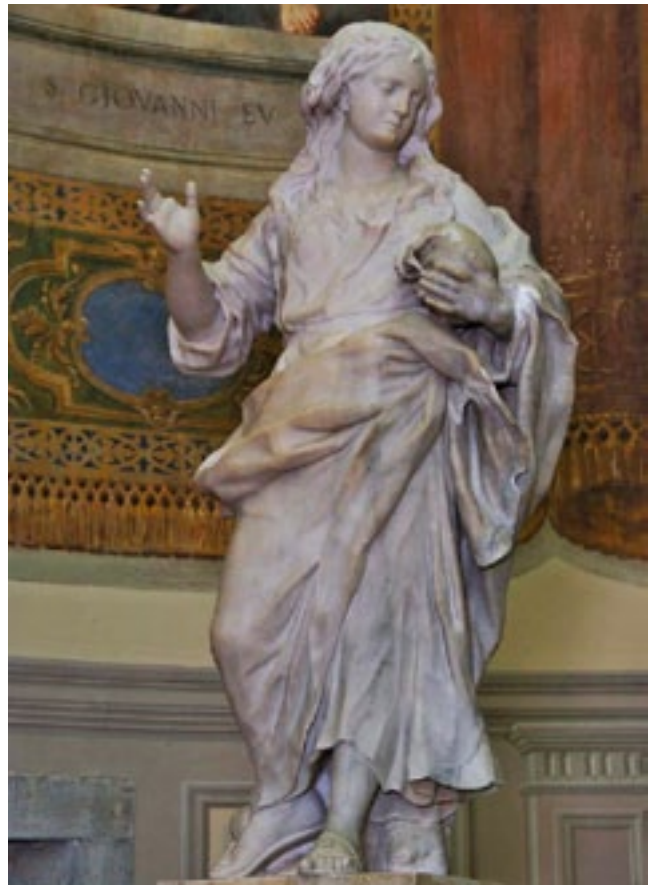
8. Gregorio Morlaiter, Santa Maria Maddalena, chiesa parrocchiale, Artegna Gregorio Morlaiter, Santa Maria Maddalena, parish church, Artegna