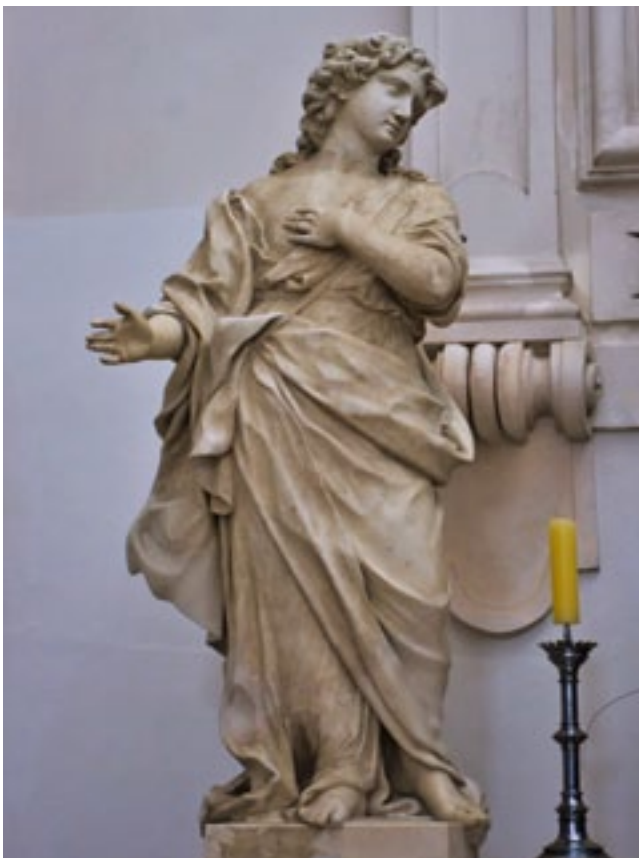
4a. Giovanni Maria Morlaiter, Angelo (testa e braccia ricostruite), chiesa benedettina di Santa Maria, Zara Giovanni Maria Morlaiter, Angel (with his head and hands reconstructed), Benedictine church of Saint Mary in Zadar