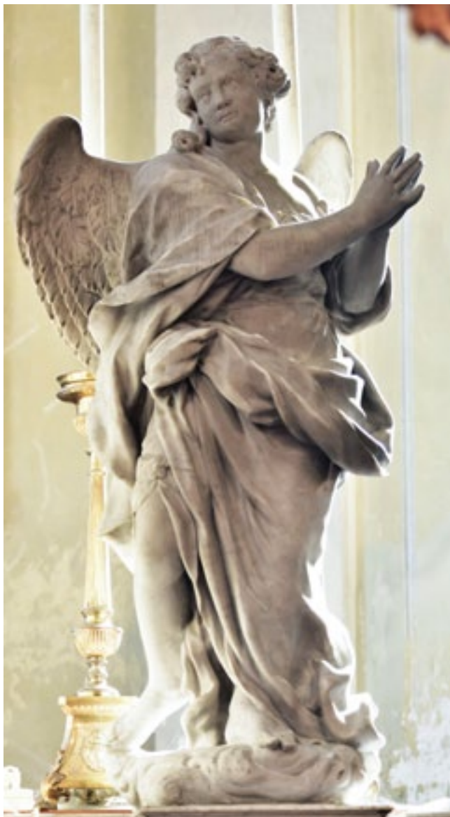
5b. Gregorio Morlaiter, Angelo, chiesa parrocchiale, Ceregnano

Gregorio Morlaiter, Angel, parish church in Ceregnano