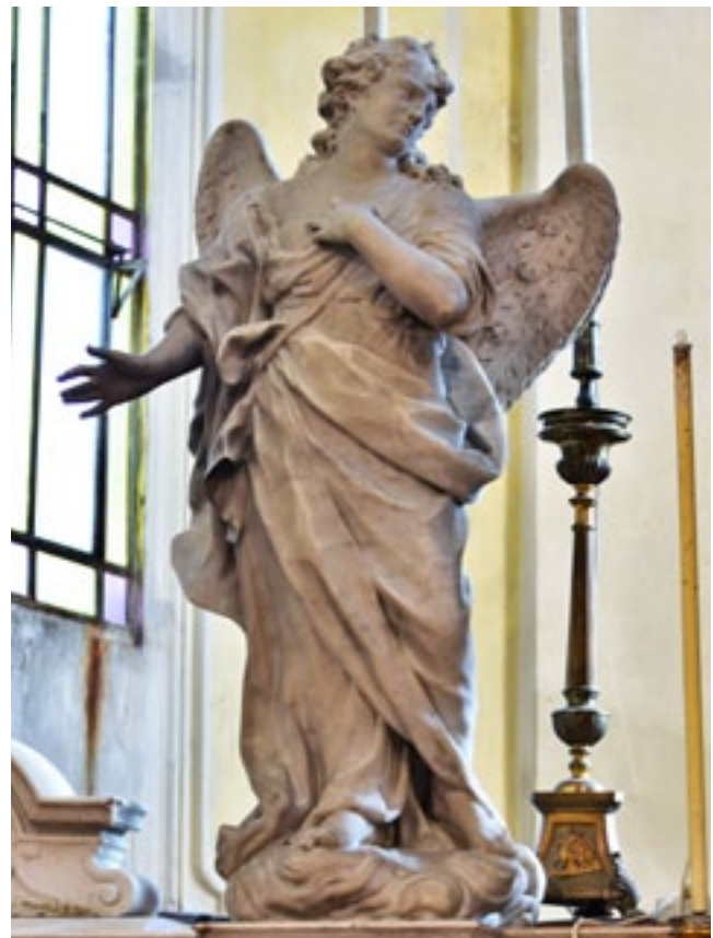
5a. Gregorio Morlaiter, Angelo, chiesa parrocchiale, Ceregnano Gregorio Morlaiter, Angel, parish church in Ceregnano