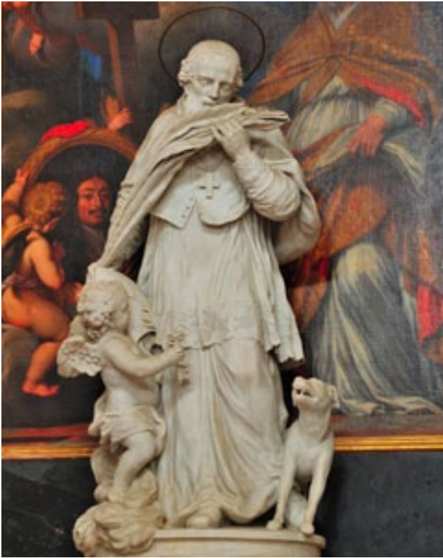
9. Gregorio Morlaiter, San Bellino vescovo, cattedrale, Chioggia

Gregorio Morlaiter, San Bellino, Chioggia cathedral