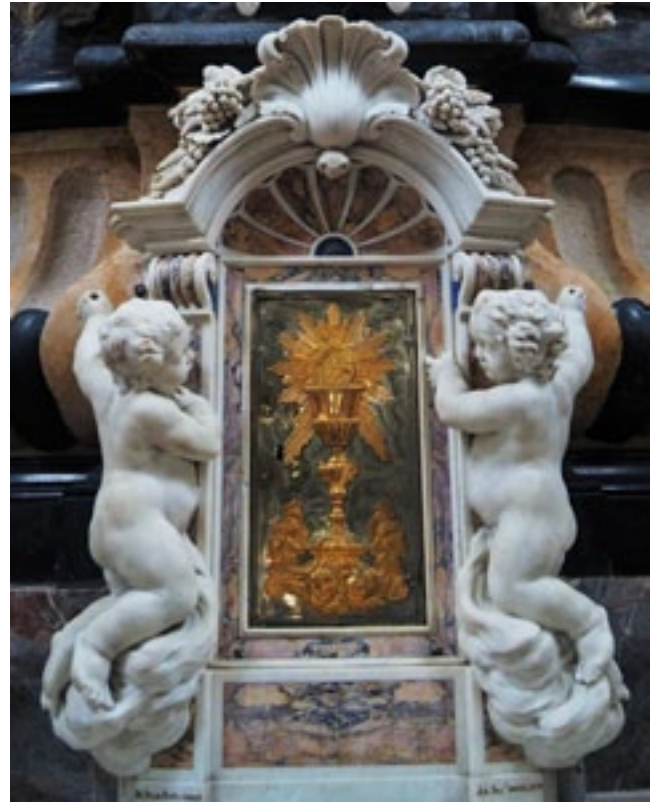
10. Gregorio Morlaiter, tabernacolo, Sant'Andrea della Zirada, Venezia

Per la realizzazione dell'altare di Ceregnano Gregorio ha utilizzato come esempio le opere del padre, ossia i modelli vecchi quasi di vent'anni per gli Angeli di Zara. Questi, assieme a molti altri simili si trovavano nella