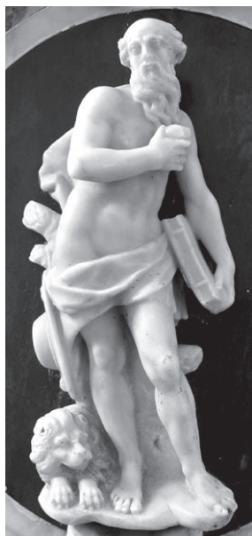
Slika 7: Venecijanski kipar, sveti Jerolim, crkva svetog Jerolima, Martinšćica