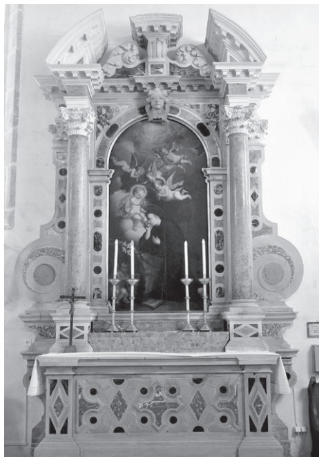
Slika 1: Giuseppe Cavallieri, oltar svetog Antuna Padovanskog, crkva svetog Franje, Krk, 1708.

I u Krku i u Kanfanaru identično su riješeni stipesi i njegove bočne konzole, retabl sa širokim bočnim volutama i atika s mesnatim lisnatim viticama. Korišten je isti mramor, žuti, crni i crveni, u kombinaciji s istarskim kamenom. Jedina je razlika da su u Kanfanaru kapiteli korintski, no jednako vješto klesani kao oni kompozitni u Krku, a umjesto krčkog kerubina, u Kanfanaru je u tjemenu luka pale isklesan grb obitelji Ruffini. Štoviše, na predeli, koja je većim djelom zaklonjena kasnijim mramornim tabernakulom, može se iščitati ime donatora, podestata Victora Ruffinija i 1707. godina. 12 S obzirom na kronologiju gradnje, može se smatrati da je oltar u Kanfanaru poslužio kao model za onaj u Krku. Naime, arhivski izvori spominju da je krčki oltar napravljen prema nacrtu koji je priložio upravo arhitekt Cavallieri.