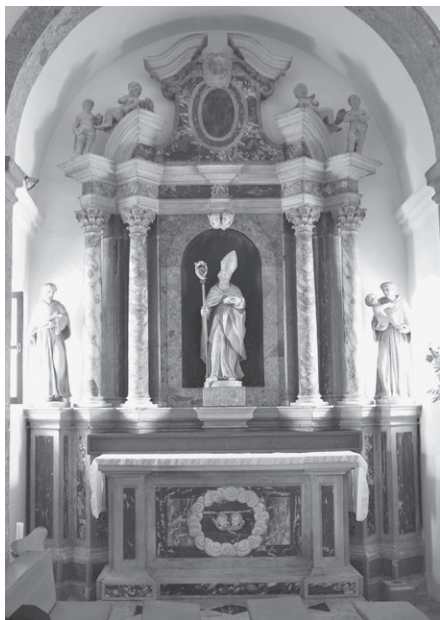
Slika 5: Antonio Michelazzi, oltar svetog Nikole, crkva svete Marije Magdalene, Porat