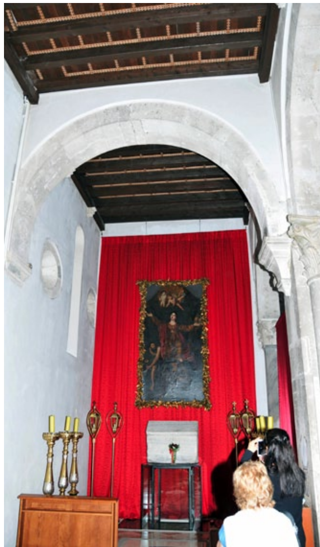
16. Kapela svete Stošije (2016.), Katedrala, Zadar Chapel of St Anastasia (2016), Zadar's cathedral