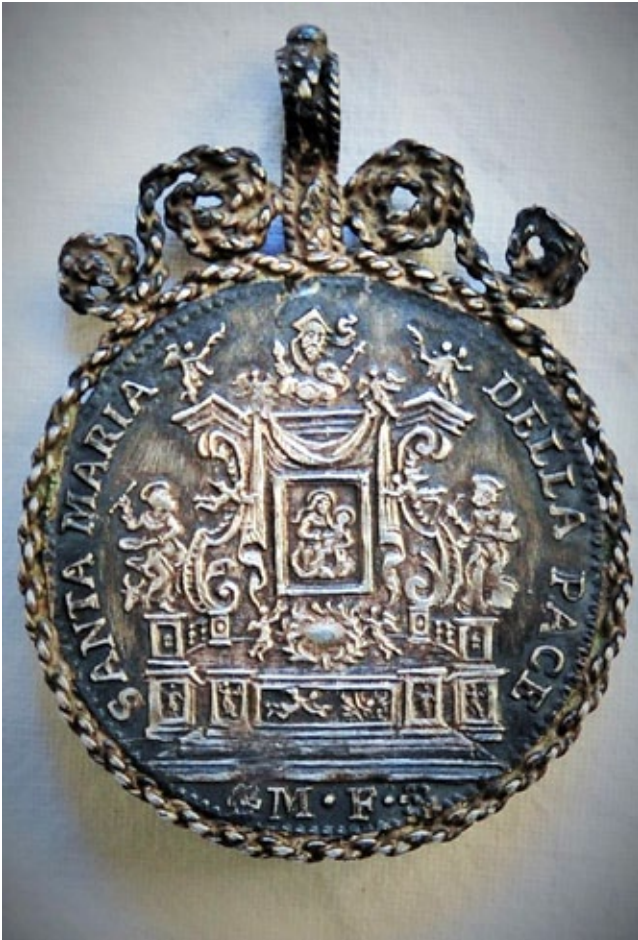
14. Medalja ( osella) dužda Alvisea IV. Moceniga s prikazom oltara iz oratorija Santa Maria della Pace, župna crkva, Plomin Medal (osella) of Doge Alvise IV Mocenigo with a depiction of the altar from the oratory of Santa Maria della Pace, parish church of Plomin