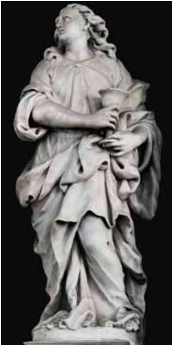
4 Giusto Le Court, Sveti Ivan Evanđelist , crkva Santa Maria della Salute, Venecija

Giusto Le Court , St John the Evangelist, church of Santa Maria della Salute, Venice