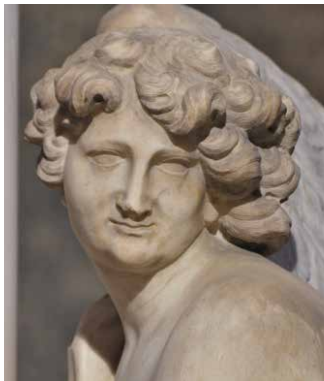
9 Giovanni Comin, Anđeo (detalj), crkva San Nicolò, Treviso Giovanni Comin, Angel (detail), church of San Nicolò, Treviso

godine postavljene njegove skulpture Marsa i Neptuna na ogradu kopnenog ulaza u venecijanski arsenal, zajedno s djelima Enrica Merenga, Francesca Cabianca (Venecija, 1666. – 1737.) i Tommasa Ruesa (Bruneck, 1633. – Venecija, 1703.). 43 U to vrijeme nastaju i spomenuti kipovi za zadarsku crkvu svetog Šimuna. Među posljednjim Cominovim radovima ističe se spomenik papi Benediktu XI. u prezbiteriju crkve San Nicolò u Trevisu iz 1693. godine te kipovi svetog Petra Mučenika i svetog Tome Akvinskoga na glavnom oltaru crkve San Pietro Martire u Udinama. 44 Posljednji je njegov rad oltar u kapeli Monte di Pietà također u Udinama. Djelo je ugovoreno 1694. godine, no kipar je uspio izraditi samo reljefni stipes s prikazom Križnog puta jer ga je smrt iznenadno snašla u naponu stvaralaštva te prije pedesete godine života. 45