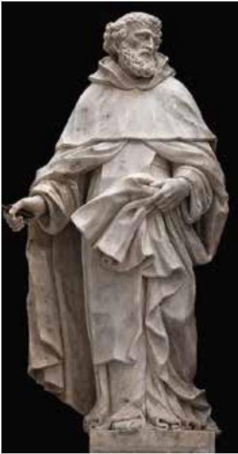
10 Giovanni Comin, Sveti Petar Mučenik , crkva San Pietro Martire, Udine

Giovanni Comin, St Peter the Martyr, church of San Pietro Martire, Udine