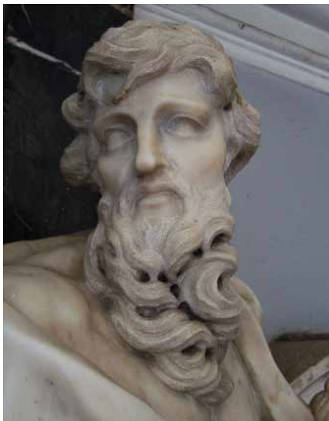
15 Giovanni Comin, Sveti Pavao (detalj), crkva svetog Šime, Zadar Giovanni Comin, St Paul (detail), St Simon's church, Zadar