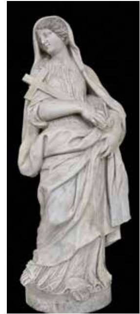
13 Giovanni Comin, Vjera , nekadašnji samostan reda Somaska (Seminario Patriarcale), Venecija

Giovanni Comin, St Thomas Aquinas, church of San Pietro Martire, Udine