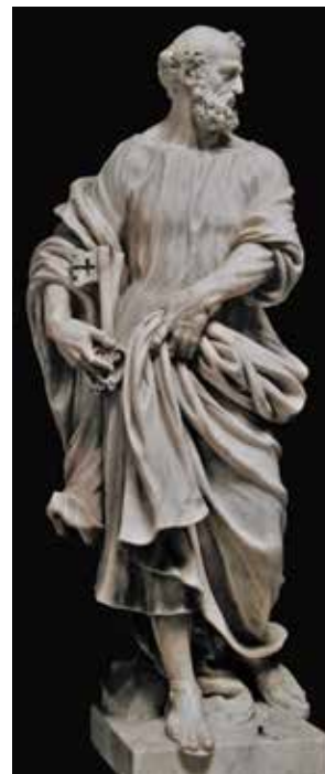
7 Giovanni Comin, Sveti Petar , crkva svetog Šime, Zadar

Giovanni Comin , Angel, church of San Nicolò, Treviso