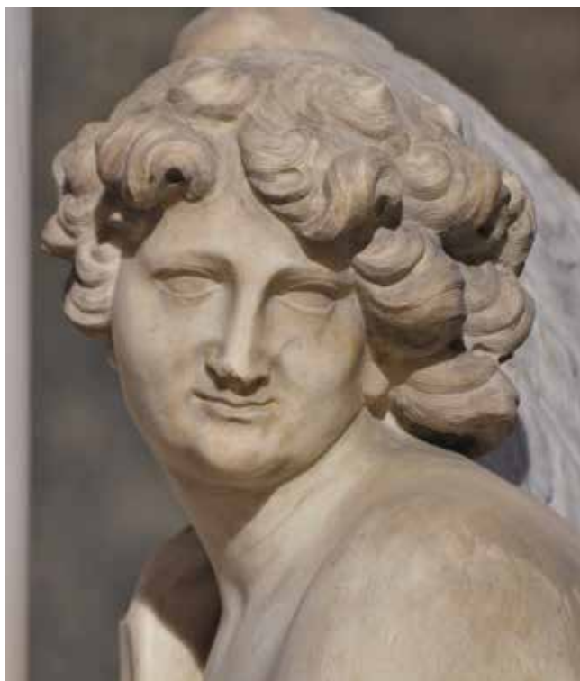
9 Giovanni Comin, Anđeo (detalj), crkva San Nicolò, Treviso Giovanni Comin, Angel (detail), church of San Nicolò, Treviso

godine postavljene njegove skulpture Marsa i Neptuna na ogradu kopnenog ulaza u venecijanski arsenal, zajedno s djelima Enrica Merenga, Francesca Cabianca (Venecija, 1666. – 1737.) i Tommasa Ruesa (Bruneck, 1633. – Venecija, 1703.). 43 U to vrijeme nastaju i spomenuti kipovi za zadarsku crkvu svetog Šimuna. Među posljednjim Cominovim radovima ističe se spomenik papi Benediktu XI. u prezbiteriju crkve San Nicolò u Trevisu iz 1693. godine te kipovi svetog Petra Mučenika i svetog Tome Akvinskoga na glavnom oltaru crkve San Pietro Martire u Udinama. 44 Posljednji je njegov rad oltar u kapeli Monte di Pietà također u Udinama. Djelo je ugovoreno 1694. godine, no kipar je uspio izraditi samo reljefni stipes s prikazom Križnog puta jer ga je smrt iznenadno snašla u naponu stvaralaštva te prije pedesete godine života. 45