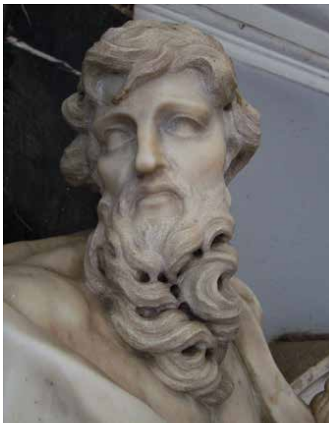
15 Giovanni Comin, Sveti Pavao (detalj), crkva svetog Šime, Zadar Giovanni Comin, St Paul (detail), St Simon's church, Zadar