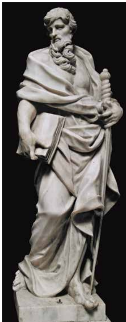
21 Giovanni Comin, Sveti Pavao , crkva svetog Šime, Zadar Giovanni Comin, St Paul, St Simon's church, Zadar

Smatram da možemo vjerovati kako ovdje novim atributivnim prijedlozima okrijepljen opus Giovannija Comina može doprinijeti boljem razumijevanju njegova stvaralaštva. Iako kratkoga životnog vijeka, kipar je ostavio važna djela radeći s najuglednijim majstorima u Veneciji u zadnjoj četvrtini 17.