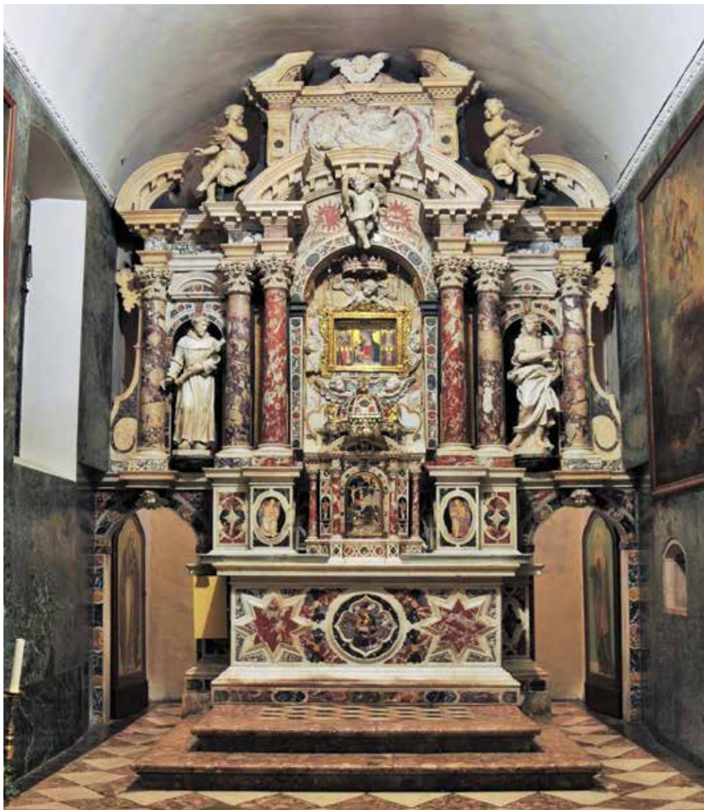
2 Glavni oltar franjevačke crkve na Trsatu Main altar at the Franciscan church in Trsat