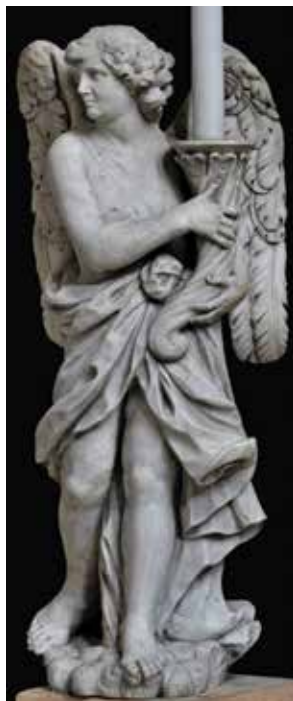
6 Giovanni Comin, Anđeo , crkva San Nicolò, Treviso

Giovanni Comin , St John the Evangelist, Franciscan church in Trsat