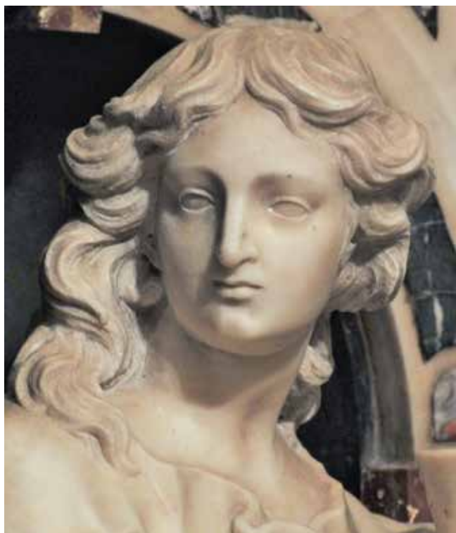
8 Giovanni Comin, Sveti Ivan Evanđelist (detalj), franjevačka crkva na Trsatu Giovanni Comin, St John the Evangelist (detail), Franciscan church in Trsat