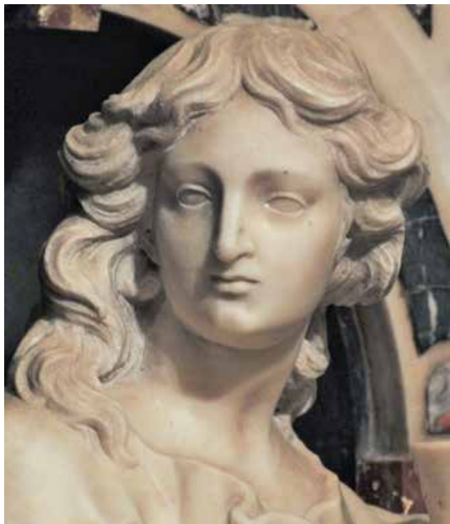
8 Giovanni Comin, Sveti Ivan Evanđelist (detalj), franjevačka crkva na Trsatu Giovanni Comin, St John the Evangelist (detail), Franciscan church in Trsat