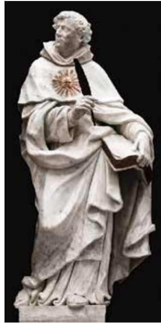
12 Giovanni Comin, Sveti Toma Akvinski , crkva San Pietro Martire, Udine

Giovanni Comin, St Francis of Assisi, Franciscan church in Trsat