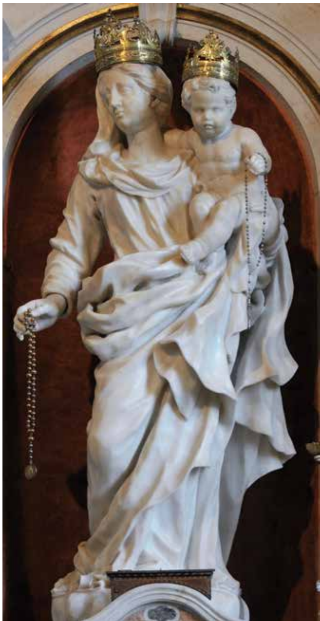
18 Giovanni Comin, Gospa od Ružarija , župna crkva, Mogliano Veneto

Giovanni Comin, Our Lady of the Rosary, parish church, Mogliano Veneto