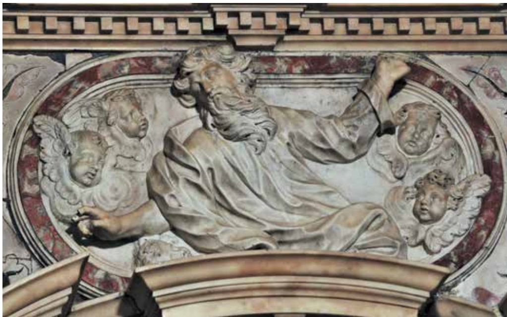
3 Giovanni Comin, Bog Otac s kerubinima , franjevačka crkva na Trsatu Giovanni Comin, God the Father with cherubs, Franciscan church in Trsat