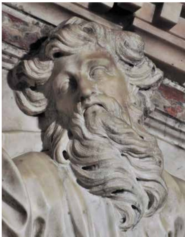
14 Giovanni Comin, Bog Otac s kerubinima (detalj), franjevačka crkva na Trsatu Giovanni Comin, God the Father with cherubs (detail), Franciscan church in Trsat