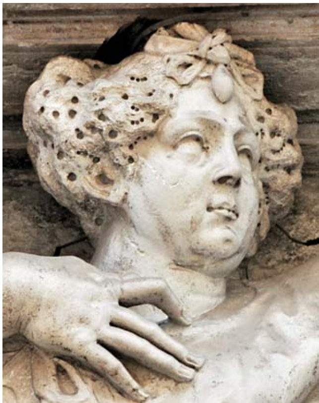
5. Giovanni Bonazza, Sibilla, chiesa di Santa Maria del Giglio, Venezia, dettaglio

Giovanni Bonazza, Sybil, Santa Maria del Giglio, Venice, detail