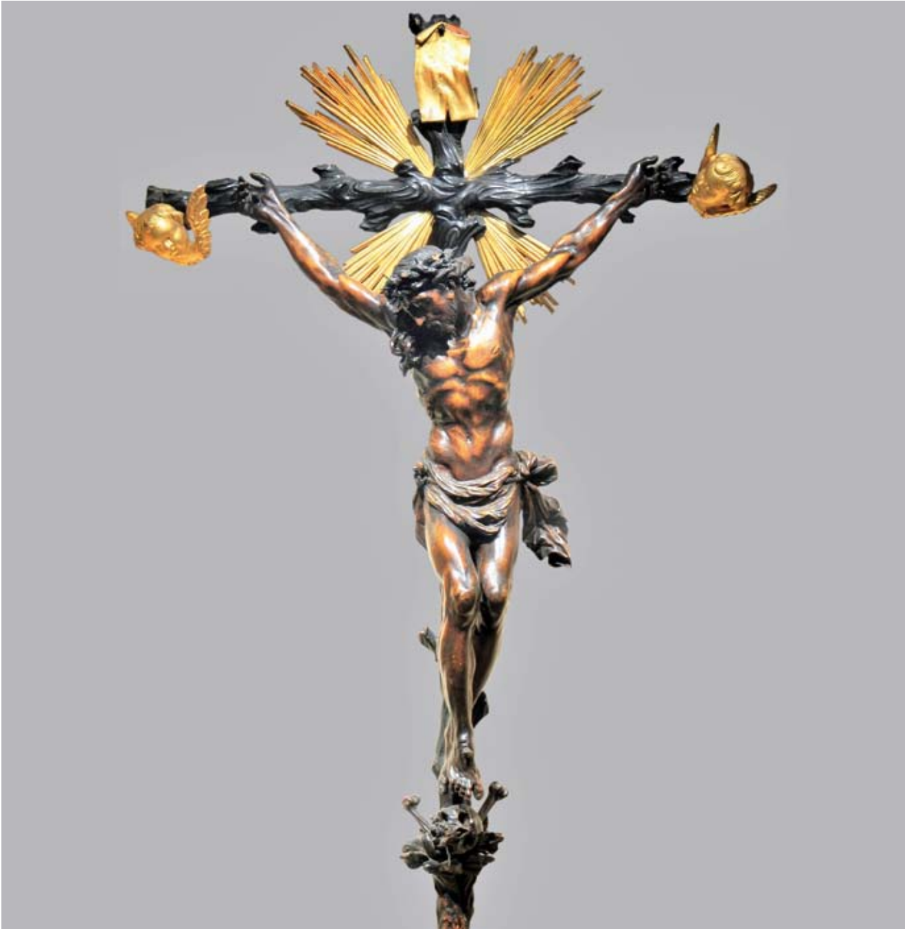
11. Giovanni Bonazza, Crocifisso , chiesa di Sant'Andrea, Padova Giovanni Bonazza, Crucifix, Sant'Andrea, Padua

Giovanni Bonazza, al pari di molti altri scultori veneziani del Sei e Settecento, realizzava opere sia marmoree che lignee. Il suo ristretto catalogo di opere lignee conservate comprende ben tre Crocifissi . Il più antico cronologicamente è quello realizzato nel 1715 per la Confraternita