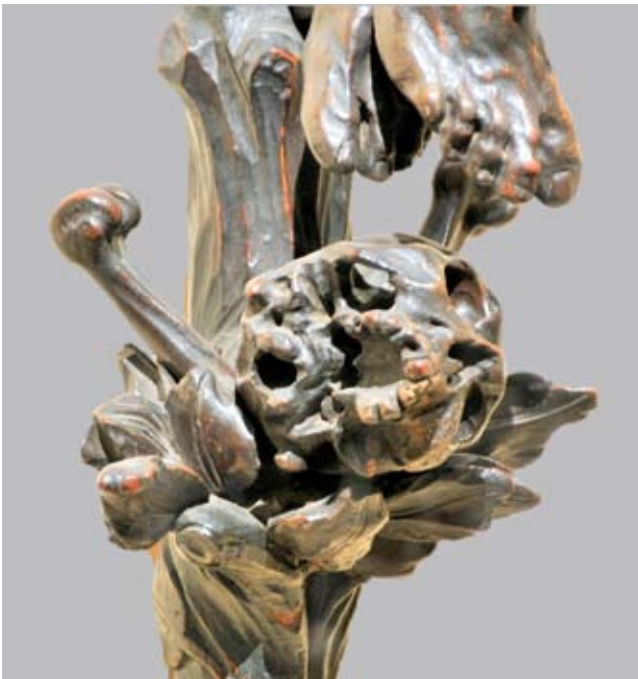
15. Giovanni Bonazza, Crocifisso , chiesa di Sant'Andrea, Padova, dettaglio

Giovanni Bonazza, Christ wearing the crown of thorns, The Barber Institute of Fine Arts, Birmingham