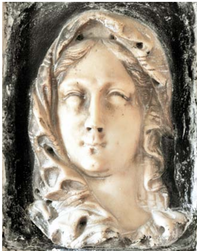
6. Giovanni Bonazza, Volto della Vergine , chiesa di Santa Maria dei Derelitti, canonica, Venezia

Giovanni Bonazza, Sybil, Santa Maria del Giglio, Venice, detail