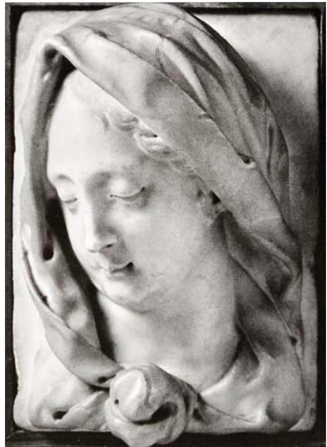
10. Giovanni Bonazza, Volto della Vergine , collezione privata

Giovanni Bonazza, Virgin and Child, Ponte Trevisan, Venice, detail