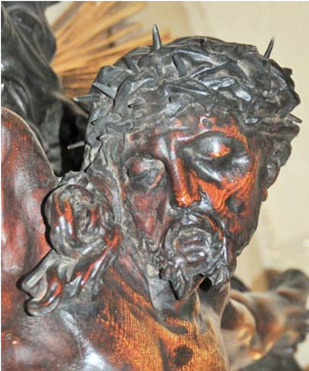
13. Giovanni Bonazza, Crocifisso , chiesa di Sant'Andrea, Padova, dettaglio (fotografia: D. Tulić)

Giovanni Bonazza, Crucifix, Sant'Andrea, Padua, detail