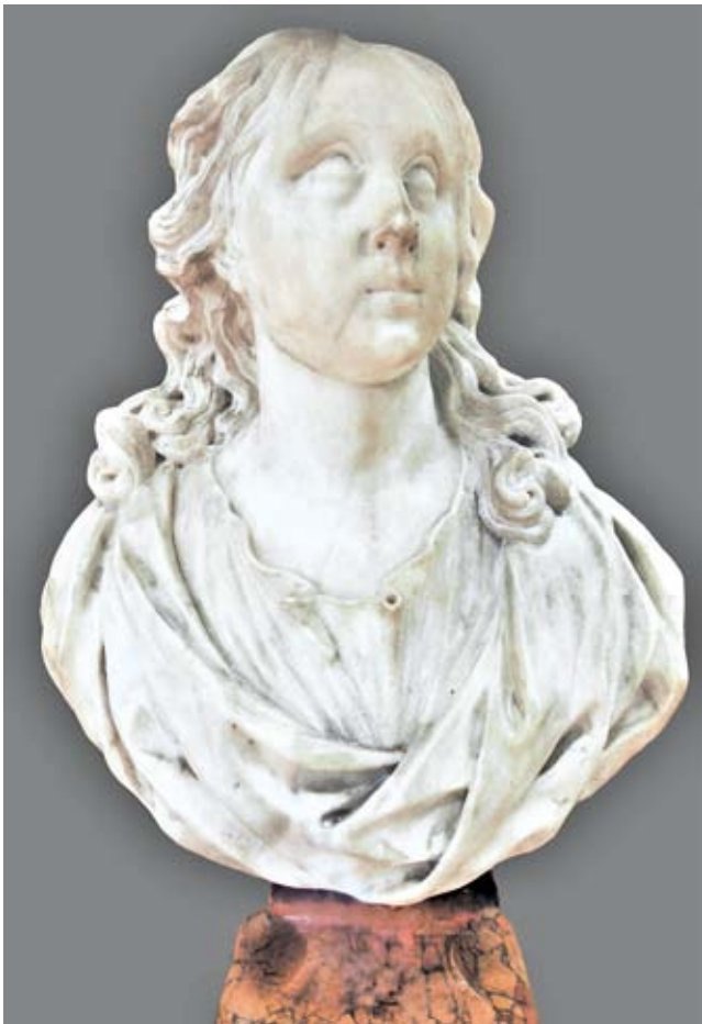
18. Giovanni Bonazza, San Giovanni Evangelista , Biblioteca, San Lazzaro degli Armeni, Venezia Giovanni Bonazza, Bust of St John, Library of San Lazzaro degli Armeni, Venice

numero di nuvole intagliate con estrema abilità che fanno da cornice alla porzione centrale di forma ovale in cui è raffigurata la Colomba dello Spirito Santo, che attualmente presenta purtroppo una forte ridipintura. Tra le nubi lignee spiccano cinque magnifici cherubini e un putto volante a sinistra, privo però del suo pendant di destra. L'altare intitolato alle Anime del Purgatorio venne fatto erigere dalla famiglia dei nobili Giustachini che iniziarono il rinnovo della cappella nel 1688. A sinistra dell'entrata alla cappella si trova il monumento con il medaglione in cui è ritratto il conte Ludovico Giustachini a cui si deve l'inizio dei lavori per il nuovo altare, mentre a destra è collocato il medaglione con il ritratto di Giovanni Giustachini risalente al 1702. Il monumentale altare con la pala attornata da nuvole con angeli e cherubini e fiancheggiata da due sculture raffiguranti San Girolamo e Santa Maria Maddalena , considerato opera di Filippo Parodi (Genova 1630 - 1702), e in seguito di Giovanni Comin (Treviso 1647 circa - Ve-