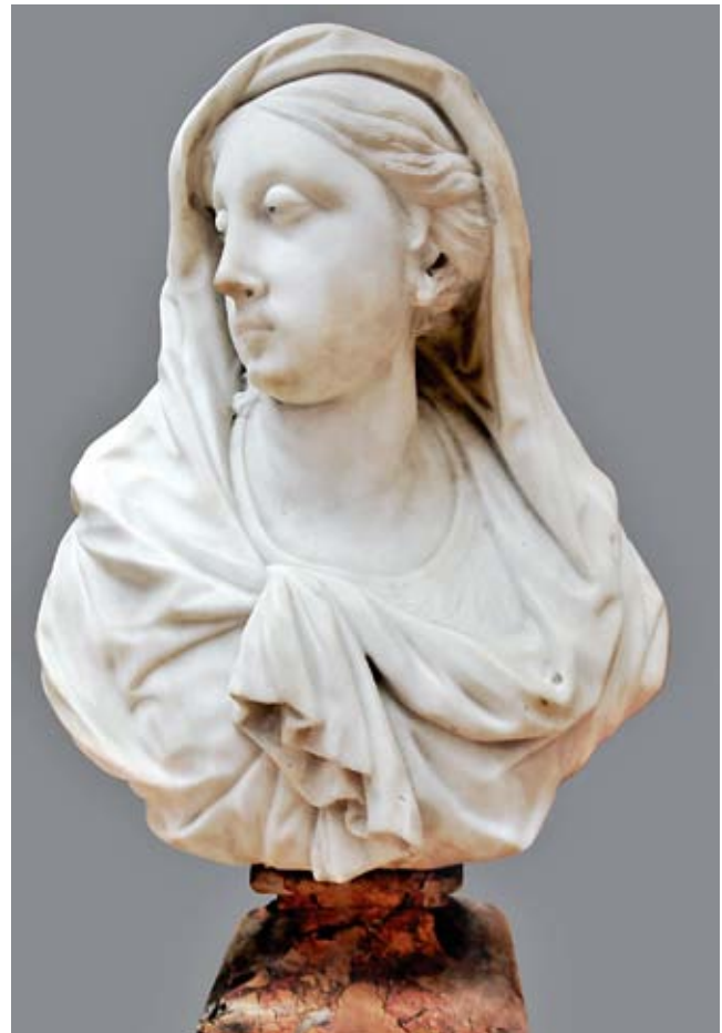
19. Giovanni Bonazza, Vergine , Biblioteca, San Lazzaro degli Armeni, Venezia Giovanni Bonazza, Bust of Virgin, Library of San Lazzaro degli Armeni, Venice