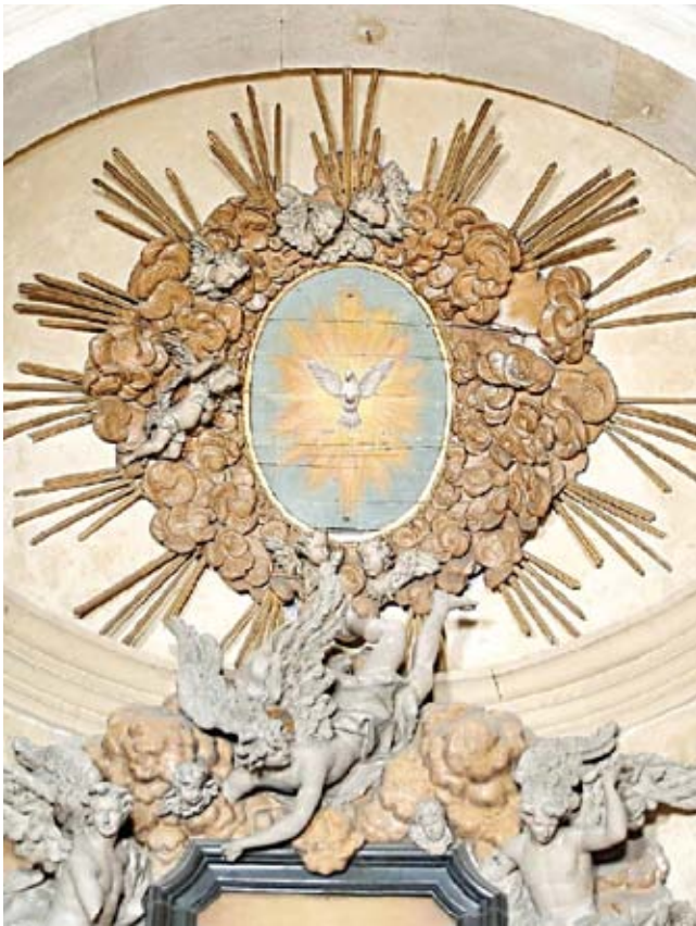
16. Giovanni Bonazza, Gloria dello Spirito Santo, chiesa di Santa Maria del Carmine, Padova

Giovanni Bonazza, Glory of the Holy Spirit, church of Santa Maria del Carmine, Padua