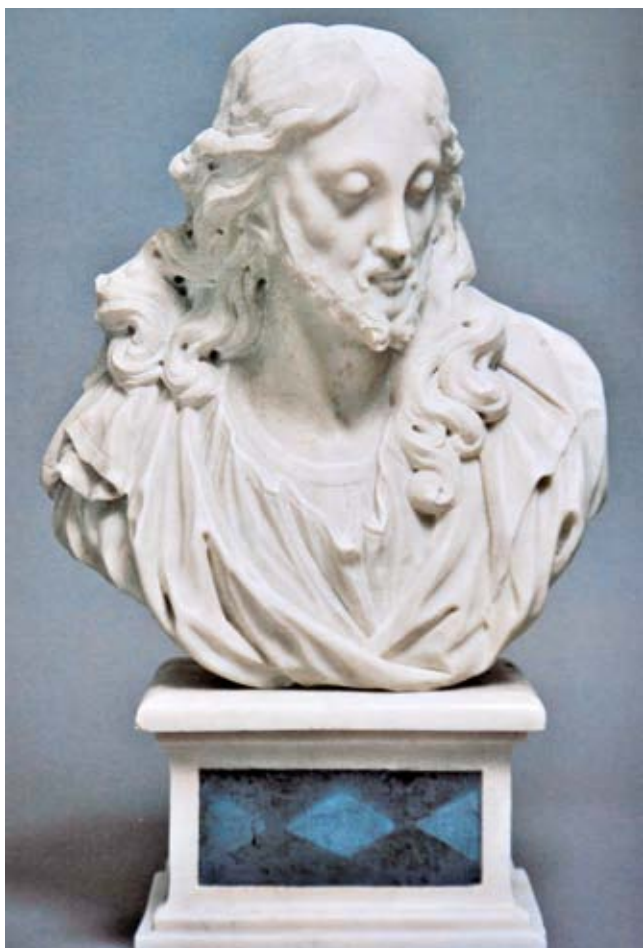
20. Giovanni Bonazza, Cristo , Castello Thun, Ton, Trentino-Alto Adige (referenza fotografica: Arte e potere dinastico /nota 35/, 154)

nezia 1695), è stato ultimamente inserito come pregevole opera nel catalogo di Paul Strudel (Denno 1648 - Vienna 1708). 32 Nonostante questo recente interesse per il manufatto la gloria non viene analizzata negli studi a riguardo. La tipologia e soprattutto la qualità dell'intaglio dei cherubini e del putto volante rimandano alle opere marmoree di Giovanni Bonazza (fig. 17). L'esempio più prossimo sono i cherubini sull'altare di Sant'Antonio risalente al 1708 nel duomo di Montagnana e quelli coevi dell'altare dell'Addolorata nella chiesa patavina dei Servi. Proprio in quest'ultimo edificio sacro Giovanni ha realizzato una piccola gloria lignea dorata con il simbolo di Dio Padre circondato da quattro piccoli cherubini. Per quanto riguarda il putto volante della chiesa dei Carmini esso trova il suo corrispondente in marmo nel putto che regge il baldacchino sopra la statua di Sant'Antonio a Montagnana o in quello molto simile ai Servi di Padova. Siccome all'inizio del XVIII secolo la cappella non era ancora stata terminata, è lecito ipotizzare che la gloria sia stata realizzata poco dopo