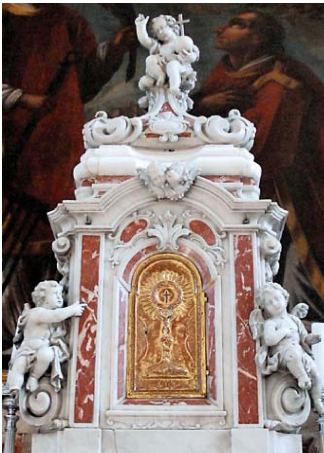
23. Antonio Bonazza, tabernacolo, chiesa parrocchiale, Calle/Kali, isola di Ugliano/Ugljan