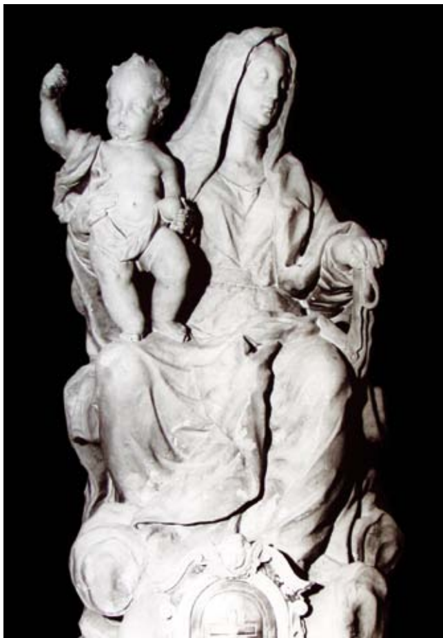
3. Giovanni Bonazza, Madonna della Cintola , chiesa parrocchiale, Gardigiano

Giovanni Bonazza, Our Lady of the Girdle, the parish church at Gardigiano