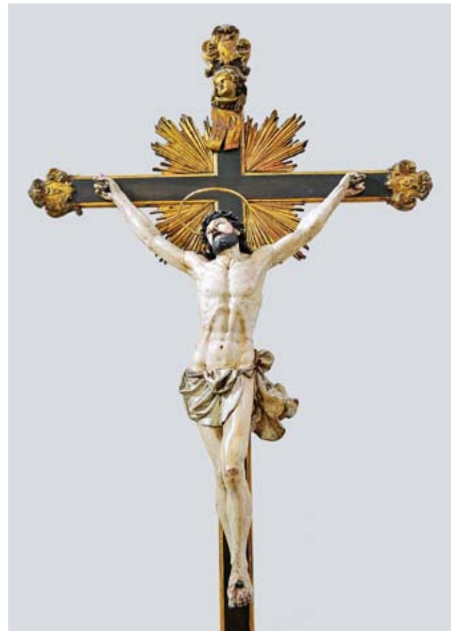
22. Antonio Bonazza, Crocifisso , chiesa di San Michele, Curzola/Korčula

Antonio Bonazza, Crucifix, church of St. Michael, Korčula