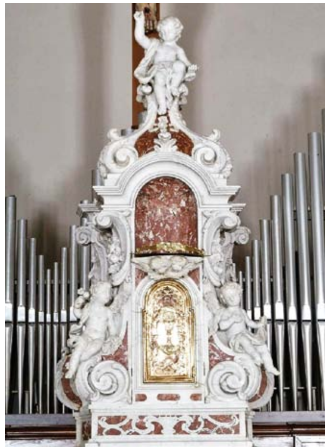
24. Antonio Bonazza, tabernacolo , chiesa parrocchiale, Carrara San Giorgio

Antonio Bonazza, tabernacle in the parish church at Kali, island of Ugljan