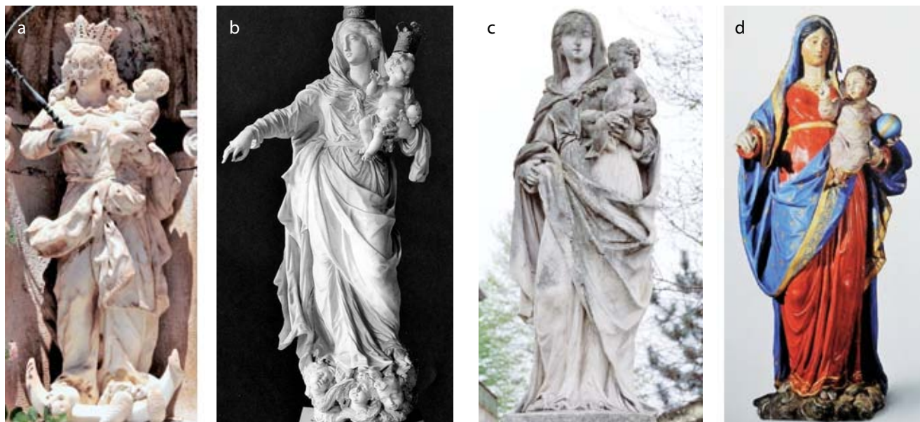
7. a) Giovanni Bonazza, Madonna con il Bambino , Comisa/Komiža, isola di Lissa/Vis (fotografia: D. Tulić); b) Giovanni Bonazza, Madonna con il Bambino , Villa Pisani, Strà (referenza fotografica: Fototeca dell'Istituto di Storia dell'Arte, Fondazione Giorgio Cini, Venezia); c) Giovanni Bonazza, Madonna con il Bambino , Parrocchia di Cona (referenza fotografica: Diocesi di Padova, Ufficio beni culturali); d) Giovanni Bonazza, Madonna con il Bambino , cattedrale, Montagnana (fotografia: D. Tulić)

Giovanni Bonazza, Virgin and Child , Komiža, island of Vis (a); Giovanni Bonazza, Virgin and Child , Villa Pisani, Strà (b); Giovanni Bonazza, Virgin and Child , parish of Cona (c); Giovanni Bonazza, Virgin and Child , cathedral of Montagnana (d)