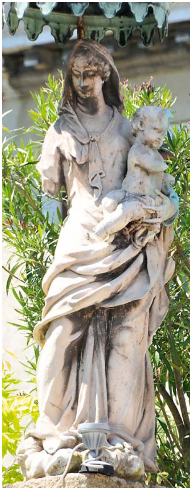
8. Giovanni Bonazza, Madonna con il Bambino, Ponte Trevisan, Venezia

Nel catalogo di Giovanni Bonazza il personaggio della Madonna è molto frequente, sia che si tratti di sculture a figura intera, di busti o di rilievi con il suo volto (fig. 7). Nella serie di opere raffiguranti la Vergine va certamente inclusa anche la bella scultura della Ma-