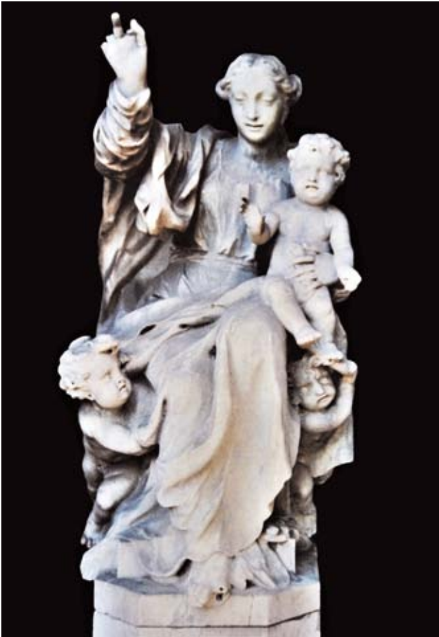
1. Michele Fabris detto l'Ongaro, Madonna del Rosario , Isola di San Servolo, Venezia

Michele Fabris known as l'Ongaro, Our Lady of the Rosary, San Servolo, Venice