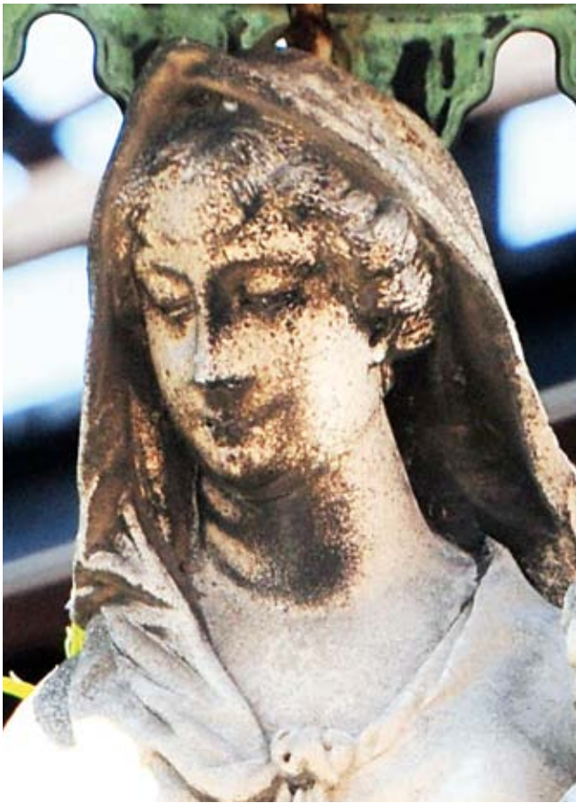
9. Giovanni Bonazza, Madonna con il Bambino , Ponte Trevisan, Venezia, dettaglio

Giovanni Bonazza, Virgin and Child, Ponte Trevisan, Venice, detail