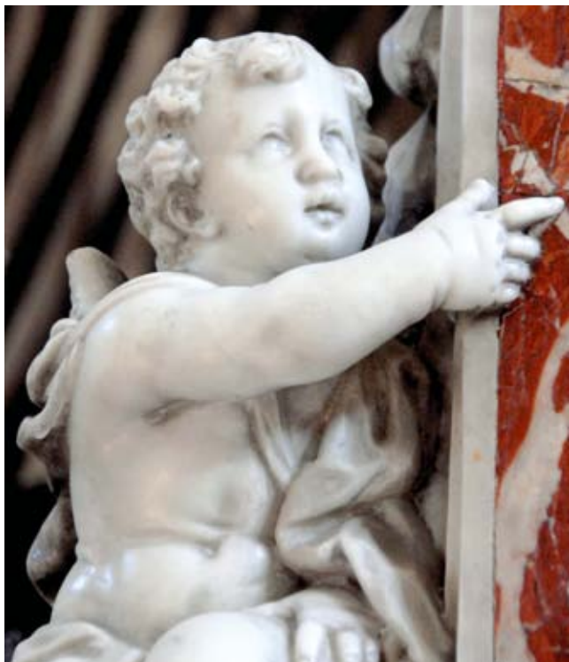
25. Antonio Bonazza, tabernacolo , chiesa parrocchiale, Calle/Kali, isola di Ugliano/Ugljan, dettaglio

Antonio Bonazza, tabernacle in the parish church at Kali, island of Ugljan, detail