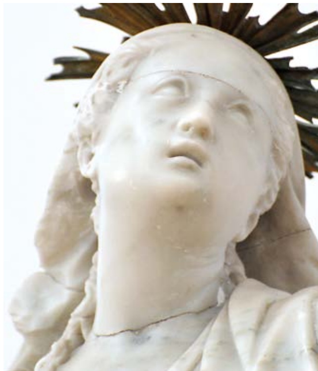
26. Antonio Bonazza, Assunzione della Vergine , cattedrale, Padova, dettaglio

scultura lignea raffigurante l' Immacolata Concezione della parrocchiale di Terradura o quella di Sant'Anna che si trova nella chiesa parrocchiale di Carrara San Giorgio. Il Crocifisso di Curzola non è però l'unica opera dalmata di Antonio Bonazza. Infatti nel suo catalogo va inserito anche il tabernacolo marmoreo ornato di putti e cherubini con il Bambino sulla sommità, che si trova sull'altare maggiore della chiesa parrocchiale di San Lorenzo in località Calle (Kali) sull'isola di Ugliano (Ugljan) (fig. 23, 24). Il manufatto è realizzato in marmo di Carrara con inserti in marmo rosso Francia. Al di sopra di un semplice basamento rettangolare si innalza il tabernacolo a prospetto con al centro la portella centinata fiancheggiata da due stipiti scorciati, in modo da ottenere un effetto di profondità, e decorati con elementi in marmo rosso. L'arco sopra la portella presenta una decorazione a palmetta con ai lati due singolari cartouche ornati da viticci e con la specchiatura in marmo rosso. Sui lati esterni si trovano due elementi pure in marmo rosso a forma di pilastro che però non presentano né basamento né capitello, al di sopra la cimasa ad arco con due cherubini dall'espressione vivace al centro. Ai fianchi del tabernacolo sulle volute che decorano tutta la parte laterale siedono due putti di eccezionale fattura. Quello di sinistra con la