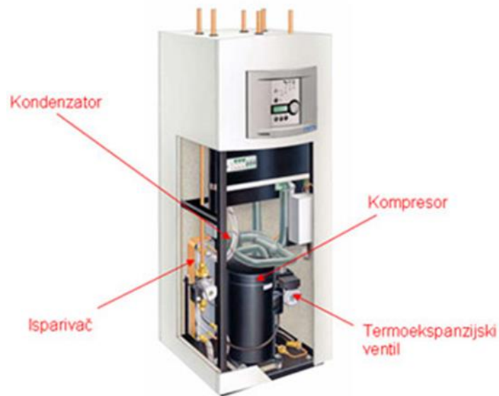
Slika 2. Osnovni dijelovi dizalice topline