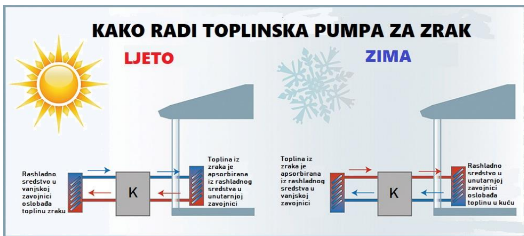
Slika 4. Princip rada toplinske pumpe za zrak