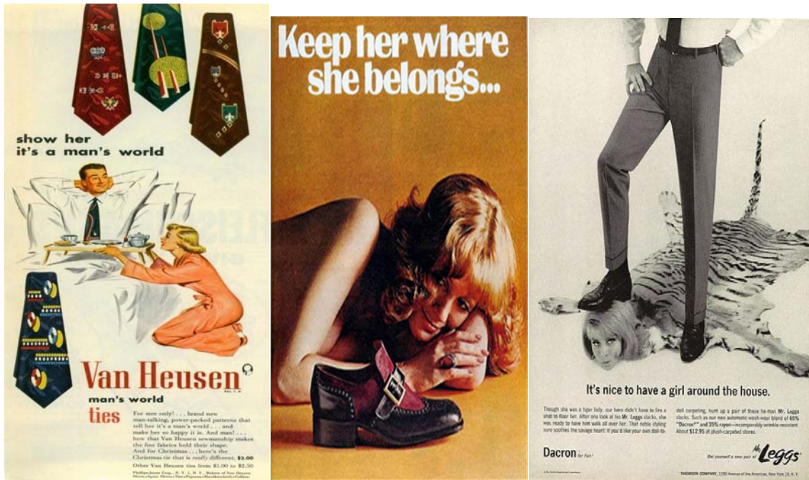
Slike 10., 11., 12. Reklame koje šalju subliminalnu poruku muške dominacije te moći