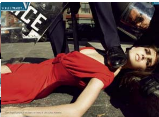
Slika 14. Valentino reklama

Obje reklame jasno simboliziraju rodne stereotipe koji žene predstavljaju kao submisivne nasuprot neosporivoj moći muškaraca. Na prvoj reklamni za proljetnu kolekciju Dolce & Gabbana iz 2007. godine vidimo ženu koju muškarac drži na tlu pritišćući je za zglobove. Okružena je s još 3 muškarca zapadnjačkog izgleda koji na konotacijskoj razini simboliziraju uspješnost, dominaciju i moć. Submisivan položaj žene na tlu te činjenica da muškarci stoje iznad nje, dok ju jedan drži "zarobljenom" na tlu jasno simboliziraju nadmoć i kontrolu koju oni ostvaruju nad njom. Žena se ne opire, pasivna je, što označava da podliježe, odnosno da se pokorava moći muškaraca te da je nemoćna, a to ilustrira i njezin pogled, kao i sam izraz lica. Naglasak na njenim golim nogama, štiklama, provokativnoj odjeći te naglašenim crvenim usnama, kao i sam tjelesni položaj, čine praksu seksualne objektivizacije, čime se žena pretvara u seksualni objekt koji udovoljava muškom pogledu. Reklama je kritizirana i optuživana da prikazuje čin silovanja, što je direktor branda Stefano Gabanna demantirao tvrdeći kako reklama predstavlja erotski san, seksualnu igru.