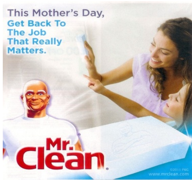
Slika 9. Reklama za Mr.Clean

U ovom kontekstu htjela bih analizirati reklamu iz 2011. godine za Mr. Clean: