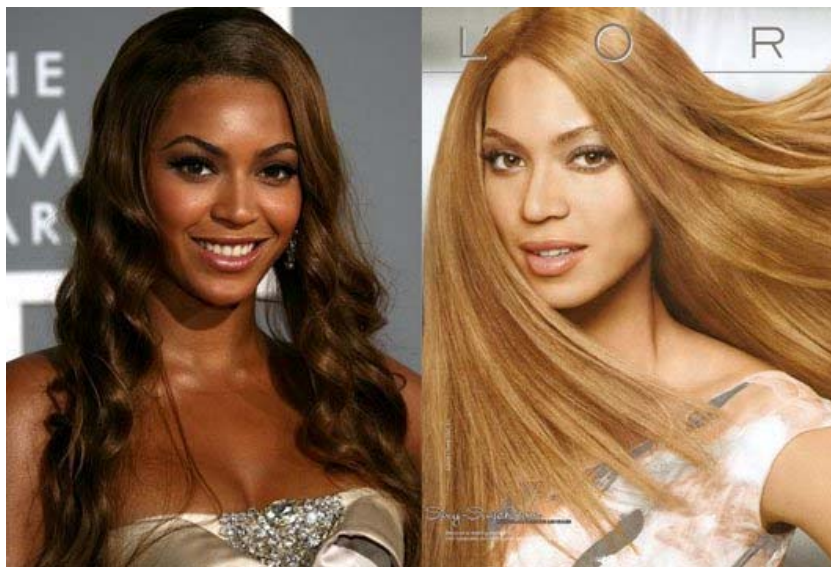
Slika 3. Usporedba: Beyonce u realnosti (lijevo) i na L'Oréal reklami (desno)

Ravna kosa i bijela koža su poželjne, dok su etnička obilježja nepoželjna. Osim toga, praksa izbjeljivanja kože nije novijeg datuma, već seže u 1890e godine kada su na tržište izašle prve kreme za izbjeljivanje kože poput " Black No More " ili " Cocotone Skin Withener ". Danas, samo u Indiji tržište izbjeljivačkih krema vrijedi gotovo 500 milijuna dolara godišnje, dok su Jamajčanke otišle toliko daleko da je vlada pokrenula kampanju " Don't Kill The Skin ", koja je apelirala da se prestanu koristiti opasne kreme za izbjeljivanje koje mogu inducirati rak zbog svojih opasnih sastojaka poput hidrokinona (Arogundade, n.d).