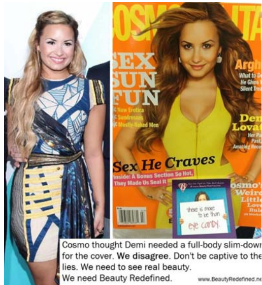
Slika 4. Demi Lovato u realnosti (lijevo) i na naslovnici Cosmopolitan časopisa (desno)

poznata osoba koja reklamira proizvod, ne znajući, kako ni ona u realnom svijetu ne izgleda kao na reklamama. Otvorimo li ženski časopis, reklama poput ove je prvo što ćemo vidjeti. No, izuzev reklama i sami sadržaj ženskih časopisa je također ideološki nastrojen i teži promoviranju mita o ljepoti. S jedne strane časopisi hrabre žene člancima poput "Volite svoje tijelo" dok već na idućoj stranici stoji dijeta "Skinite 5 kilograma u tjedan dana" ili "Vježbe za tijelo od milijun dolara". Glavni cilj je svidjeti se muškarcima, a čitajući, primjerice, Cosmopolitan znati ćete kako. Činjenica da je Cosmopolitan najčitaniji internacionalni ženski časopis, da je postao brand i da se u svijetu koriste izrazi poput cosmo djevojka govori o nesvijesti djevojaka i žena diljem svijeta. Mit naturalizira, predstavlja se kao prirodan i normalan. Golotinja, seksualizacija te objektivizacija žena toliko je česta da je postala normalna. Došlo je do tog stupnja, da žene gledaju same sebe kao objekt. Ako ne izgledaju kao djevojka s naslovnice Cosmopolitana ili nekog drugog časopisa, tada izgledaju pogrešno, ne znajući da niti sama djevojka s naslovnice ne izgleda kao što je prikazana. Cosmopolitan , prenoseći tešku životnu priču pjevačice Demi Lovato koja se cijeli život bori s poremećajima u prehrani, naročito bulimijom o kojoj su pisali u članku i pomaže djevojkama diljem svijeta u borbi s istom, ipak retušira sliku pjevačice kako bi izgledala mršavije: