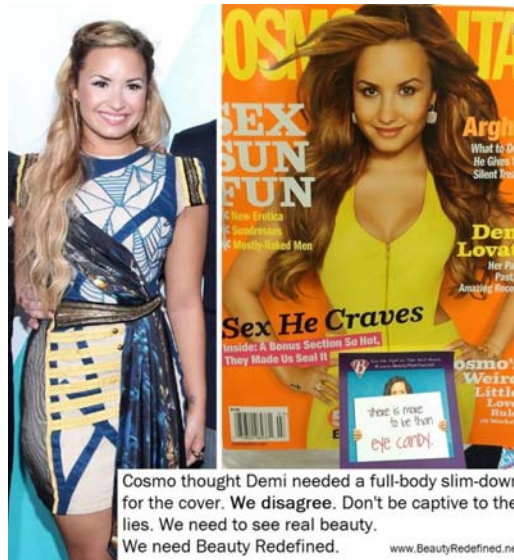
Slika 4. Demi Lovato u realnosti (lijevo) i na naslovnici Cosmopolitan časopisa (desno)

poznata osoba koja reklamira proizvod, ne znajući, kako ni ona u realnom svijetu ne izgleda kao na reklamama. Otvorimo li ženski časopis, reklama poput ove je prvo što ćemo vidjeti. No, izuzev reklama i sami sadržaj ženskih časopisa je također ideološki nastrojen i teži promoviranju mita o ljepoti. S jedne strane časopisi hrabre žene člancima poput "Volite svoje tijelo" dok već na idućoj stranici stoji dijeta "Skinite 5 kilograma u tjedan dana" ili "Vježbe za tijelo od milijun dolara". Glavni cilj je svidjeti se muškarcima, a čitajući, primjerice, Cosmopolitan znati ćete kako. Činjenica da je Cosmopolitan najčitaniji internacionalni ženski časopis, da je postao brand i da se u svijetu koriste izrazi poput cosmo djevojka govori o nesvijesti djevojaka i žena diljem svijeta. Mit naturalizira, predstavlja se kao prirodan i normalan. Golotinja, seksualizacija te objektivizacija žena toliko je česta da je postala normalna. Došlo je do tog stupnja, da žene gledaju same sebe kao objekt. Ako ne izgledaju kao djevojka s naslovnice Cosmopolitana ili nekog drugog časopisa, tada izgledaju pogrešno, ne znajući da niti sama djevojka s naslovnice ne izgleda kao što je prikazana. Cosmopolitan , prenoseći tešku životnu priču pjevačice Demi Lovato koja se cijeli život bori s poremećajima u prehrani, naročito bulimijom o kojoj su pisali u članku i pomaže djevojkama diljem svijeta u borbi s istom, ipak retušira sliku pjevačice kako bi izgledala mršavije: