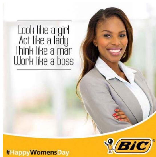
Slika 8. BiC reklama za Bic For Her kemijske olovke

Na reklami se očituje nasmijana poslovna žena (da se radi o poslovnoj ženi možemo zaključiti i po njenoj odjeći, koja je samo ženska verzija muške poslovne odjeće). Na slici pored žene nalazi se tekst: izgledaj kao djevojka, ponašaj se kao dama, razmišljaj kao muškarac, radi kao šef.