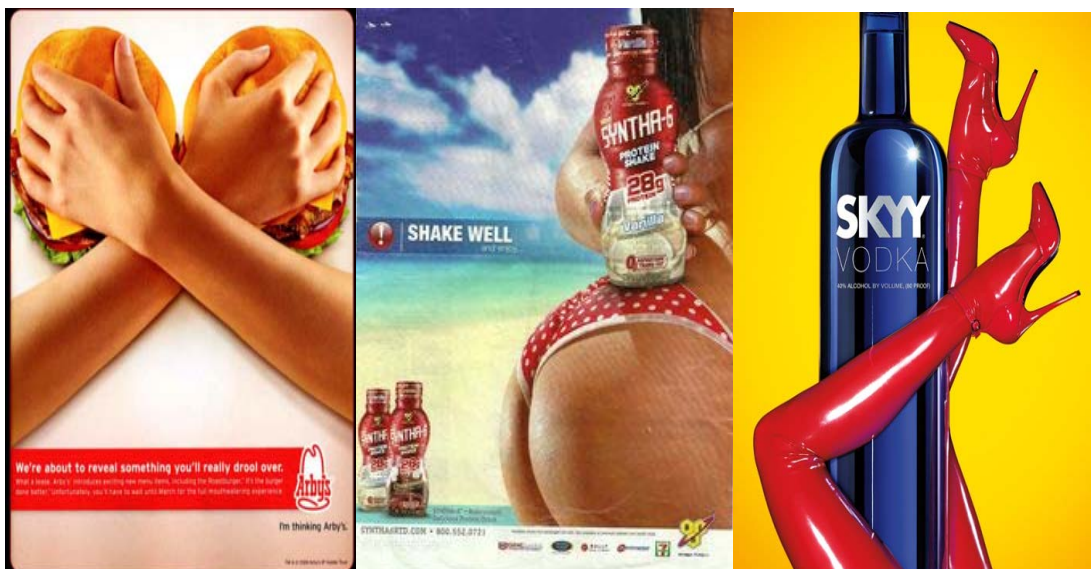
Slike 21., 22., 23. Seksualizirani dijelovi ženskog tijela u reklamama

Također, često s koriste samo pojedini seksualizirani dijelovi ženskog tijela, poput grudi, stražnjice te nogu: