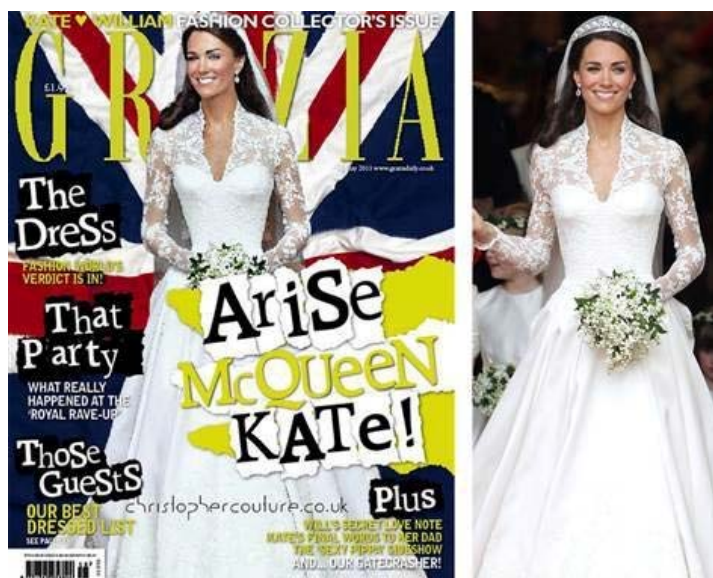
Slika 5. Kate Middletone u realnosti (desno) i na naslovnici Grazia časopisa (lijevo)

"punije" djevojke da bi izgledale mršavije; retuširaju se već izuzetno mršave djevojke da bi izgledale još mršavije, kao što je to primjerice naslovnica vojvotkinje Kate Middletone na dan vjenčanja. Retuširanje Kate Middleton nije imalo za cilj stvoriti vizualno mršaviju Kate Middletone, već je za cilj imalo stvoriti mršaviji tjelesni ideal u umovima djevojaka i žena diljem svijeta koje su čitale i gledale naslovnicu britanskog magazina Grazia :