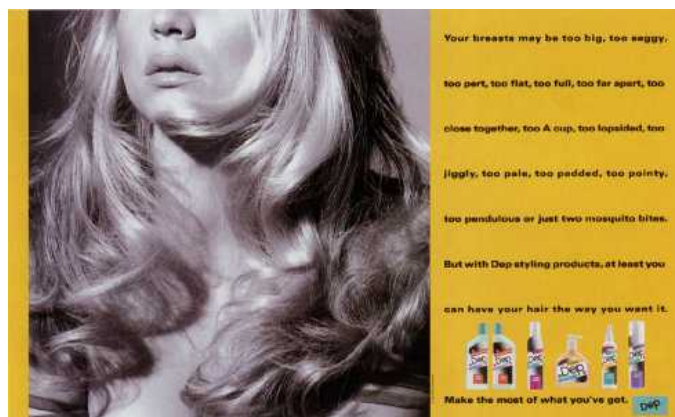
Slika 6. Reklama za Dep Hair proizvode

Na reklami se nalazi slika na kojoj vidimo polovicu lica djevojke s plavom bojom kose koja se smatra idealom. Reklama je za Dep proizvode za kosu no tekst na reklami naglašava nešto sasvim drugo: