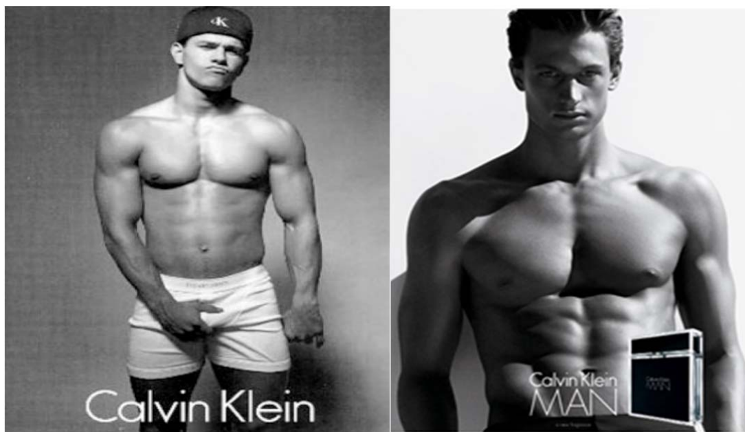
Slike 24. i 25. Prilikom seksualne objektivizacije muškaraca i dalje se prenosi subliminalna poruka moći i dominacije

Muškarac se na prvoj reklami drži za međunožje naglašavajući svoju muškost, a prodornim pogledom upućenim direktno u kameru. Mogli bismo reći kako se na taj način suprotstavlja i odupire vlastitoj objektivizaciji, naglašavajući ono što ga čini superiornim i dominantnim, to jest referirajući se na svoj spol. Na drugoj reklami naglasak je na muškarčev gornji dio tijela, dok mu je facijalna ekspresija tupa; ne pokazuje nikakvu emociju. Također, pogled je upućen direktno u kameru.