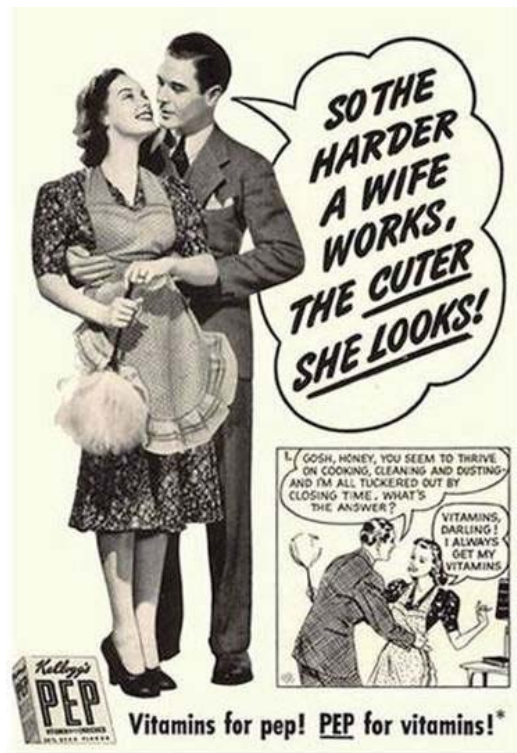
Slika 2. Reklama za Kellogg's PEP pahuljice (1930)