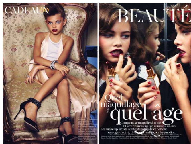
Slika 7. Desetogodišnja Thylane Louby Blondeau za French Vogue

vjerne i u kasnijoj dobi, kada postaju zrelije i osviještenije te kada postoji mogućnost da mu se odupru. Osim toga, govorimo o činjenici da se sve navedeno događa u svijetu rasprostranjenog seksualnog zlostavljanja djece. Ne možemo reći kako ovakve reklame prouzrokuju takav problem, međutim, portretiranje djevojčica na ovaj način svakako normalizira izopačene i opasne stavove prema djeci.