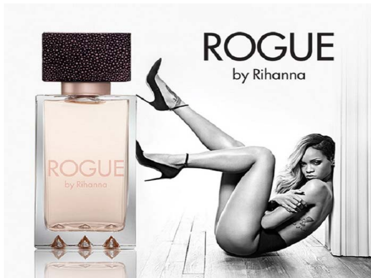
Slike 18., 19., 20. Impliciranje seksualne spremnosti i u reklamiranju neseksualnih proizvoda, kao i proizvoda za žene

Također, često s koriste samo pojedini seksualizirani dijelovi ženskog tijela, poput grudi, stražnjice te nogu: