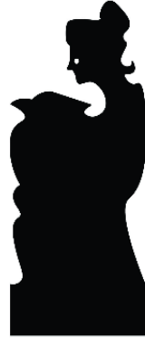
I. B. MAŽURANIĆ