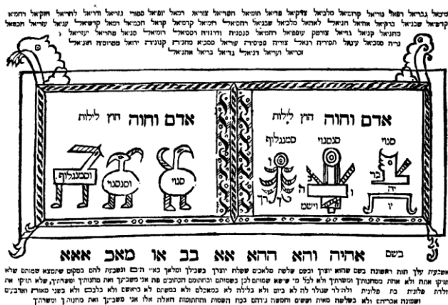
Slika 5: Amulet s tri anđela koji zarobljavaju vješticu Lilit. Amsterdam, 1701.

Ova se verzija mita ubrzo proširila kod svih pripadnika židovske vjere i poprimila brojne varijante. Tako je ona, prema Goldsteinu, uz Samaela ona jedan od dva arhidemona