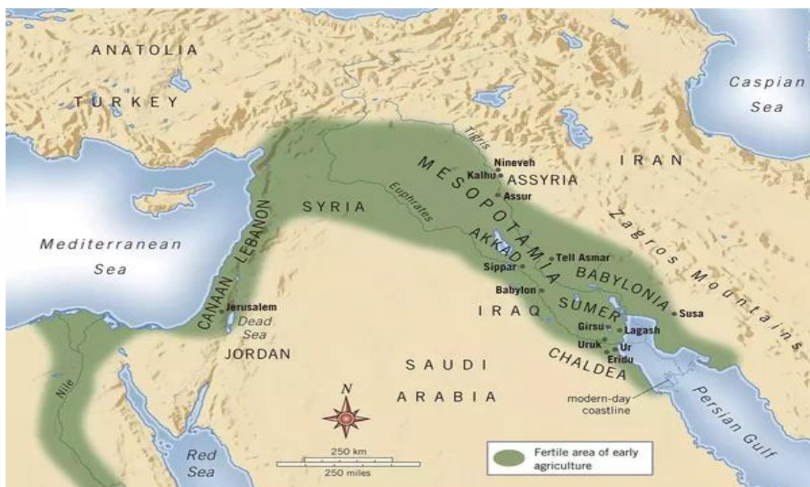
—Slika 1: Mapa civilizacija na Bliskom istoku.

Pojam drevne bliskoistočne civilizacije odnosi se ovdje na sumersku, babilonsku, starohebrejsku i grčku. Dok su se sumerska i babilonska civilizacija smjestile u plodnim dolinama rijeka Eufrat i Tigris, hebrejska je bila u njihovoj neposrednoj blizini, odnosno u Kanaanu. Grčka se civilizacija ne može geografski smjestiti na Bliski istok, no uključena je u ovaj rad zbog svoje snažne povezanosti sa spomenutim civilizacijama, kao što ćemo vidjeti u nastavku rada. Važno je napomenuti i veliku razliku u geografiji ovih regija, koja je donijela različite društvene djelatnosti i zanimanja. Tako je Grčka bila pomorska zemlja