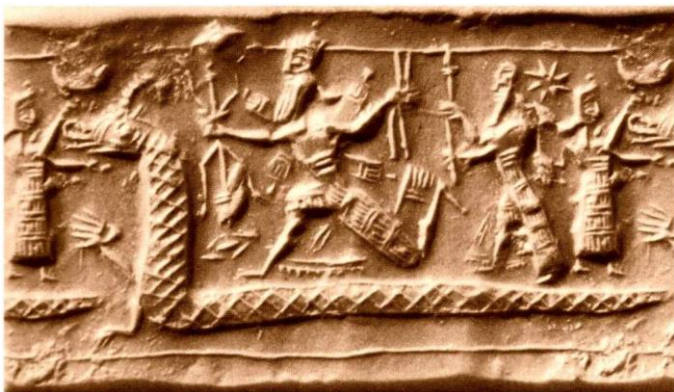
Slika 3: Ubojstvo Tiamat. Asirija, 8. stoljeće p.n.e.

Napomenuto je da su Babilonci svoju mitologiju ponešto izmijenili u odnosu na sumersku, gdje je mit glasio da je Nammu rodila Anua i Ki (nebo i zemlju). Babilonska mitologija pak u samom početku ima određenu dualnost muško-žensko pa tako iz prapočetka kojeg nazivaju Mummu 16 nastaju Apsu, simbol gornjih slatkih voda, i Tiamat, simbol donjih slanih voda, čime su povezani sa brojnim drugim bliskoistočnim mitologijama koje u