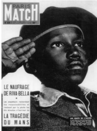
Slika 4. Crni vojnik salutira zastavi (John Storey: 2010: 120)

Najpoznatiji primjer proučavanja dvije razine označavanja je naslovnica francuskog časopisa Paris Matcha na kojoj crni francuski vojnik salutira francuskoj zastavi. Na primjeru naslovnice prva razina predstavlja crnog francuskog vojnika koji salutira francuskoj zastavi, dok druga razina predstavlja pozitivnu sliku francuskog imperijalizma (Storey: 2010: 119).