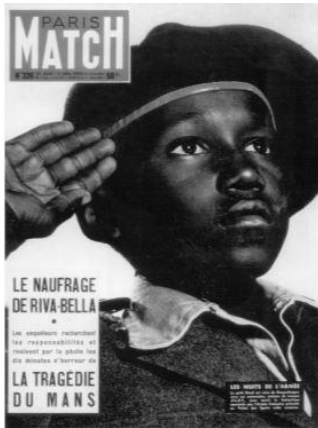
Slika 4. Crni vojnik salutira zastavi (John Storey: 2010: 120)

Najpoznatiji primjer proučavanja dvije razine označavanja je naslovnica francuskog časopisa Paris Matcha na kojoj crni francuski vojnik salutira francuskoj zastavi. Na primjeru naslovnice prva razina predstavlja crnog francuskog vojnika koji salutira francuskoj zastavi, dok druga razina predstavlja pozitivnu sliku francuskog imperijalizma (Storey: 2010: 119).