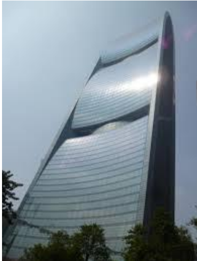
Pearl River Tower u Guangzhouu