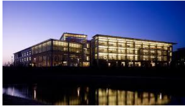
University of California, Kolligian Library u Mercedu