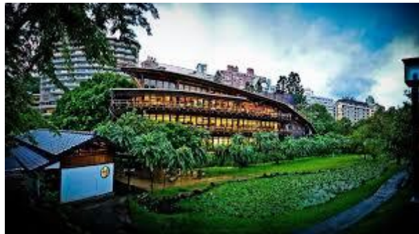
Taipei Public Library's Beitou Branch u Taipeiju