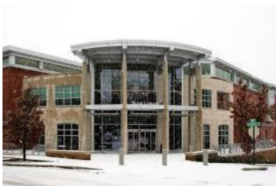
Fayetteville Public Library u Fayettevilleu