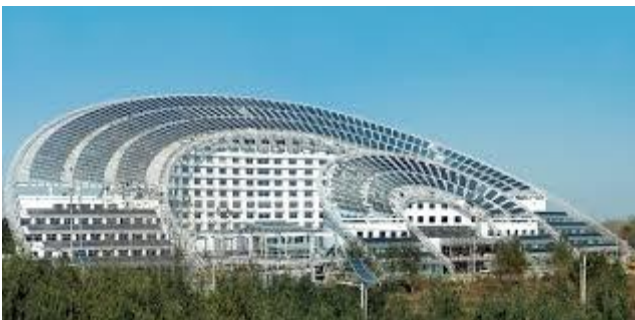
Micro Emission Sun-Moon Mansion u Dezgouu