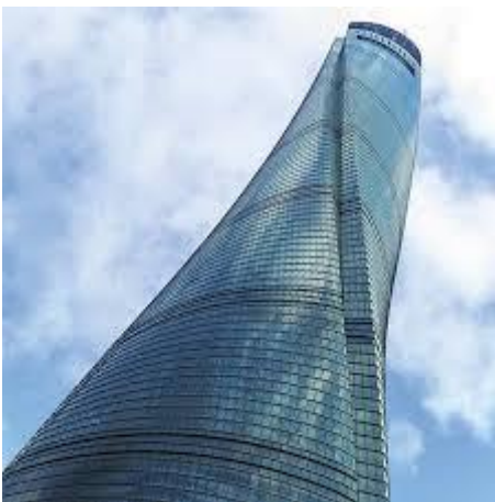
Shangai Tower u Šangaju