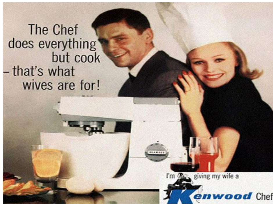
Slika 1. Reklama 1. 3

Ono što se očituje u takvom tipu reklama, svakako su šovinizam i stereotipija. To je najbolje vidljivo u odnosu između muškarca i žene. Riječ je o dva suprotna svijeta – jačem i slabijem. Muškarci su prikazani kao snažniji, zaštitnički spol, dok su žene promatrane kao slabije, podređene i ponižavane jedinice kojima je mjesto u kuhinji. Primjer jedne takve slike društva možemo vidjeti u sljedećoj reklami: