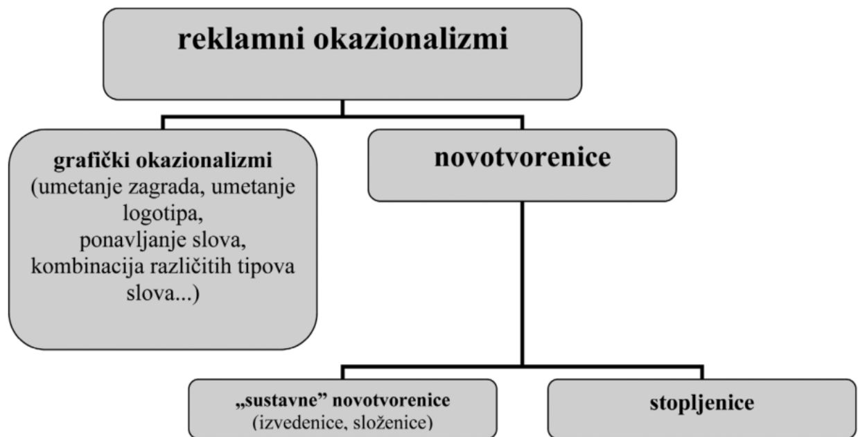
Slika 1. Podjela reklamnih okazionalizama 23

Kroz sljedeća poglavlja donosim prikaz prikupljenih okazionalizama razvrstanih prema tvorbenim načinima. Valja napomenuti da sam se vodila podjelom Lewis i Štebih Golub (2014: 139), koji su svoj korpus reklamnih okazionalizama podijelili na „sustavne“ novotvorenice, „nesustavne“ novotvorenice (stopljenice) i grafičke okazionalizme ovisno o tvorbenim postupcima i njihovoj uobičajenosti.