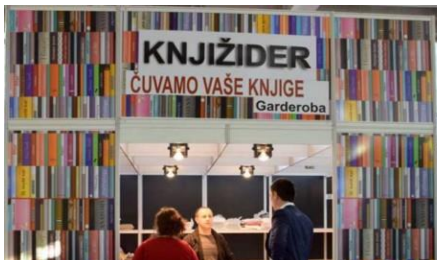
Slika 2. Knjižider – naziv garderobe na sajmu knjiga Interliberu 81