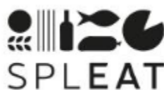
Slika 3. 105

Grafoalijenacijske 98 grafostipljenice nastaju tako da se bilježenjem dijelova domaćih riječi prema stranoj grafiji u njihovom zapisu istiche (kao „interpolirana“) neka strana riječ (najčešće engleska, čiji je glasovni sastav srodan dijelu te domaće riječi. To su dakle svojevrsni grafoneologizmi u kojima se stapaju dulje, domaće i kraće, strane riječi 99 . Nastaju kombinacijom različitih tipova slova ili grafijskih sustava 100 . Toj vrsti okazionalizama pripadaju sljedeće tvorenice na koje sam naišla: Copyraonica 101 ( copy + kopi-raonica – škola digitalnog copywritinga), Beertija 102 ( beer + bir-tija – kafić), SplEat 103 ( Split + eat – splitski gastronomski pokret) i DeBelly 104 ( debeli + belly – restoran).