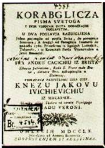
Slika 3 Korabljica iz 1760. godine