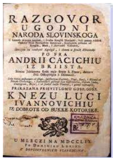
Slika 2 Razgovor ugodni naroda slovinskoga (1756. - 1759. godine)