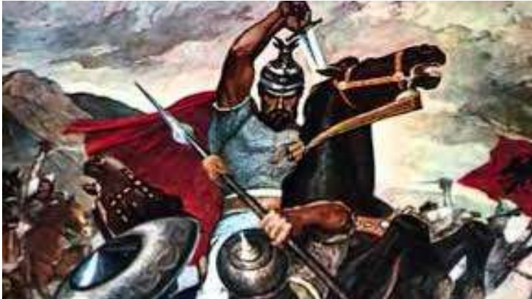
Slika 6. Jure Kastriotić- Skendrebeg ( 1443.-1468.)

Izvor: http://shqiperia.njekomb.com/23461/ , pregledano 3. kolovoz 2018