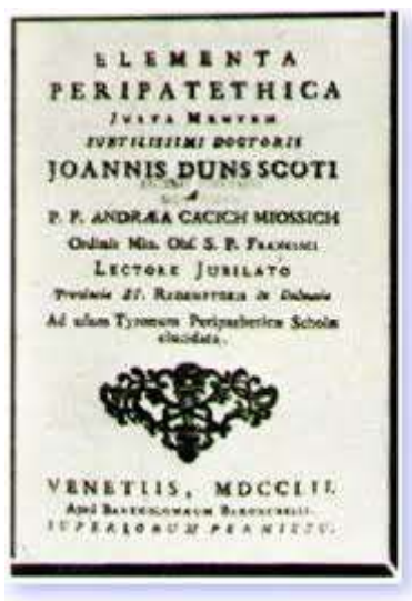
Slika 1 Elementa peripatethica iz 1752. godine