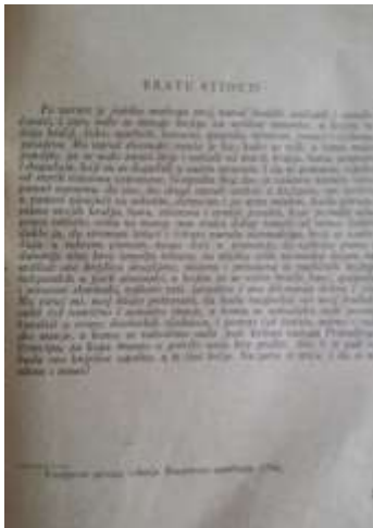
Slika 1. Predgovor prvog izdanja (1756.) Slika 5. Predgovor drugog izdanja (1759.)