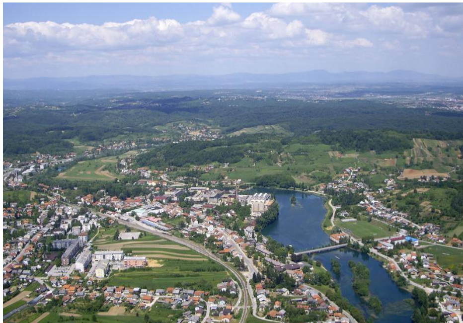
Slika 2: Duga Resa fotografirana iz zraka

Prvi put se Duga Resa spominje 1380. godine, iako ovaj kraj sadrži arheološke nalaze i dokaze naseljenosti još od prapovijesnog doba. Primjerice, lokalitet Sveti Petar Mrežnički važno je arheološko nalazište iz antičkih i rimskih vremena, a dolaskom Hrvata ovo područje postaje važan dio srednjovjekovne hrvatske države, naročito u protuturskim ratovima. U Svetom Petru Mrežničkom bila je osnovana i škola, 1671. godine. Gospodarski razvoj i preobrazba iz sela u suvremeni grad započelo je nakon izgradnje pruge Karlovac – Rijeka 1873. godine te osnivanjem Pamučne industrije 1884. godine, koja je već prije Prvoga svjetskog rata s preko 1000 radnika bila najveća tekstilna tvornica na Balkanu, a po financijskog snazi i veličini u predratnoj Jugoslaviji bila je ubrajana među najveća i najjača poduzeća. (Prus 1984: 7) Općinsko središte postaje 1896. godine, a 1993. godine, nakon uspostave suvremene hrvatske države, konačno dobiva i službeni status grada.