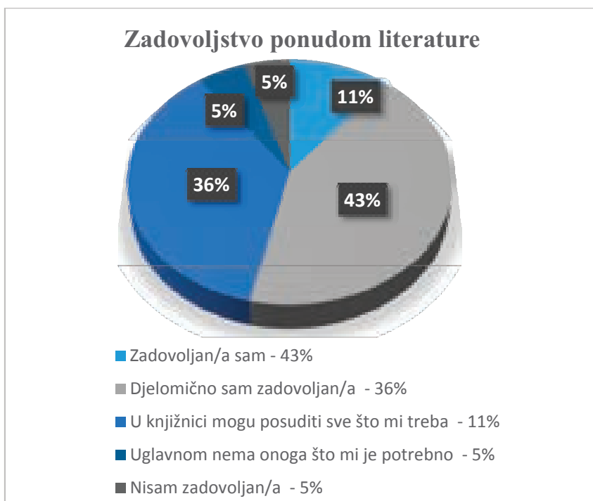
Slika 2. Zadovoljstvo ponudom literature

„Premali broj primjeraka knjiga. Često za literaturu koja mi je potrebna postoje samo jedan, dva ili tri primjerka koja su rijetko dostupna.“