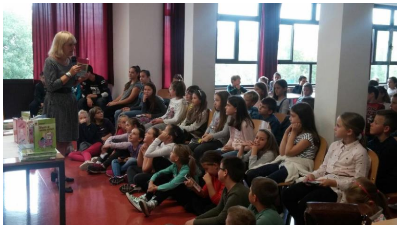
Gostovanje književnice Sanje Pilić

Knjižničarka ove škole svake godine djecu upoznaje sa tekućim lektirnim naslovima, a učenike prvog razreda upoznaje s prostorom knjižnice te načinom posuđivanja knjiga. Redovito se obilježavaju sve važne manifestacije poput Mjeseca hrvatske knjige kroz razne radionice, izradu kreativnih plakata, gostovanje književnika/ca i kvizove koji potiču čitanje.